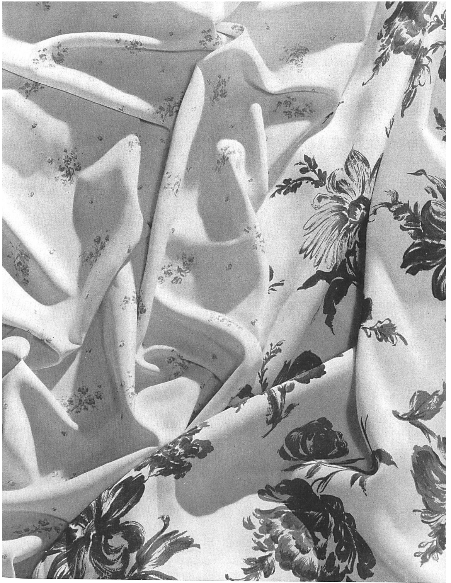
Hausammann & Cie, Winterthour Quelques articles de la nouvelle collection de tissus pour robes et pour lingerie