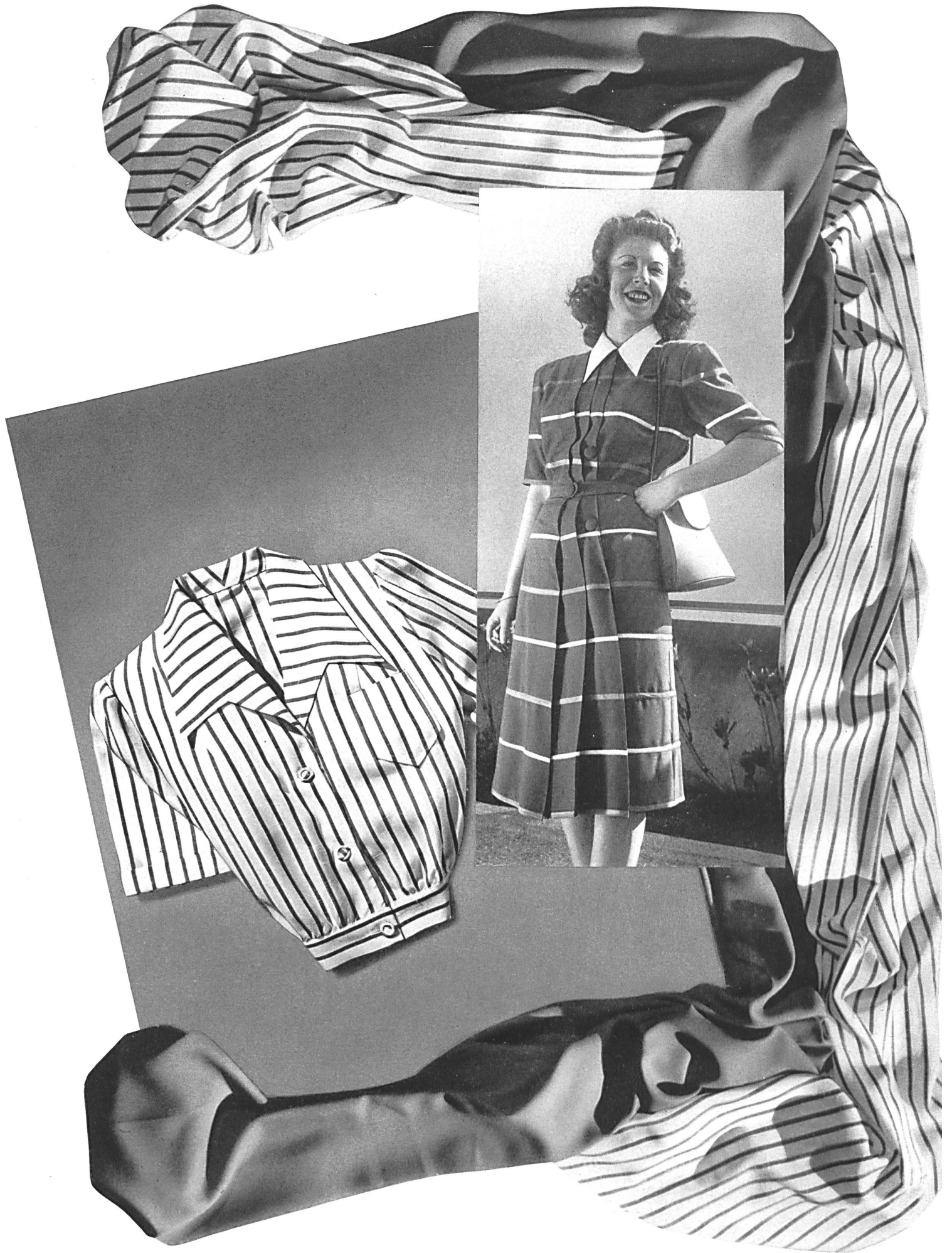
Christian Fischbacher Co., St-Gall Eolienne et Diagonal de fibranne Atelier Honegger-Lavater