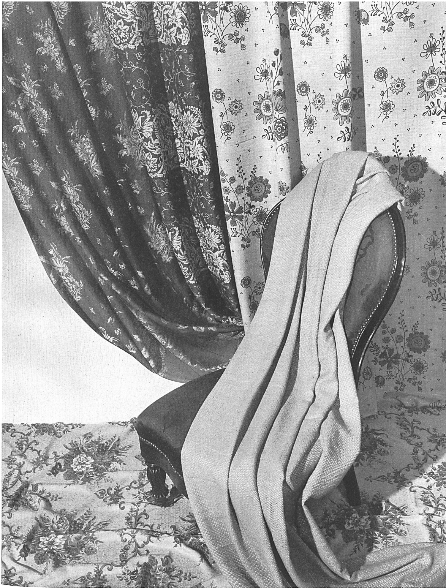
Société Anonyme A. & R. Moos, Weiblingen/Zeh. Tissus décoration: imprimés, Jacquard, tissés en couleurs, unis. Tissus pour ameublement. Chintz S.T. Studio