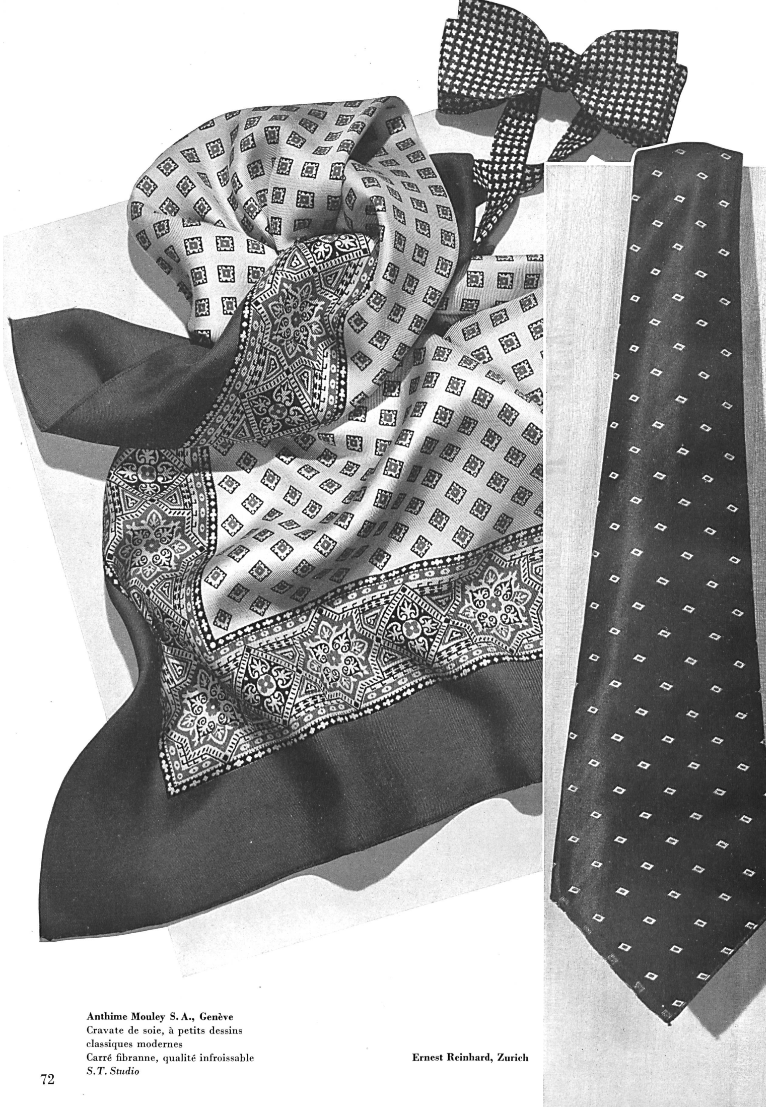
Anthime Mouley S. A., Genève Cravate de soie, à petits dessins classiques modernes Carré fibranne, qualité infroissable S.T. Studio