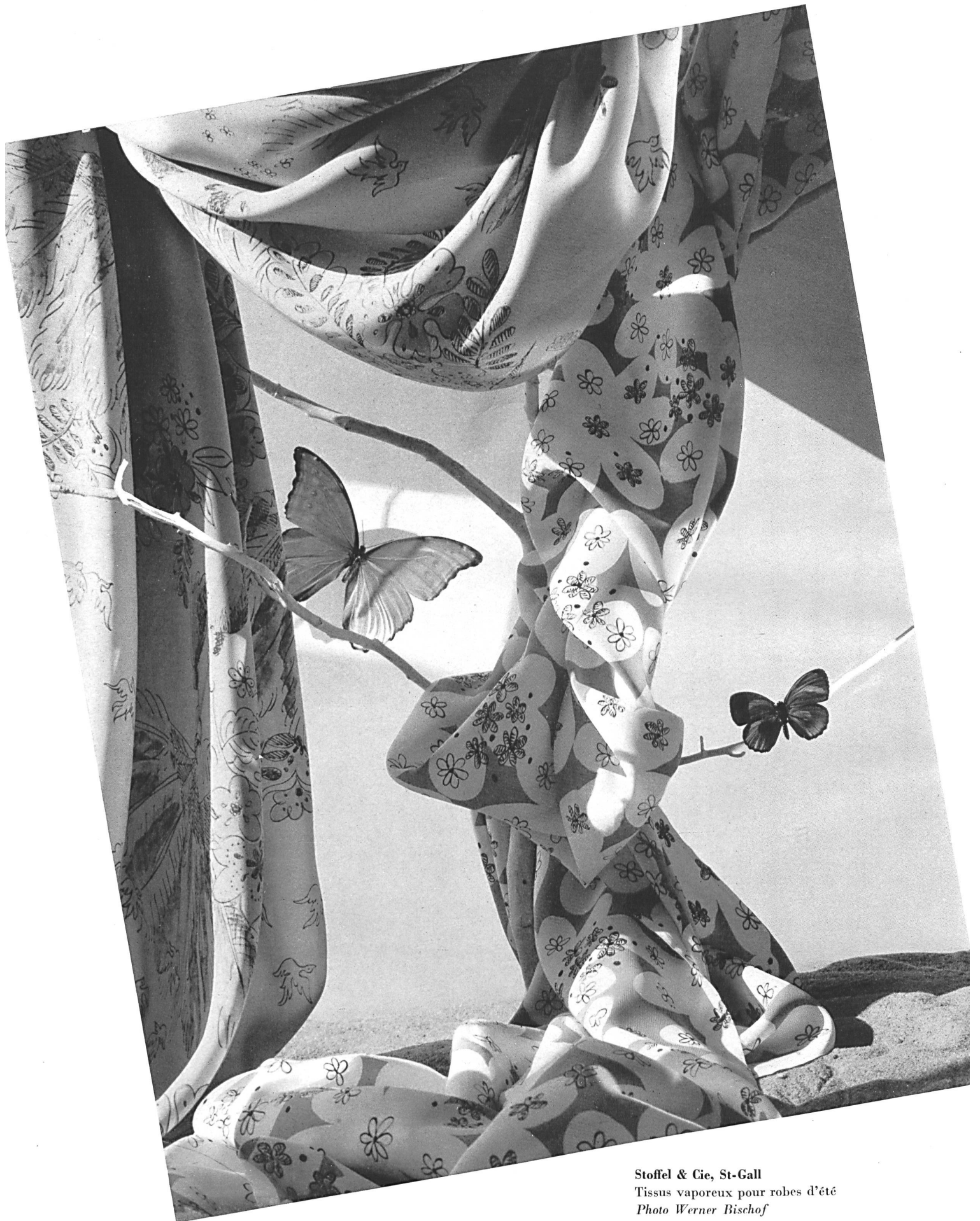
Stoffel & Cie, St-Gall Tissus vaporeux pour robes d'été