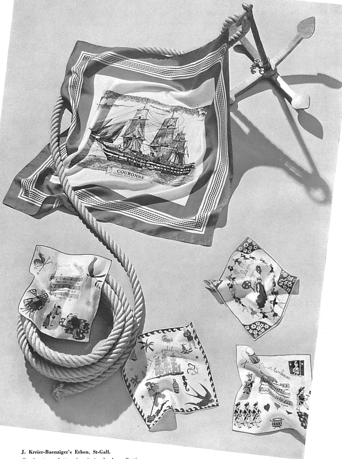
J. Kreier-Baenziger's Erben, St-Gall. Carrés et pochettes imprimés de la collection « MOUCHOIRS KREIER ». Photo Guggenbühl.