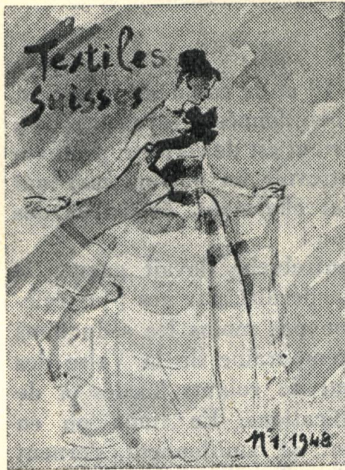
Modèle de la confection zurichoise réalisé avec un tissu de coton de St-Gall.