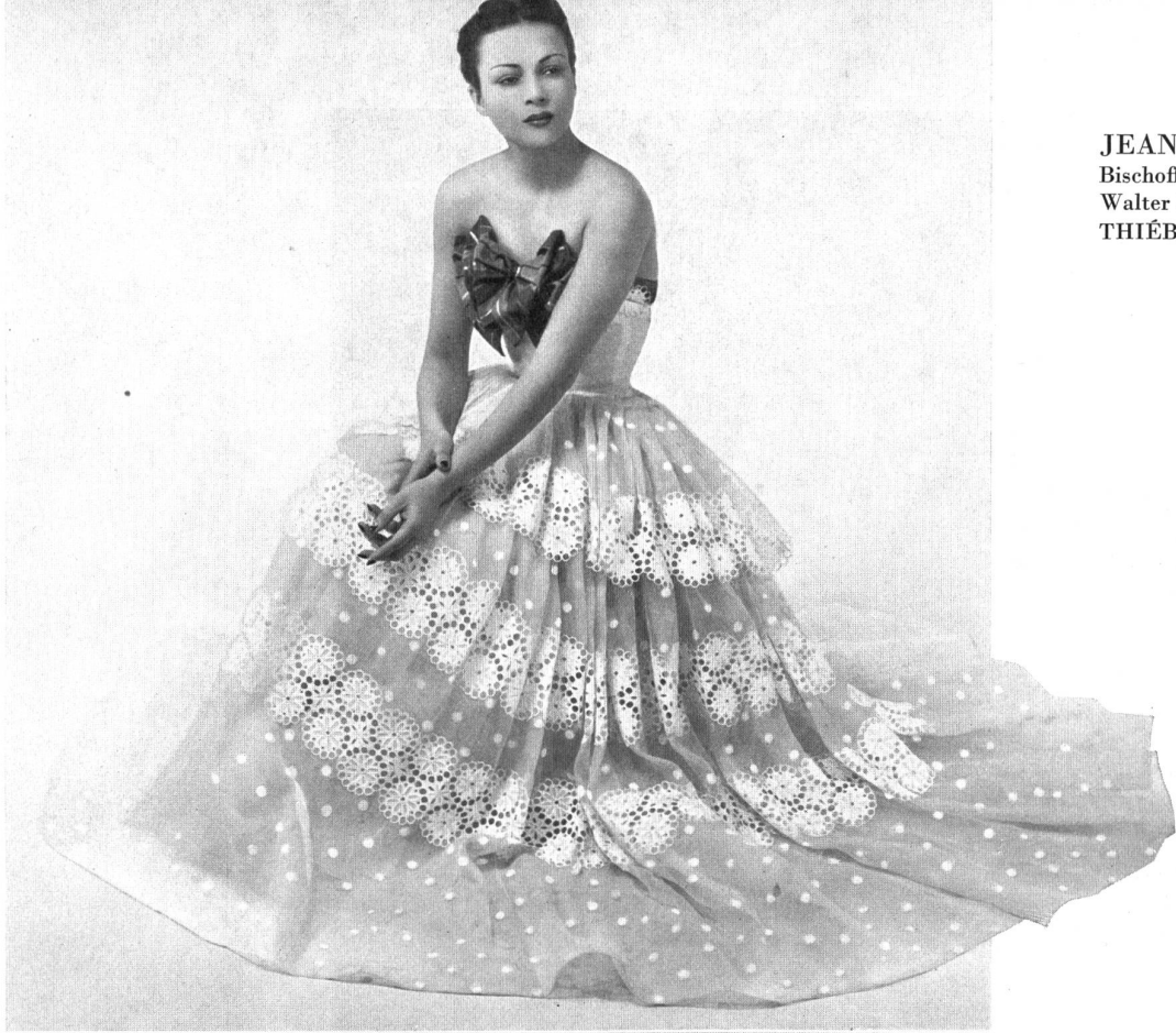
JEANNE LANVIN Bischoff Textiles S. A., St-Gall Walter Schrank & Cie, St-Gall THIÉBAUT-ADAM, PARIS