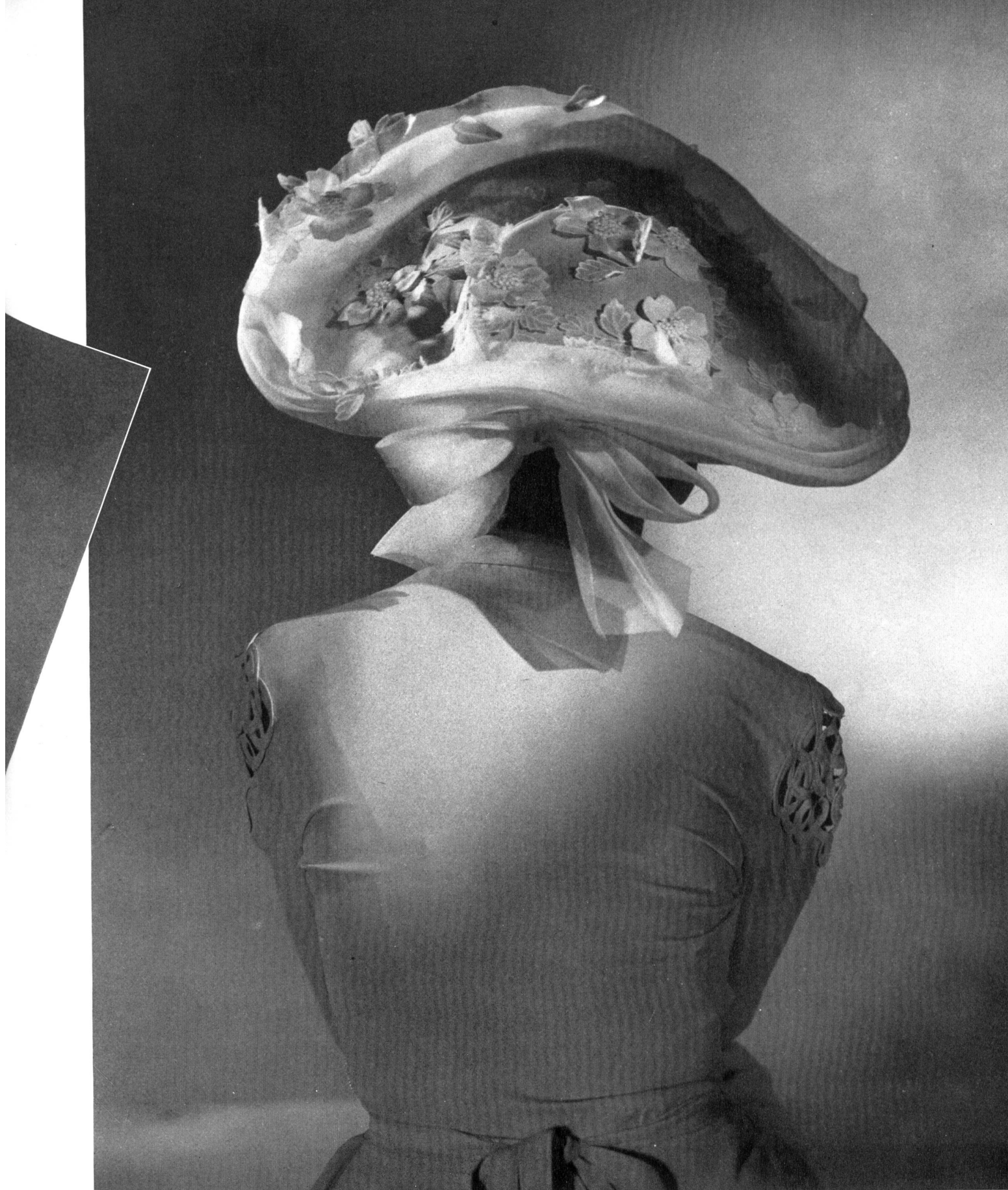
LEGROUX SOEURS A. Naef & Cie, Flawil INAMO, ZURICH