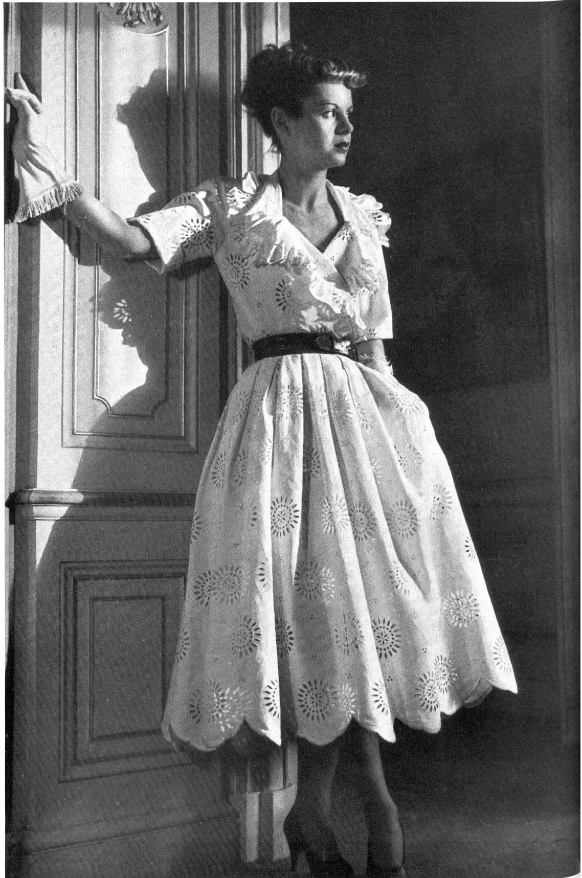
MAGGY ROUFF Union S. A., St-Gall Stoffel & Cie, St-Gall PIERRE BRIVET FILS, PARIS