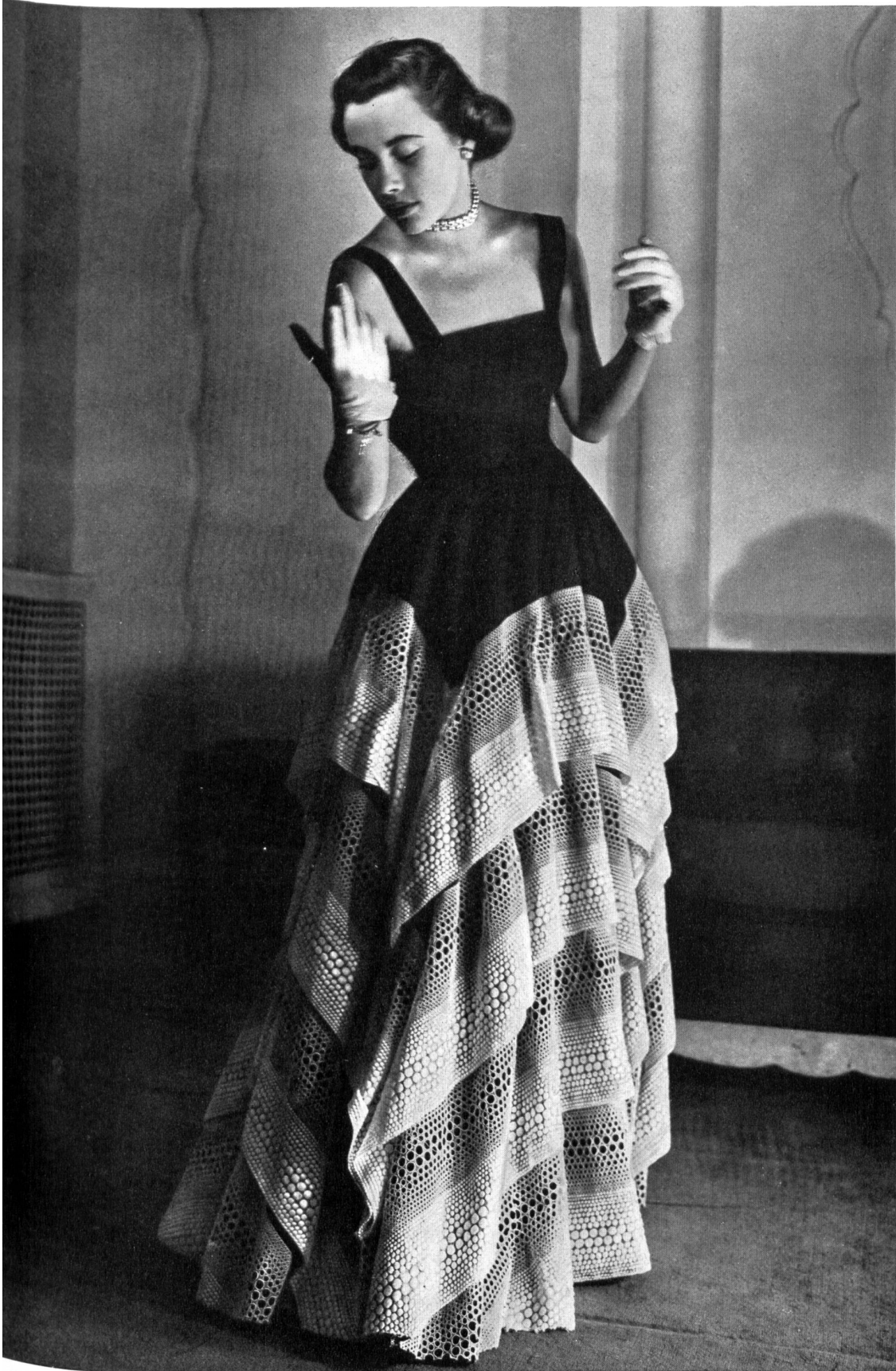
JEAN DESSÈS Reichenbach & Co., St-Gall THIÉBAUT-ADAM, PARIS