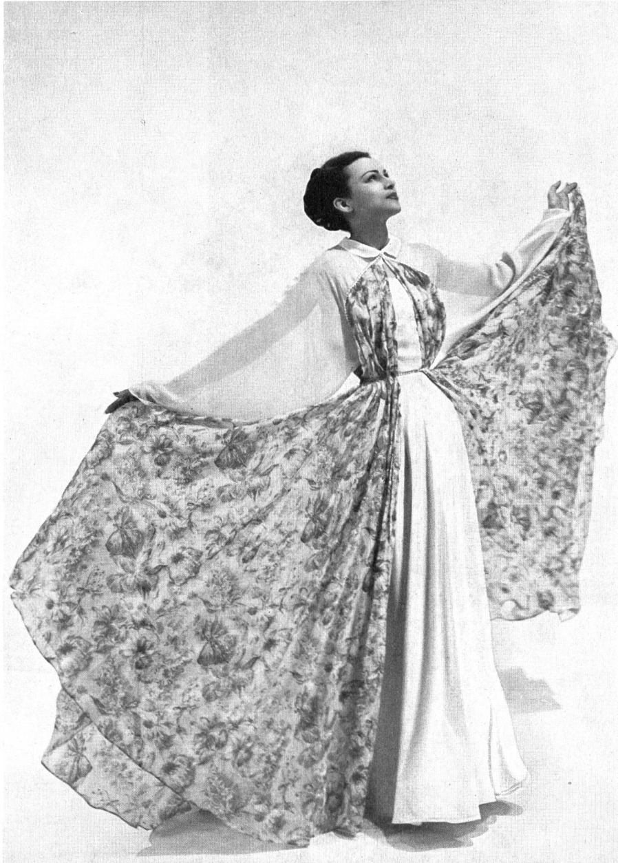
JEANNE LANVIN Reichenbach & Co., St-Gall THIÉBAUT-ADAM, PARIS