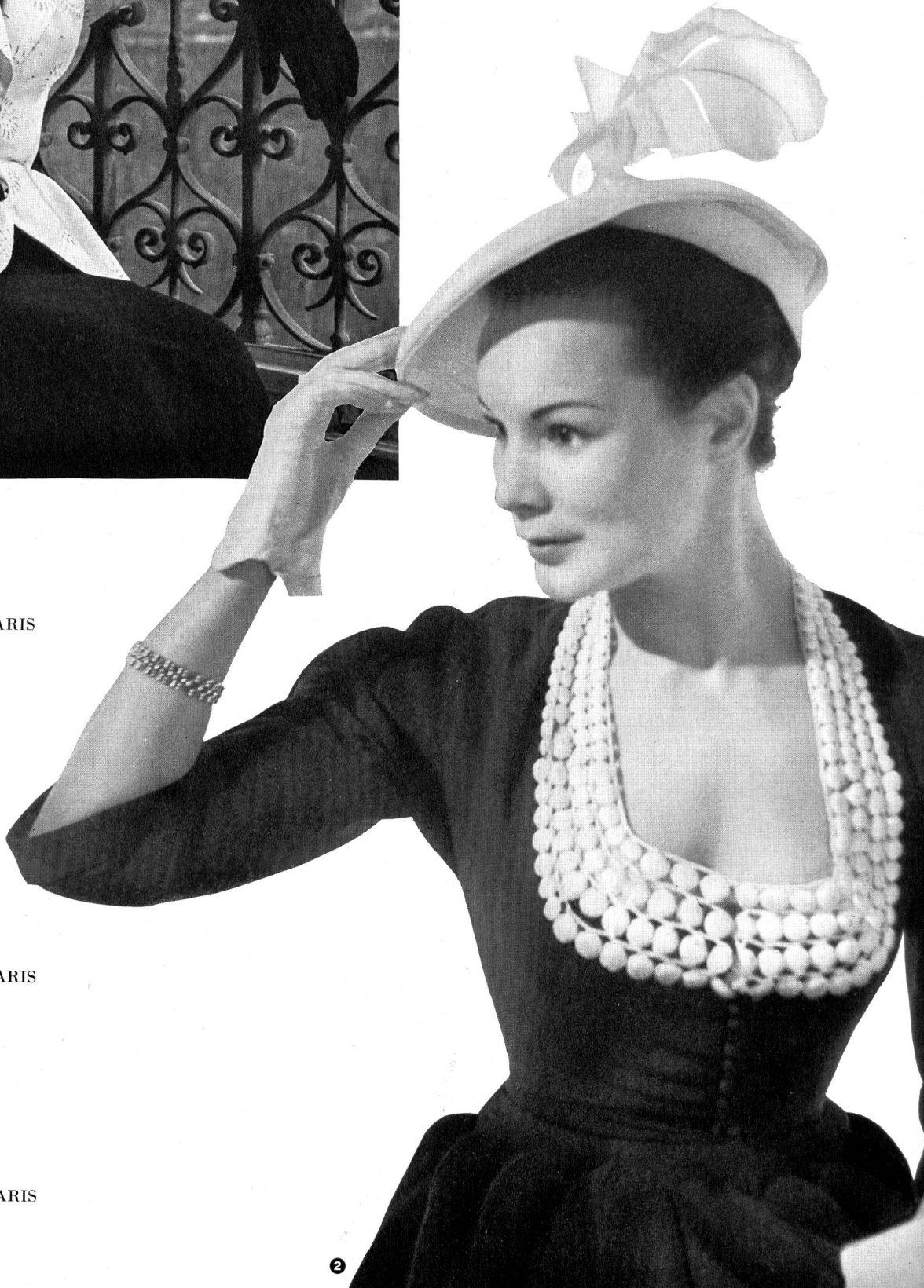
6 CARVEN Union S. A., St-Gall PIERRE BRIVET FILS, PARIS