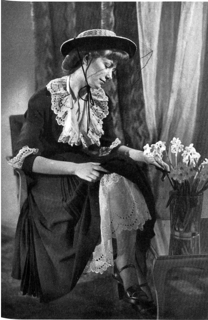
VÉRA BORÉA J. G. Nef & Co., Herisau THIÉBAUT-ADAM, PARIS