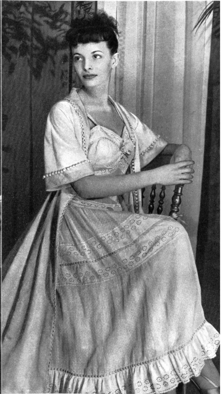
PIERRE BALMAIN A. Naef & Cie, Flawil MARESCOT, PARIS