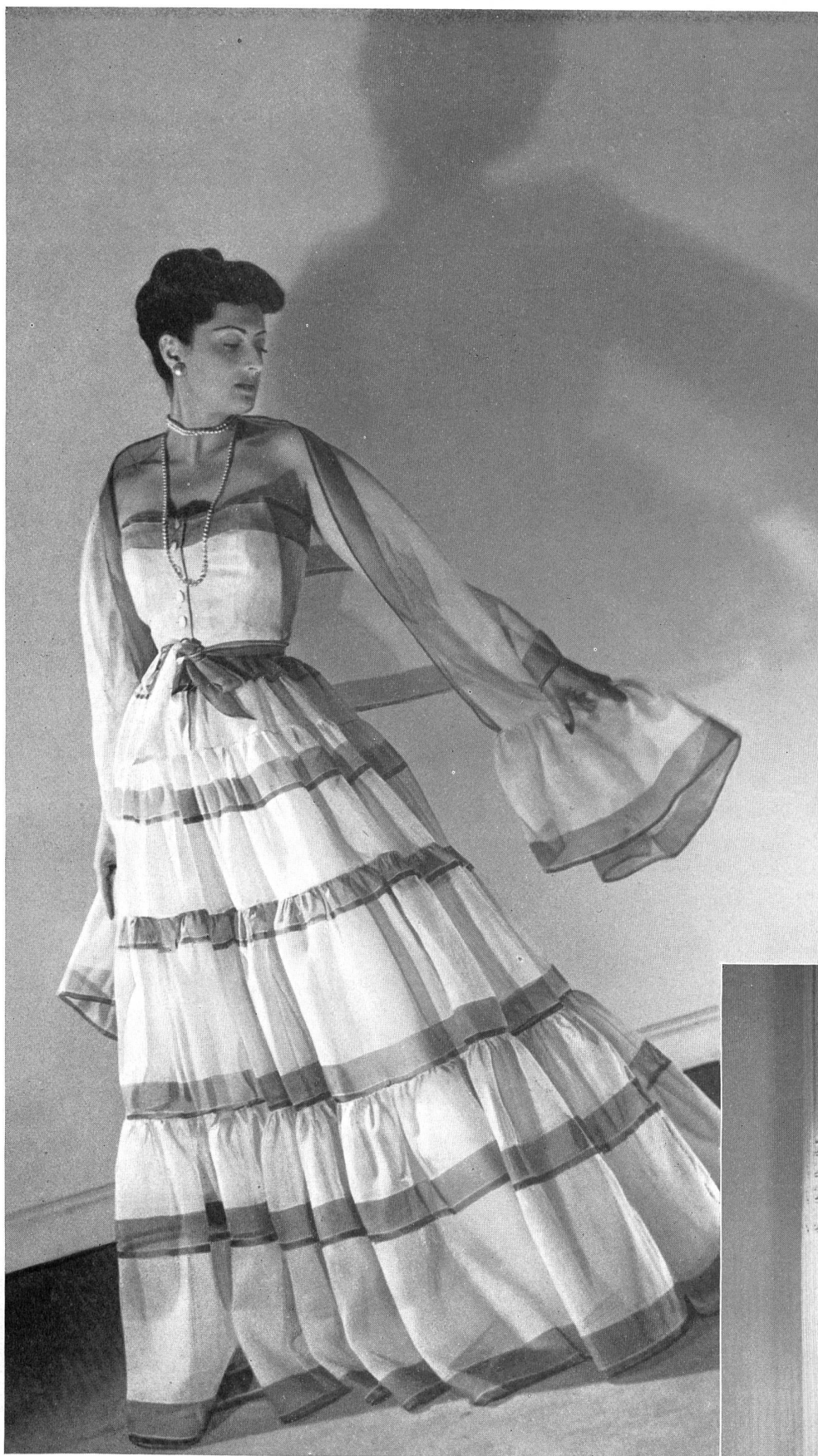
BALENCIAGA Stoffel & Cie, St-Gall. INAMO, ZURICH.