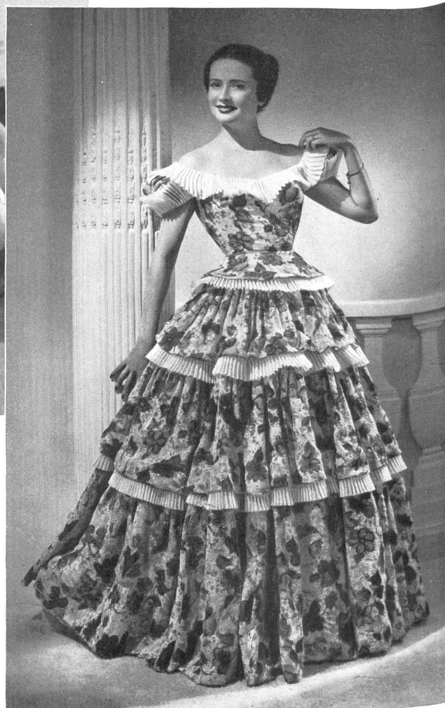
CARVEN Stoffel & Cie, St-Gall. ROUBAUDI, PARIS.