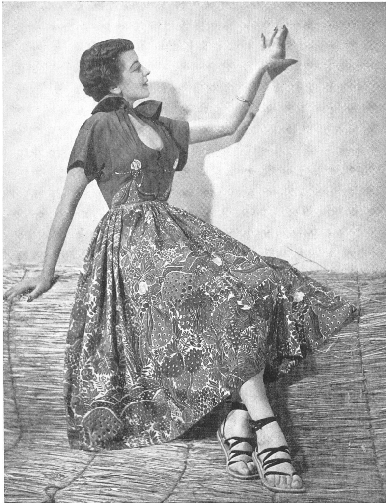
RAPHAEL Rudolf Brauchbar & Cie, Zurich