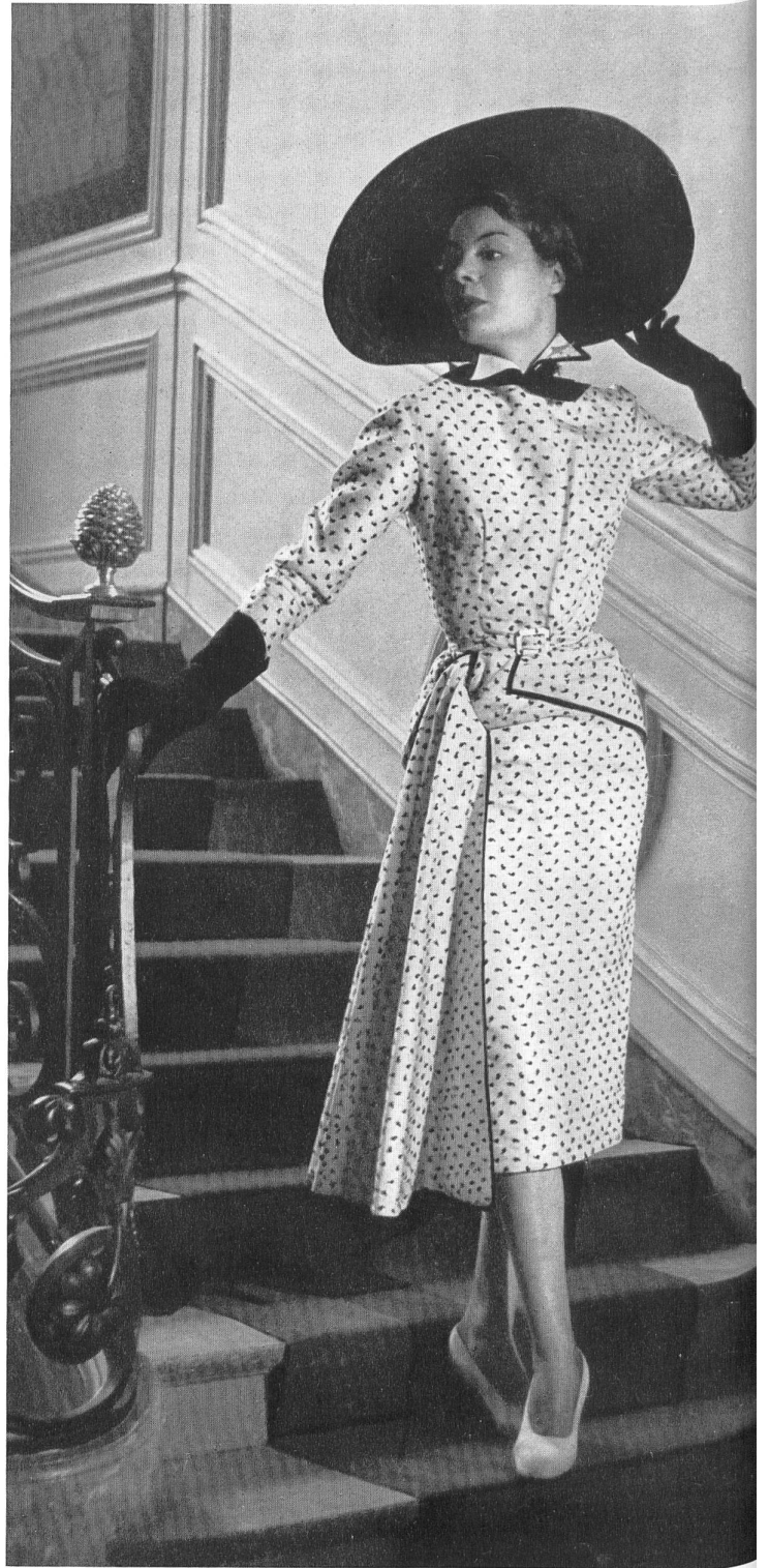
JACQUES FATH L. Abraham & Cie Soieries S. A., Zurich