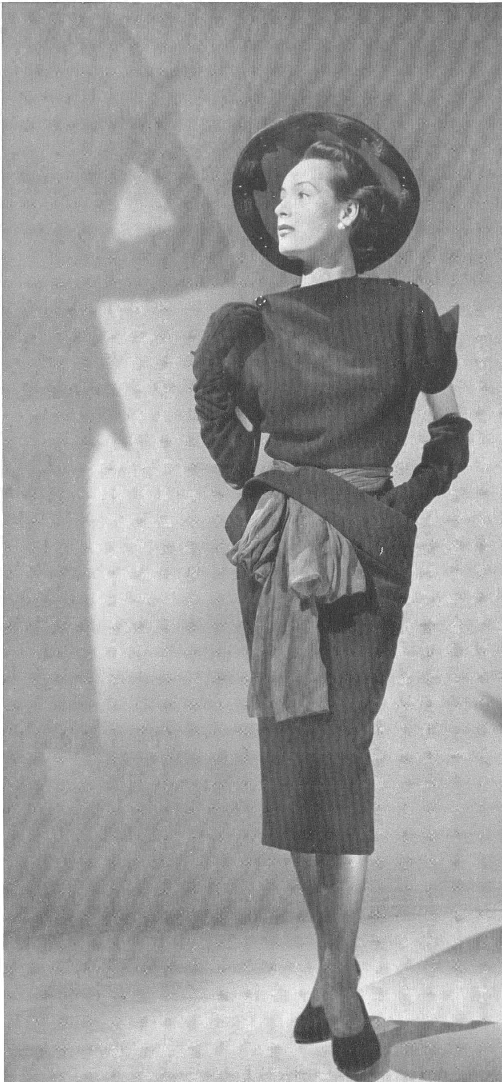
CHRISTIAN DIOR Emar S. A., Zurich INAMO, ZURICH