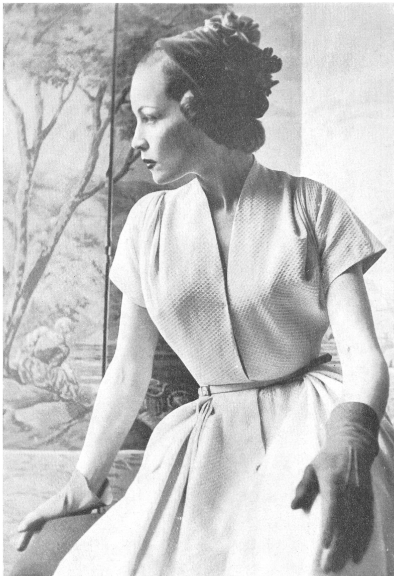
MANGUIN Stoffel & Cie, St-Gall INAMO, ZURICH