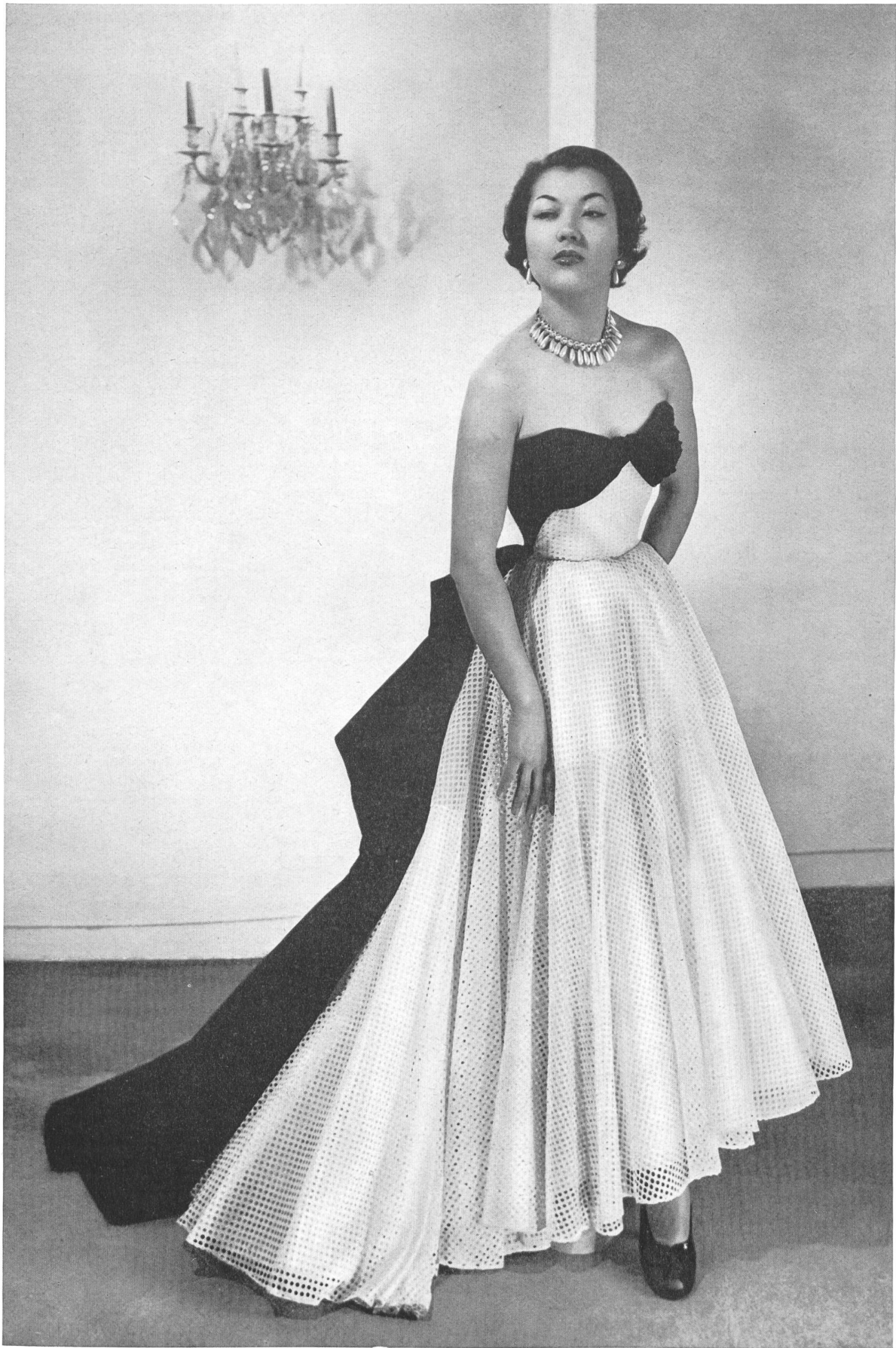
NINA RICCI J. G. Nef & Cie, Hérisau M. GUITRY, PARIS