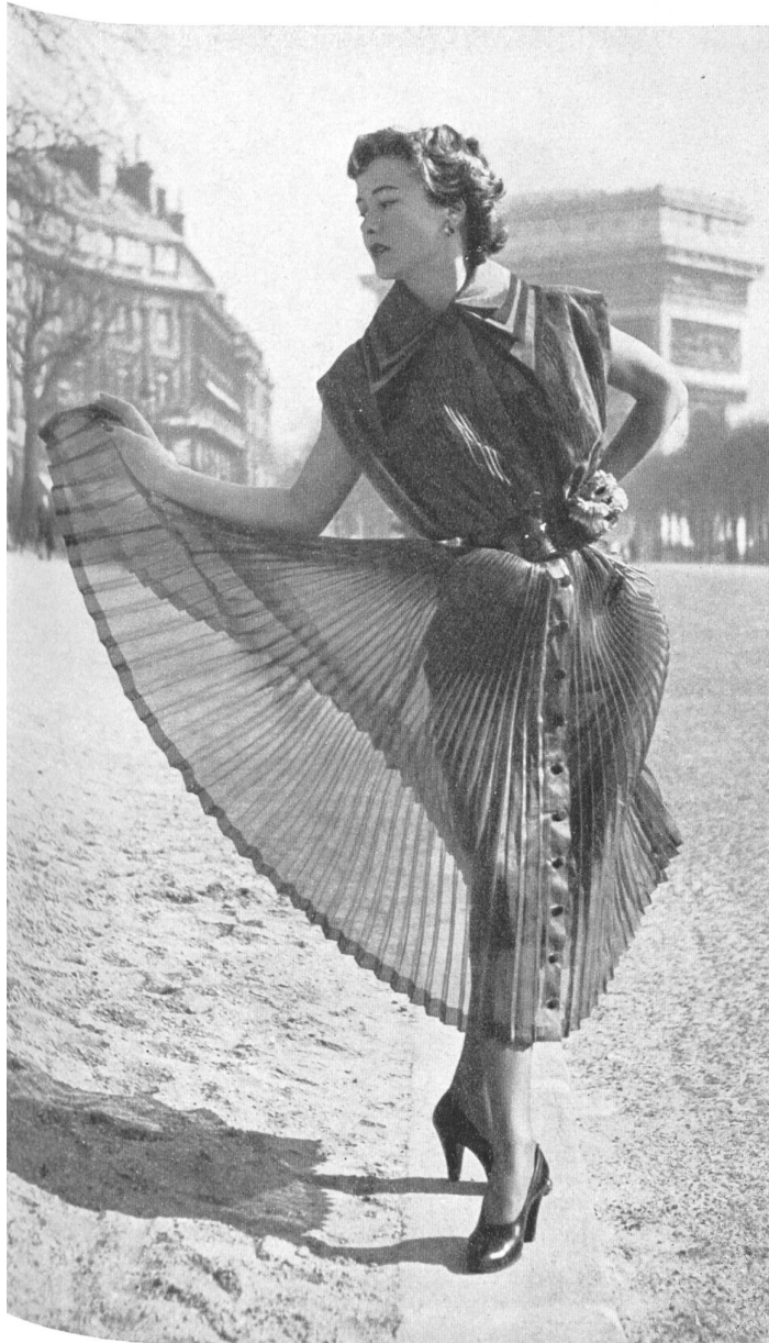
ALWYNN L. Abraham & Cie, Soieries S. A., Zurich