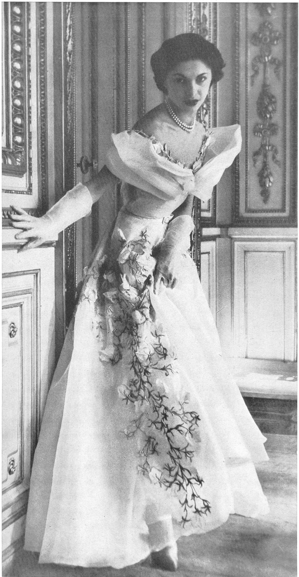
JEAN DESSÈS Forster Willi & Cie, St-Gall INAMO, ZURICH