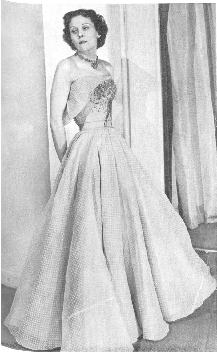
NINA RICCI Union S. A., St-Gall PIERRE BRIVET FILS, PARIS