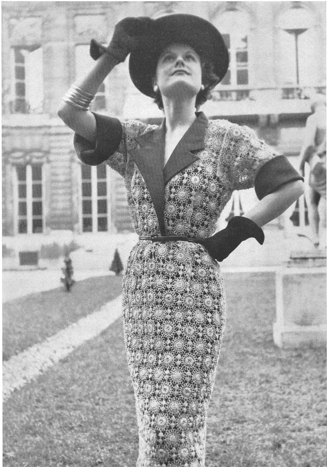
MAGGY ROUFF A. Naef & Cie, Flawil INAMO, ZURICH