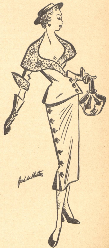
Petit deux-pièces largement orné de broderie de Saint-Gall. Modèle Schlatter.