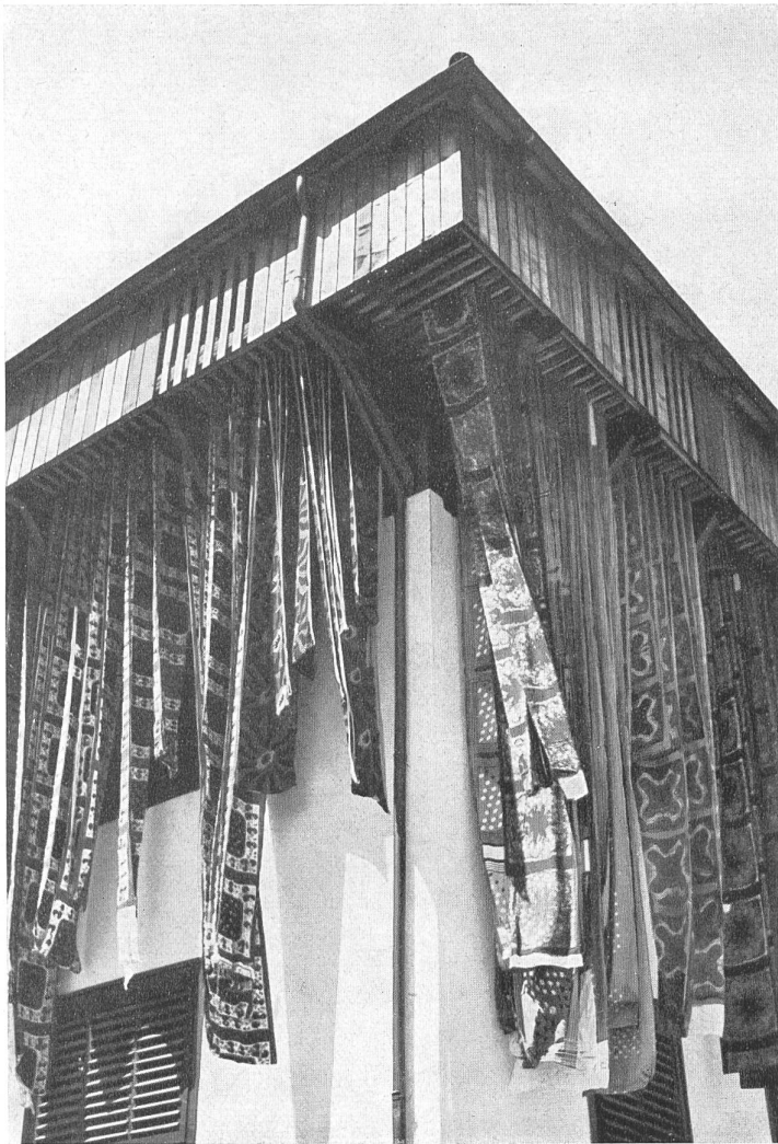
Encore aujourd'hui on voit des tissus imprimés sécher à l'air libre, suspendus aux antiques « tours de séchage ».

Tel est le prestige du travail à la main qu'il maintient ses droits dans tous les domaines de l'industrie, partout où l'on exige non seulement une précision que la machine la plus perfectionnée ne peut assurer, mais au contraire un élément personnel particulier que la machine n'a pas. Qui songerait à acheter une montre dont toutes les pièces auraient été assemblées par une machine sans qu'un ouvrier spécialisé y soit pour quelque chose ou une auto dont le moteur n'aurait pas été soigneusement contrôlé et mis au point par l'œil et la main exercés d'un mécanicien ? Et pas plus, donc, que cette finesse du réglage, la machine ne peut donner la note personnelle que l'on recherche dans un produit destiné à l'agrément plus qu'à l'utilité. La machine à rouleaux imprime sans défaillance, mais sans fantaisie, des centaines de milliers de mètres de tissu... les reports exacts de l'impression au cadre sont encore trop exacts et, malgré la perfection de l'exécution, à cause plutôt de cette perfection, certains clients n'y trouvent plus le petit détail qui trahit la main de l'homme, qui donne la note individuelle et, partant, une valeur particulière à un tissu imprimé.