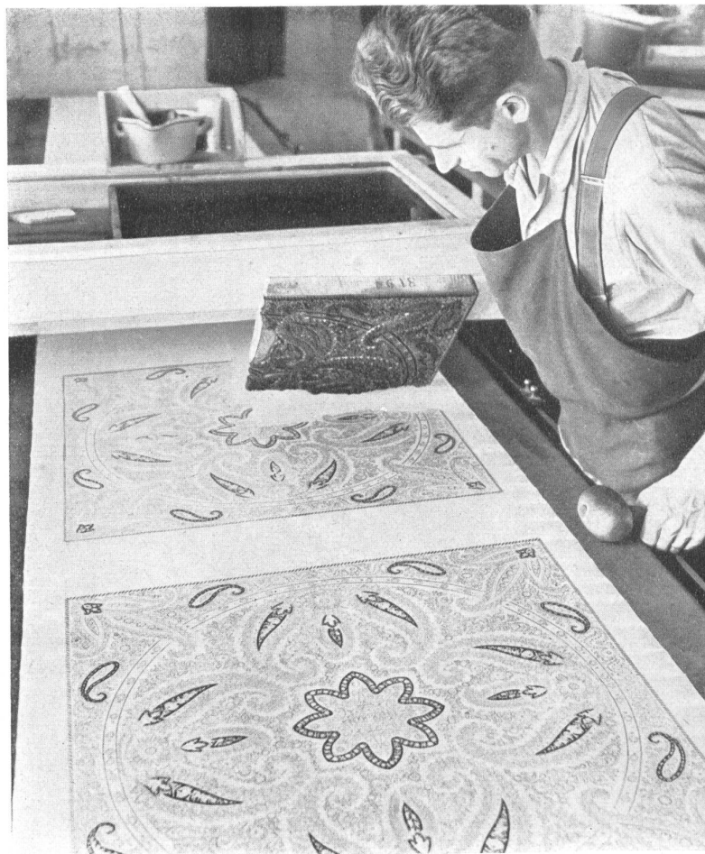
L'impression à la main. L'ouvrier tient dans la main gauche le marteau avec le manche duquel il frappera la planche pour l'appliquer étroitement sur le tissu.