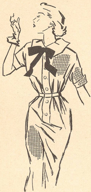
Robe chemisier en taffetas quadrillé bleu de Mollie Parnis, New-York.

Le taffetas est en vogue, on en fait des robes, des costumes, des blouses, des doublures et mille accessoires. Dans une collection de splendides taffetas importés de Zurich on est frappé par la qualité du tissu, sa souplesse et par la variété infinie des coloris. Ce sont toutes les couleurs de l'arc-en-ciel qui s'of-