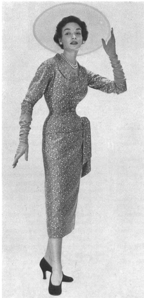
ELIZABETH ARDEN, NEW YORK Printed Atout.

All fabrics are from L. Abraham & Cie, Soieries S. A., Zurich