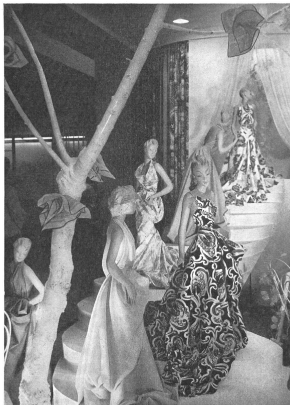
Broderies et cotons fins de Saint-Gall.