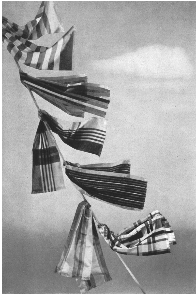
Echarpes en pure soie de : Pure silk scarves by : Bandanas de pura seda de : Reinseidene Schärpen von : De Bary & Cie S. A., Bâle.