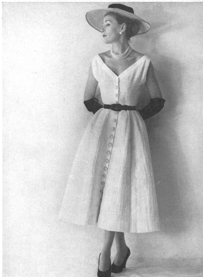
Batiste blanche plissée horizontalement de Reichenbach & Co., St-Gall distribué par Montex, Paris.