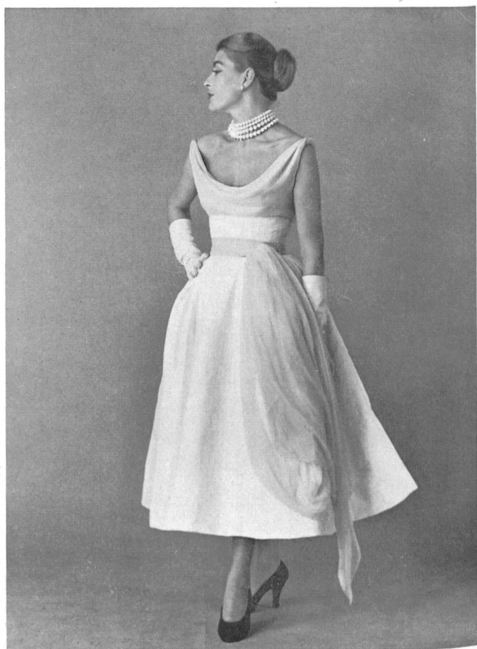
Coton jacquard blanc piqué fantaisie de Rudolf Brauchbar & Cie, Zurich distribué par Montex, Paris.