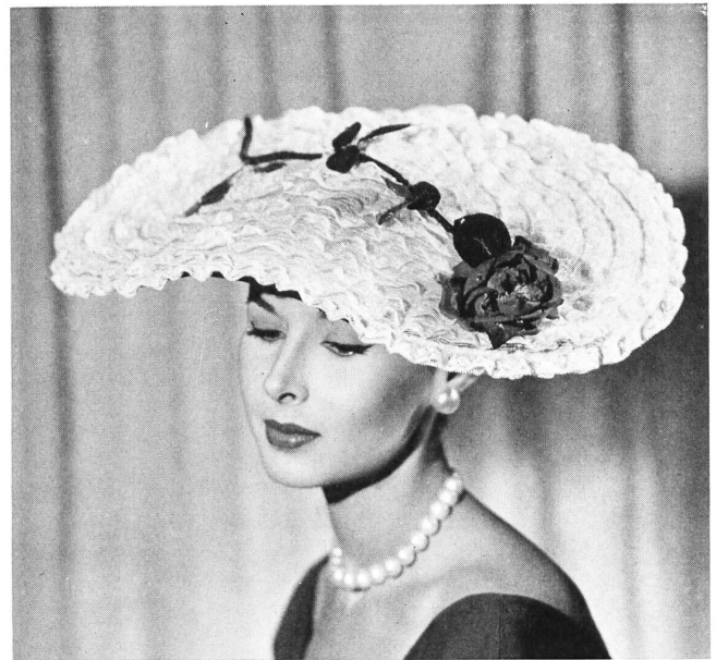
Swiss straw lace

Le principal conseil que Rex donne aux femmes c'est d'être, avant tout, naturelles. Beaucoup de ses plus belles clientes sont des femmes aux cheveux blancs, qui sont parvenues à développer un charme personnel et qui, étant assez âgées pour se connaître elles-mêmes, ont renoncé à lutter vainement pour être autres qu'elles sont... et plus jeunes.