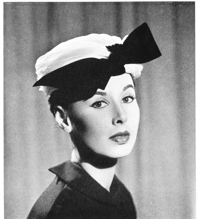
Swiss white organdy