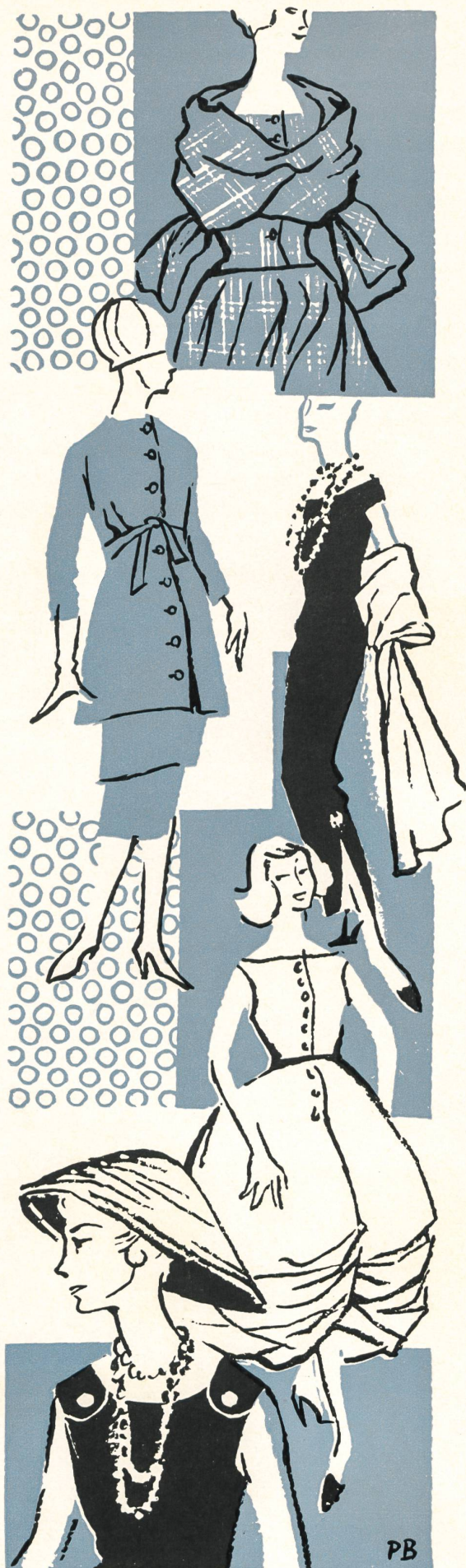
Détails, de haut en bas — Carven : deux-pièces Prince de Galles avec écharpe de même tissu ; Jacques Heim : deux-pièces en lainage beige ; Christian Dior : robe du soir en crêpe, demi longueur, fendue et retenue par un bijou aux genoux, écharpe de même tissu ; Guy Laroche : robe bulle en mousseline imprimée retenue devant ; Christian Dior : robe de cocktail.

Les cols de tailleurs, de robes, de blouses. Là, c'est le «grand jeu». Tout ce qu'on peut imaginer, en fait de cols, on le voit chez les couturiers. Il vous suffira d'en choisir un qui convienne à votre cou et à vos épaules.