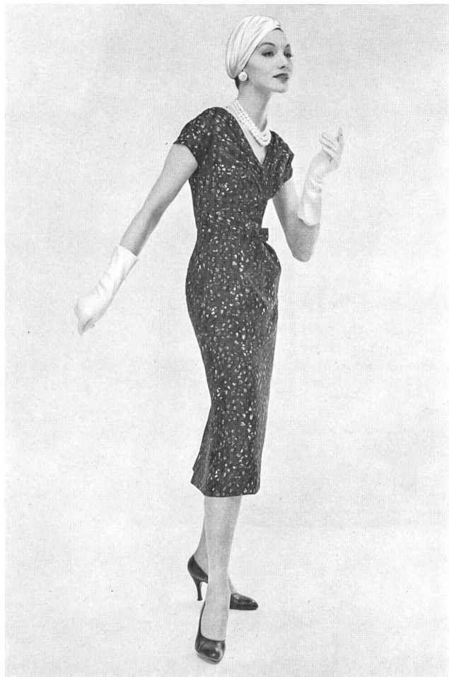
L. ABRAHAM & Co. SILKS Ltd., ZURICH

Ces précieuses broderies qui ont la distinction des bijoux véritables, ont une destination toute naturelle : la couture et la meilleure classe de confection américaine. En maniant ces tissus souples et soyeux, en effleurant le délicat relief des fleurs brodées, dont les points sont aussi rapprochés que ceux des premières broderies à la main faites en Appenzell, on réalise que le métier à broder, quand il reste l'instrument d'artisans aussi habiles et fiers de leur art, peut encore produire la beauté et la perfection en broderie,