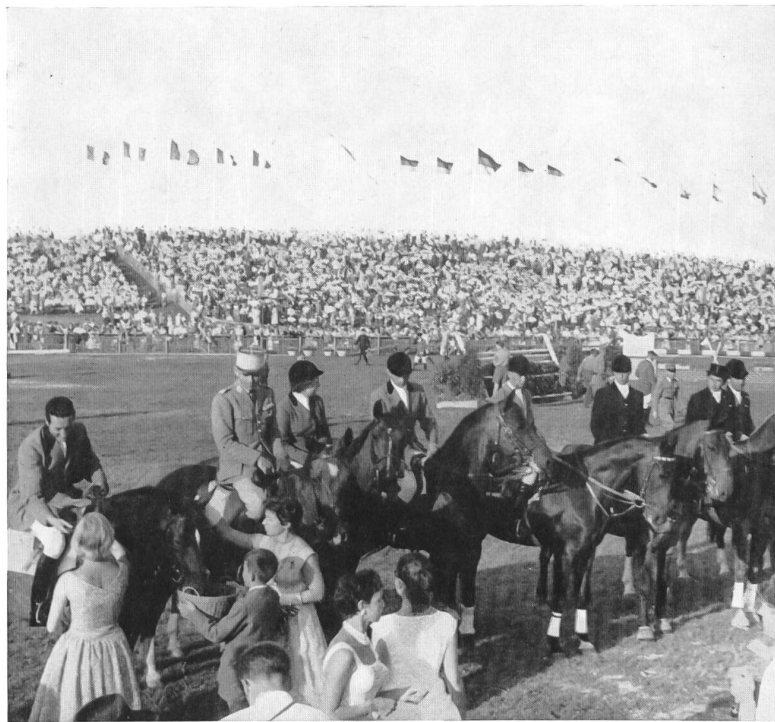
Prix des Banques saint-galloises, les vainqueurs.