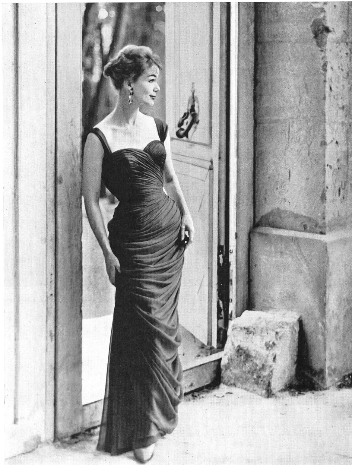
PIERRE BALMAIN Mousseline « Follette » de L. Abraham & Cie, Soieries S. A., Zurich