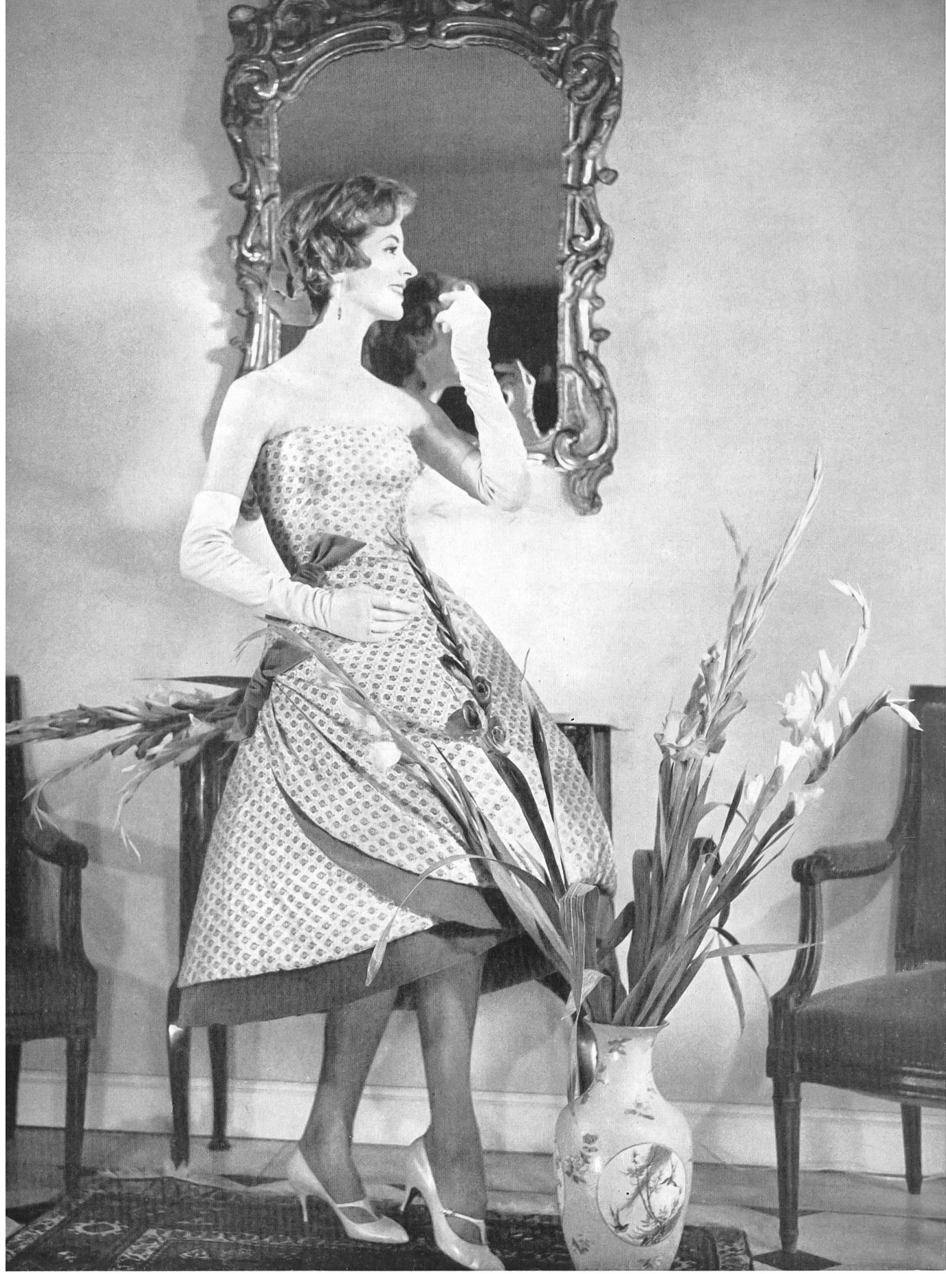
JACQUES HEIM Tissu de Stehli & Co., Zurich