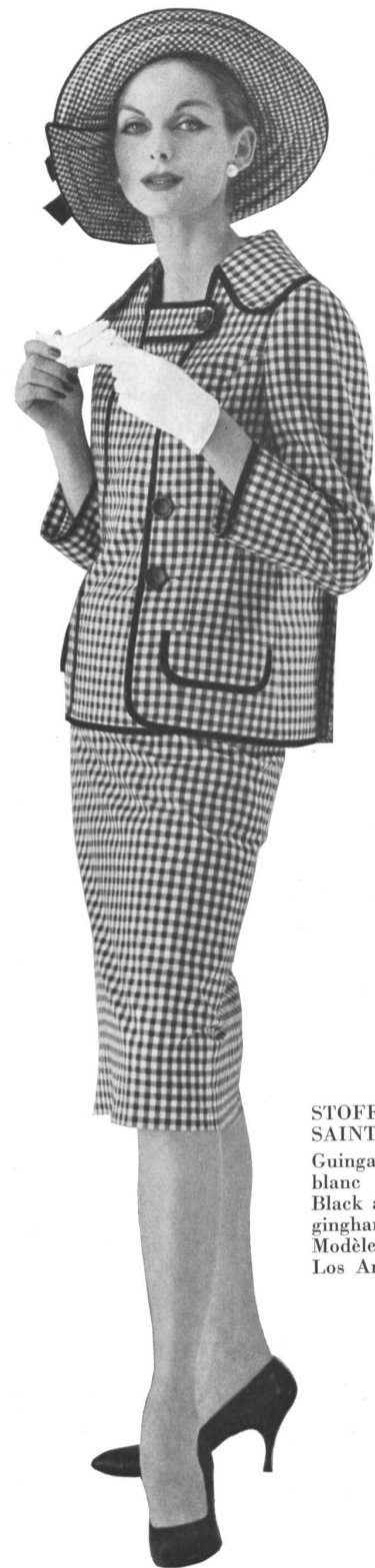
STOFFEL & CO., SAINT-GALL Guingan damier noir et blanc Black and white checked gingham Modèle : Galanos, Los Angeles