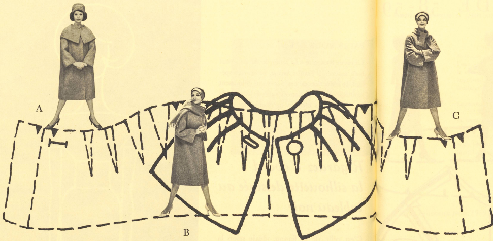
Patron dernière heure N° 4402. Prix: Fr. s. 5.—

Un manteau d'hiver, à la carrure élargie, fermé ras du cou par un seul bouton, au devant à peine appuyé par de longues pinces, au dos gonflé par un pli souple réservé sur chaque épaule. Sa forme convient à toutes, mais faites-le toujours assez court: son élégance tient à une bonne proportion entre sa longueur et sa largeur. Selon que vous êtes plus ou moins frileuse, et que vous avez ou non un cou de cygne, vous choisirez entre les 3 photos ci-dessus. A. Le col pélerine travaillé de pinces, qui peut se porter couvrant les épaules, ou légèrement remonté autour du visage. B. La longue écharpe faite d'une bande simple, prise sur toute la largeur du tissu, bordée d'un ourlet bagué et effrangée aux deux extrémités. C. La cravate double coupée comme un col, dessus et dessous identiques, avec une couture au milieu de l'encolure au dos, dans le biais; les deux pans plus étroits sont droit fil et effrangés. Sur la photo A, le bonnet de Roger Heim est exécuté dans le tissu du manteau. Coiffure en trompe-l'œil de Carita. Photos B et C: cloche en feutre de Roger Heim. Pour les trois photos: gants du Gant Perrin, escarpins Carvil.