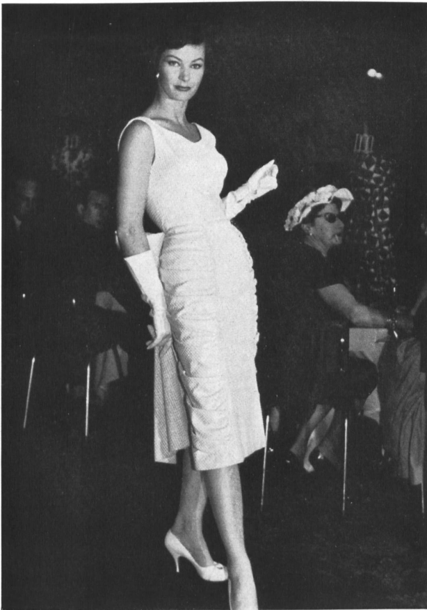
Luxor lamé, façonné ; infroissable. Luxor, crease resisting figured lamé. (Staple fibre - cotton - Lurex.)