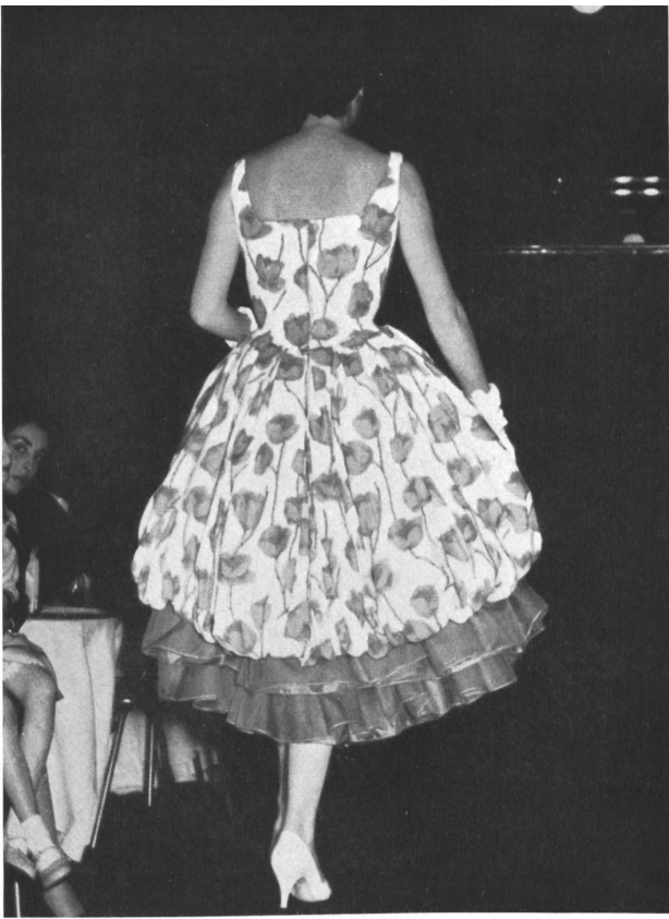
Toile Capri imprimée/Printed Toile Capri. (Cotton - viscose.)