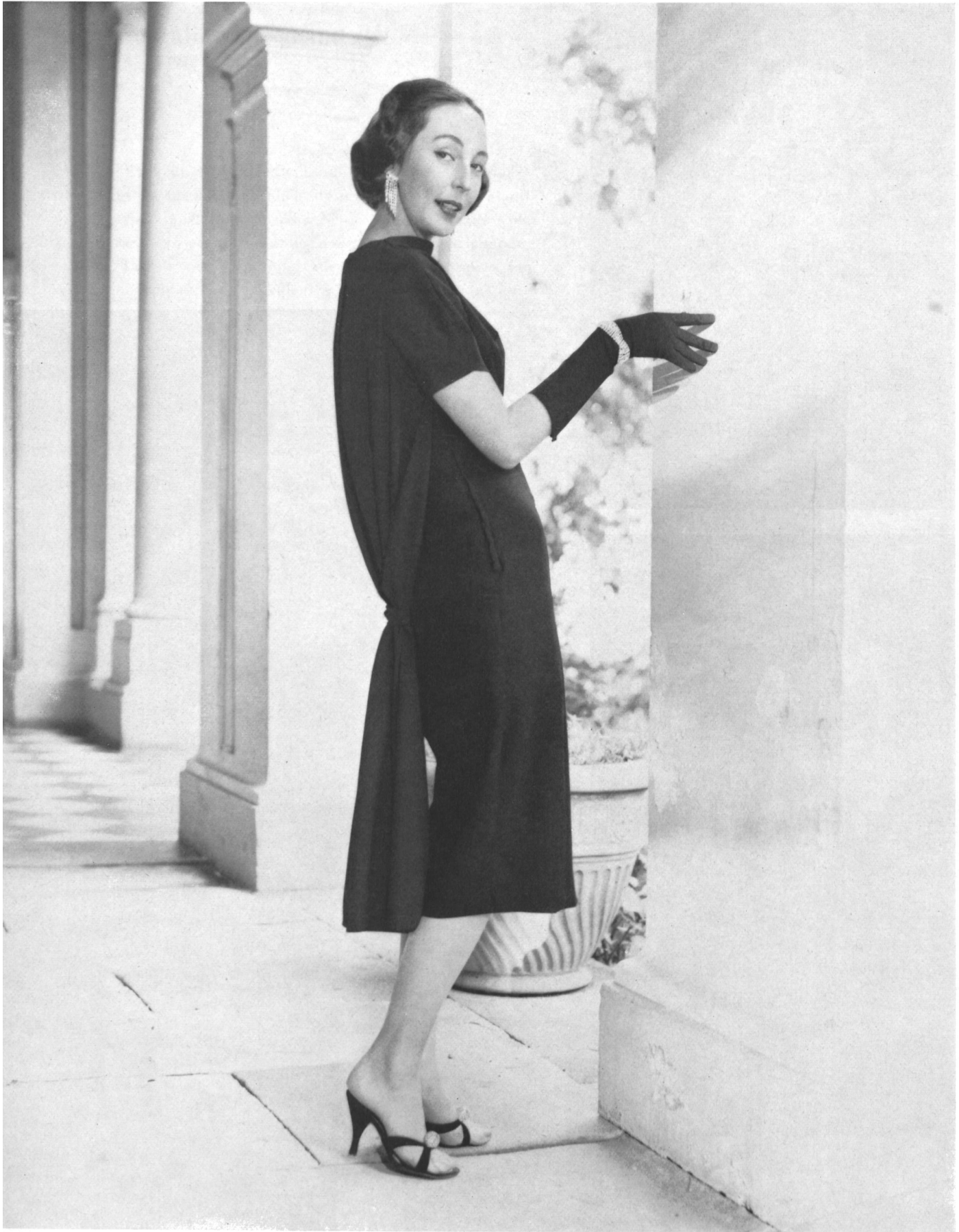
ROBT. SCHWARZENBACH & CO., THALWIL Crêpe « Amorosa ». Model by Continental Modes Pty. Ltd., Sydney.