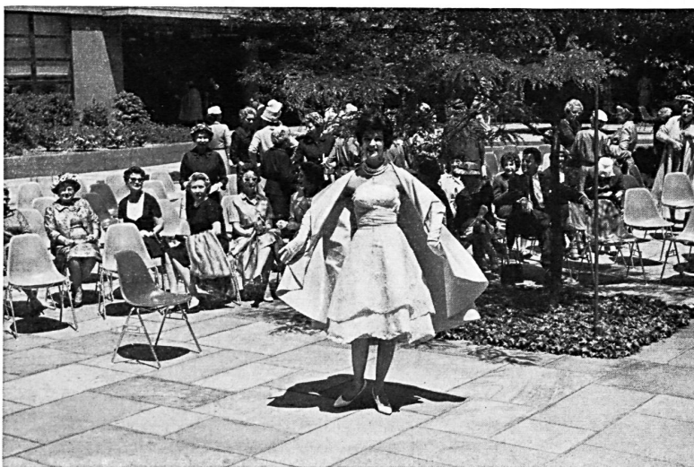
Embroidered organdie Organdi brodé Modèle Pauline Trigère, New York