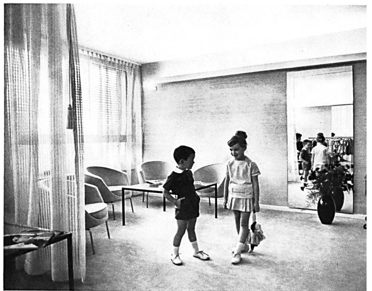
Coup d'œil dans un salon

La Maison suisse de la mode représente un pas en avant du prêt à porter suisse, qui mérite d'autant plus d'être salué avec joie, que les fabricants intéressés offrent tous la garantie d'une qualité certaine et parfois même hors classe.