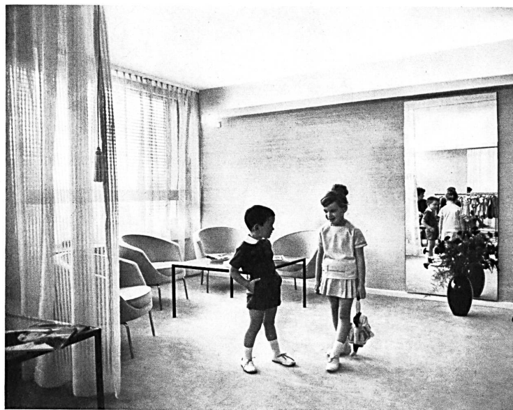
Coup d'œil dans un salon

La Maison suisse de la mode représente un pas en avant du prêt à porter suisse, qui mérite d'autant plus d'être salué avec joie, que les fabricants intéressés offrent tous la garantie d'une qualité certaine et parfois même hors classe.