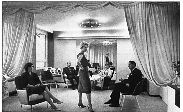
Une présentation dans un salon particulier

Depuis quelques mois, une idée qui était dans l'air depuis longtemps a trouvé sa réalisation, c'est la « Maison suisse de la mode », à Zurich. L'idée, c'était celle d'une collaboration libre dans le domaine de la « promotion » et de la vente, qui avait déjà provoqué la création du groupe « Pro Tricot Suisse » il y a deux ans environ (formule permettant à un certain nombre de fabricants suisses d'unir leurs efforts dans le domaine de la propagande tout en conservant leur liberté en matière de création et de vente). Partie des mêmes milieux, l'idée de la Maison de la Mode allait plus loin : il s'agissait d'offrir à des fabricants de bonneterie et de prêt à porter ne résidant pas à Zurich la possibilité de présenter leurs collections dans cette ville, dans des conditions favorables, sans abdiquer leur personnalité. Avec l'aide du Syndicat des exportateurs suisses de l'industrie de l'habillement, vingt-six producteurs suisses ont uni leurs efforts pour créer le centre permanent de présentation et de vente qu'est la « Maison suisse de la mode ». Dans un immeuble moderne, muni de tous les avantages désirables (parking, garage, restaurant), les acheteurs professionnels de Suisse et de l'étranger pourront voir les collections et faire leur choix en toute tranquillité et en toute discrétion, dans des salons individuels, sans perte de temps, chose avant tout précieuse à notre époque.