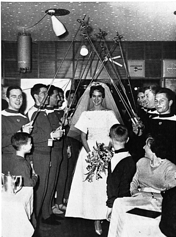
MISS AMERICA 1960: LINDA LEE MEAD