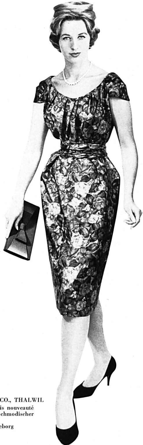
ROBT. SCHWARZENBACH & CO., THALWIL Pure soie, imprimée main, coloris nouveauté Handbedruckte reine Seide in hochmodischer Colorierung Modèle A/B Lena-Modeller, Göteborg