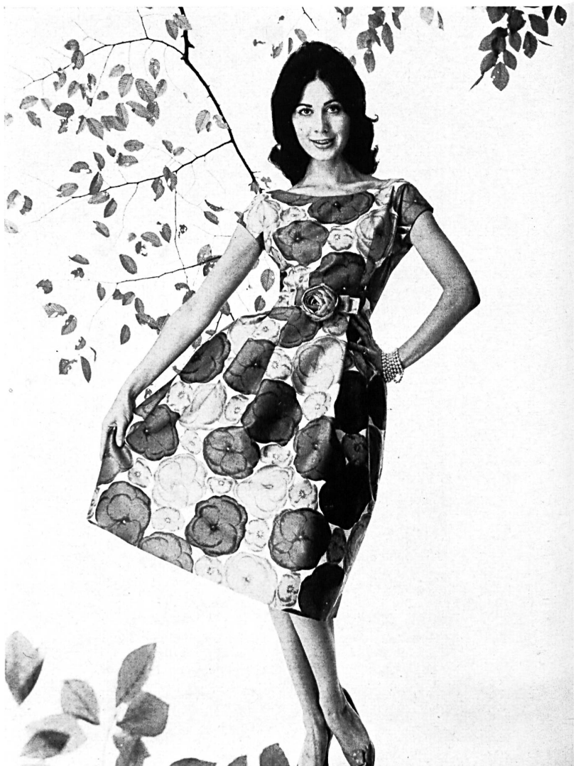
HEER & CIE S. A., THALWIL «Satin Sauvage», coton imprimé Grossiste à Paris: Robert Burg & Cie Modèle Géo Boutet, Paris