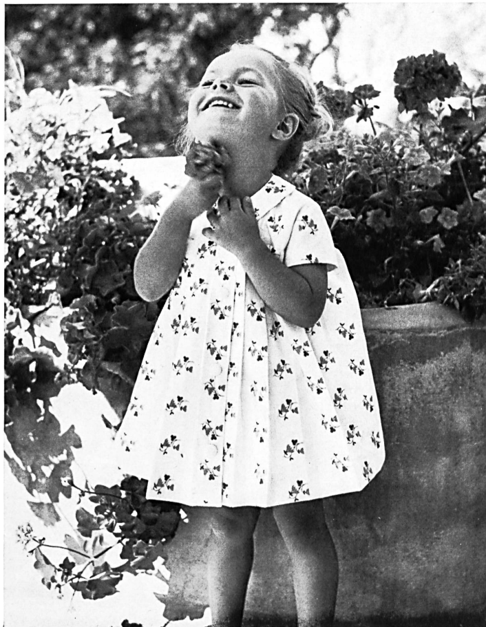
JACOB ROHNER S. A., REBSTEIN