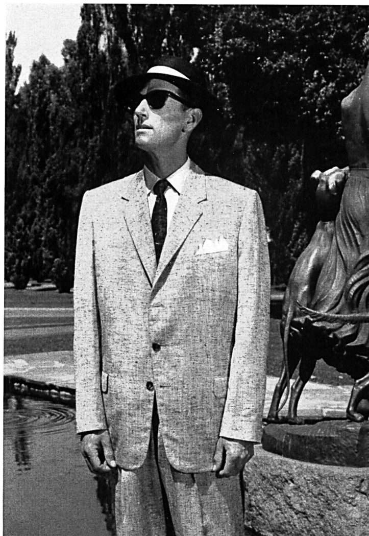
« ZURRER » WEISBROD-ZURRER SÖHNE, HAUSEN a.A. Shantung pure soie / pure silk shantung Modèle Ernest Hiller Pty. Ltd., Sydney