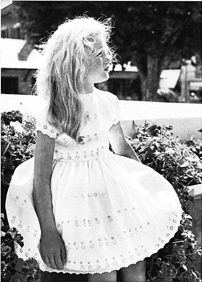
JACOB ROHNER S. A., REBSTEIN

Batiste Minicare blanche, brodée en blanc avec applications d'impression au pistolet. Modèle Michèle Roger