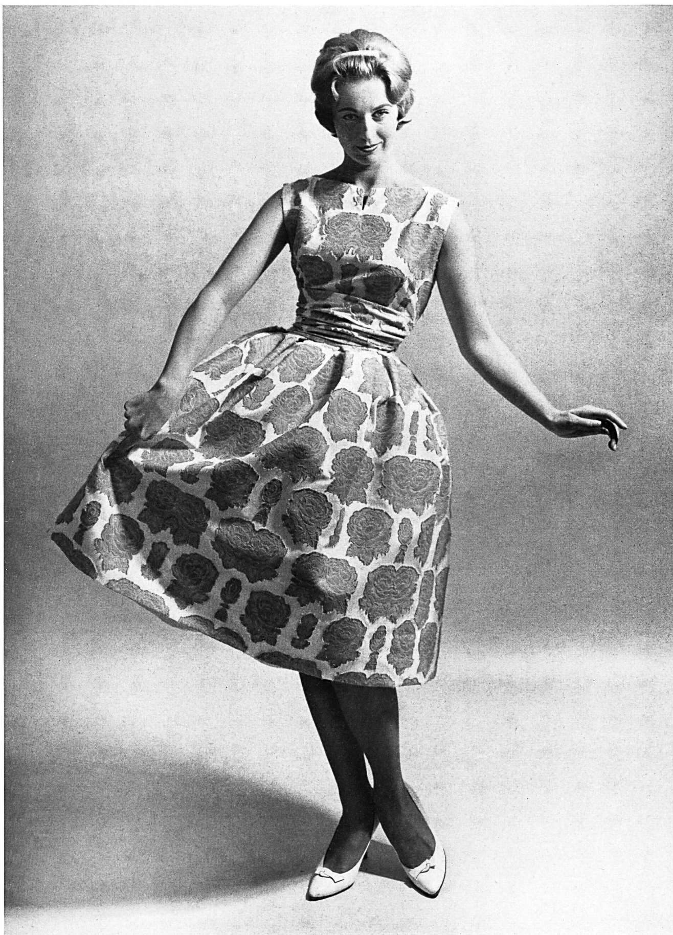
ROBT. SCHWARZENBACH & CO., THALWIL « Gavotte », tissu jacquard pur coton, infroissable Reinbaumwollenes Jacquard-Gewebe, knitterfrei Modèle A/B Lena-Modeller, Göteborg