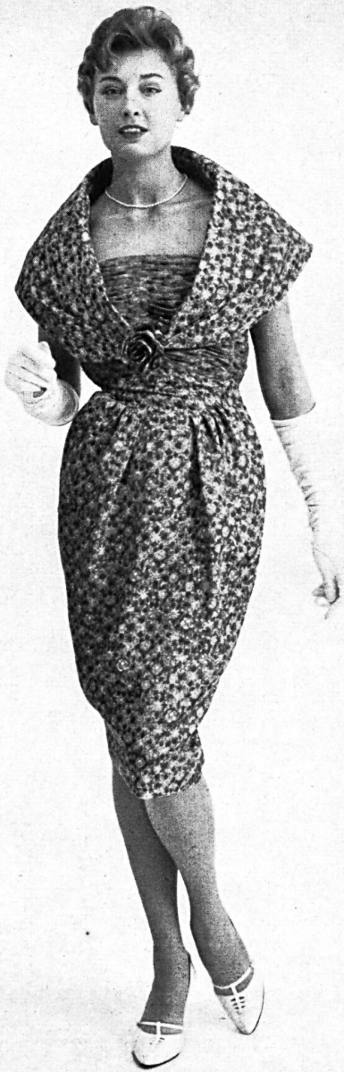
ROBT. SCHWARZENBACH & CO., THALWIL Imprimé pure soie / pure silk printed fabric Modèle Continental Modes, Sydney