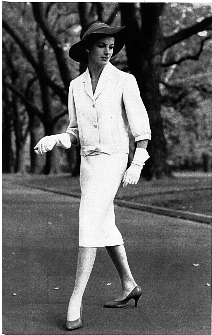
« ZURRER » WEISBROD-ZURRER SÖHNE, HAUSEN a.A. « Nanking » pure fibranne / pure spun rayon Modèle Raymon Manufacturing Co., Melbourne