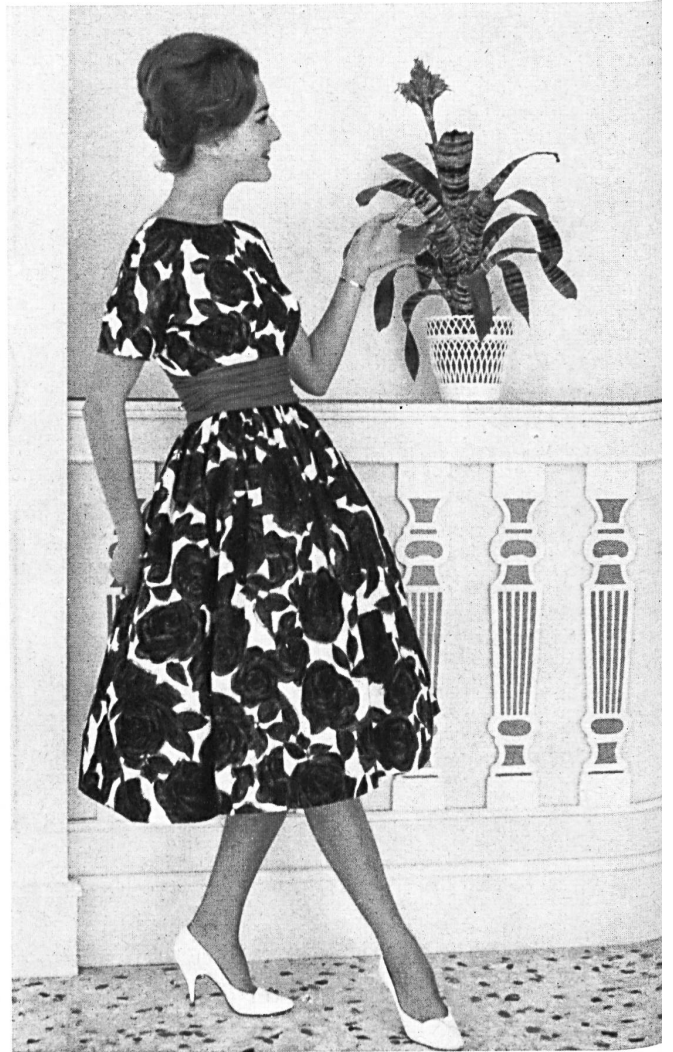
HEER & CIE S. A., THALWIL « Sarabande », coton imprimé Grossiste à Paris: Robert Burg & Cie Modèle Y. Dubois, Nice