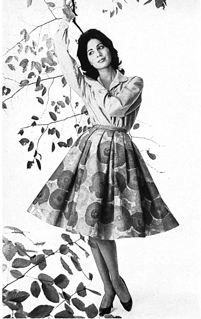
HEER & CIE S. A., THALWIL «Satin Flirt», coton imprimé Grossiste à Paris: Robert Burg & Cie Modèle Péroche, Paris