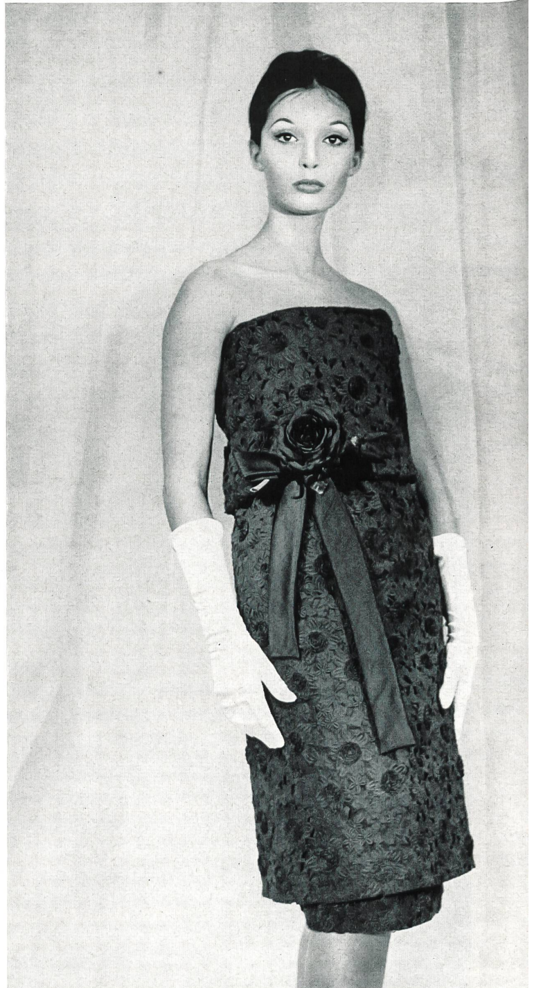
PIERRE CARDIN Organdi brodé nouveauté avec applications de Union S. A., Saint-Gall Grossiste à Paris : Robert Burg & Cie