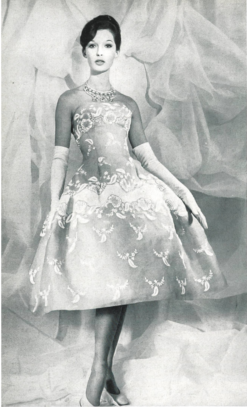
CARVEN Bordure d'organdi brodé de Forster Willi & Co., Saint-Gall Grossiste à Paris : Robert Burg & Cie