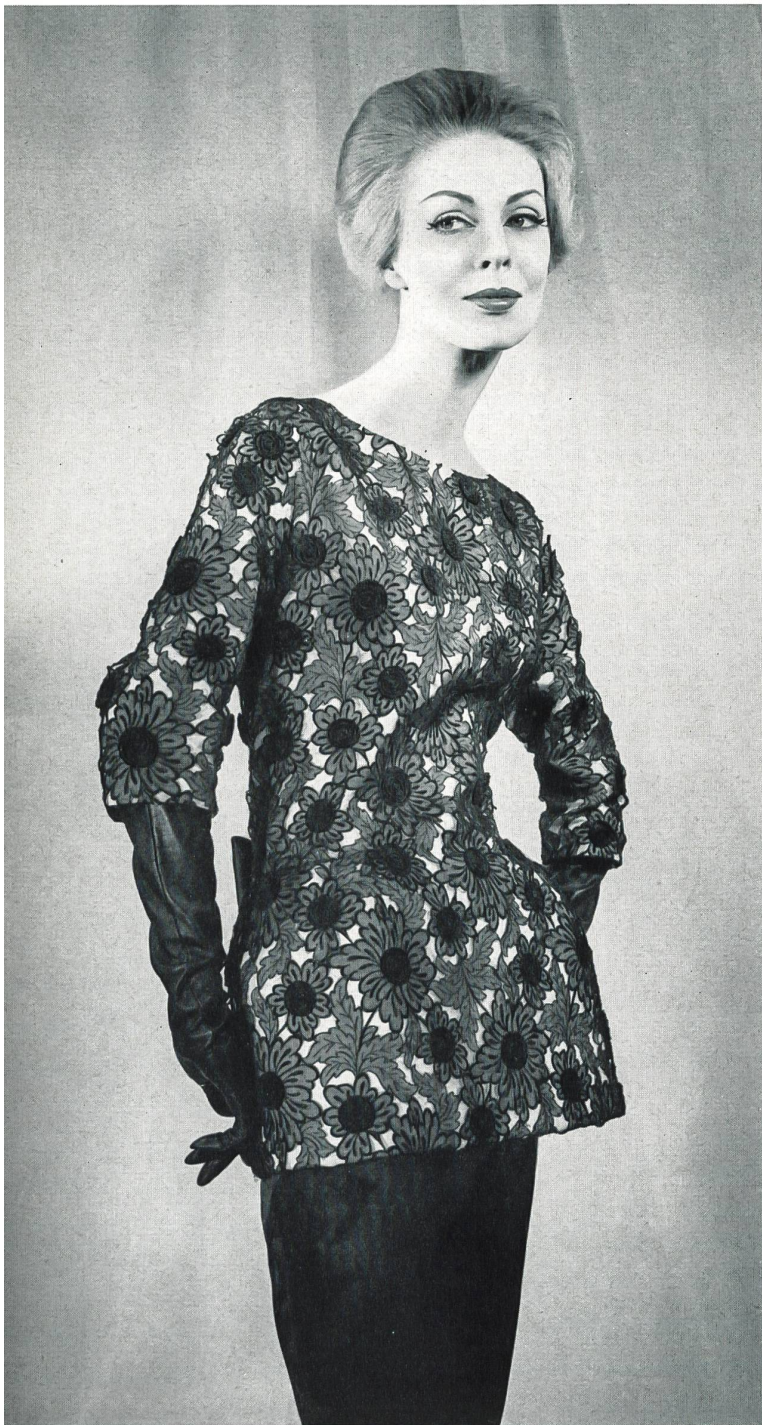
PIERRE CARDIN Organdi brodé nouveauté avec applications de Union S. A., Saint-Gall Grossiste à Paris : Robert Burg & Cie