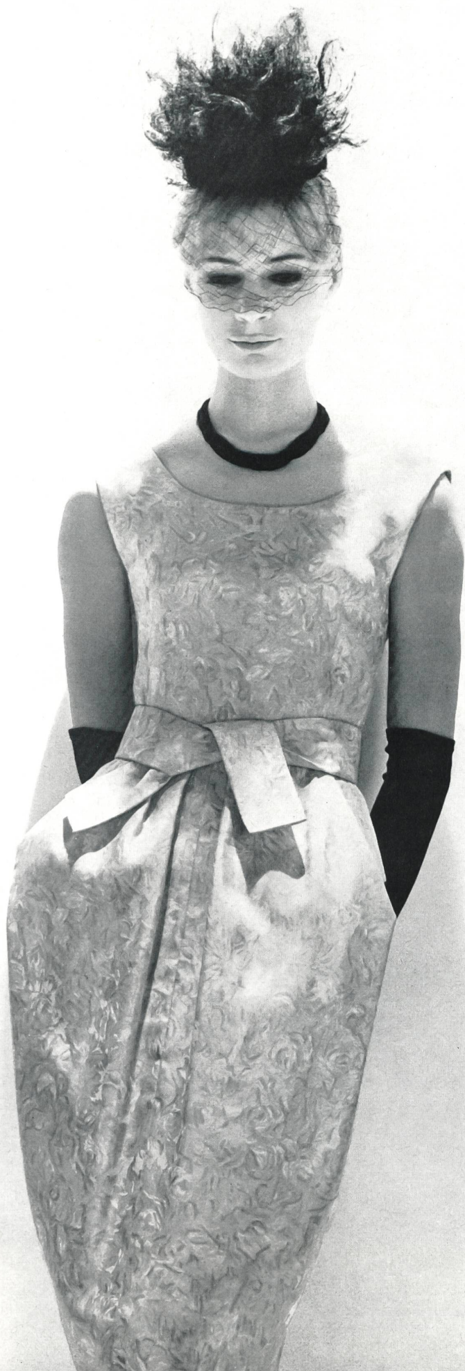
JACQUES HEIM Tissu « bégé » Twill Aquarelle pure soie Fabricant : Berthold Guggenheim Fils & Cie, Zurich Paris : J. Léonard & Cie