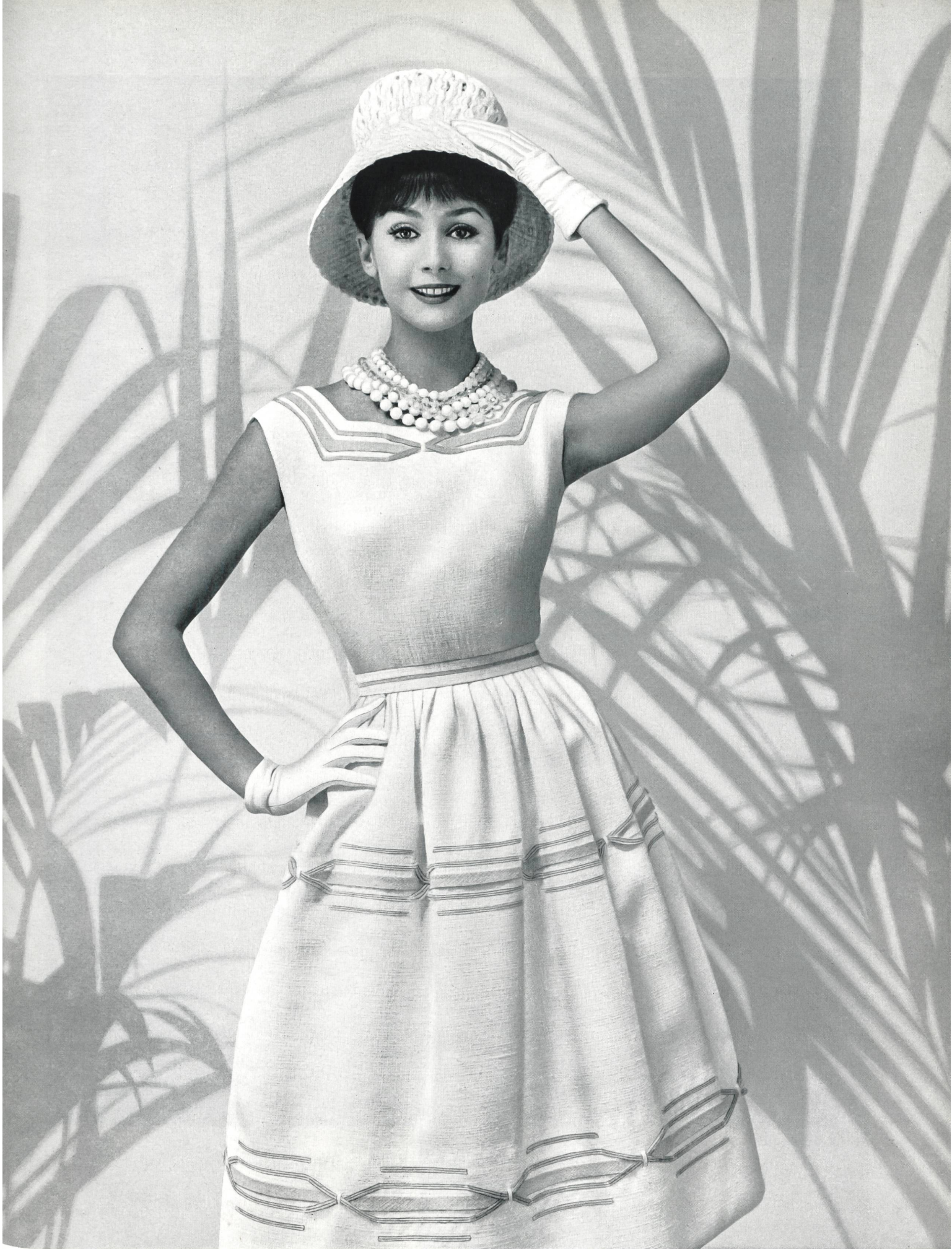
CARVEN (Boutique) « Oki-Ama », imitation lin, de Heer & Cie S.A., Thalwil