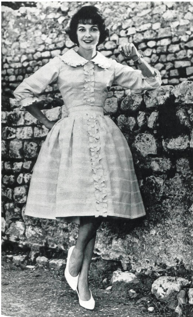
« RECO », REICHENBACH & CO., SAINT-GALL

« Recosablé » Minicare Modèle Brigitte, Cannes