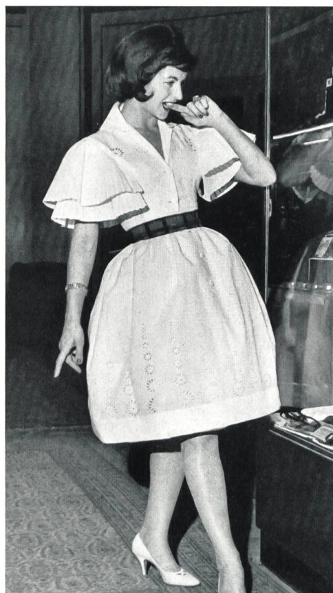
« RECO », REICHENBACH & CO., SAINT-GALL

Batiste brodée Minicare Minicare embroidered batist Modèle Marinelli, Nice