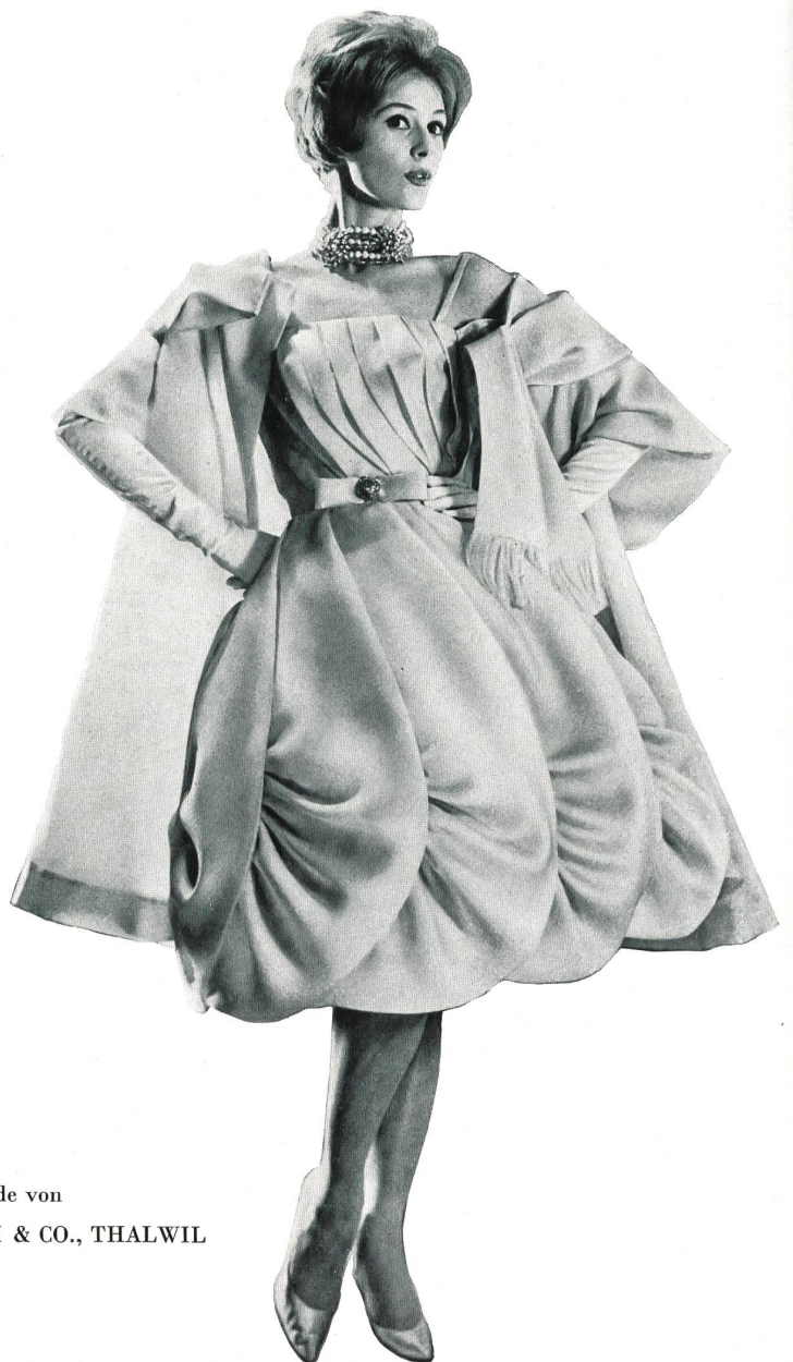
Modèle GACK, ZURICH

Satin organdi pure soie de Pure silk organdy satin by Raso organdí pura seda de Organdy Satin aus reiner Seide von