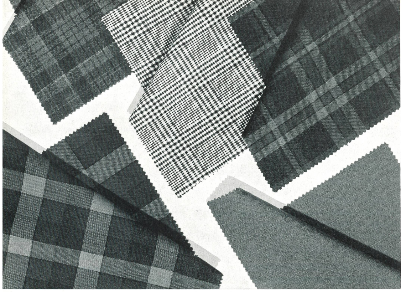
« KWB », TISSAGE BLEICHE S. A., ZOFINGUE

Tissus laine peignée et Trévira, légers, élastiques et infroissables, en divers dessins et structures pour complets de messieurs, costumes de dames, robes, jupes à plissage permanent, etc. en couleurs mode Light, elastic and crease-resistant worsted and Trevira fabrics in various designs and structures for men's and women's suits, dresses, permanently pleated skirts, etc., in fashionable colours Tejidos de lana peinada y Trévira, ligeros, elásticos e inarrugables, de varios colores y estructuras, para ternos de caballero, trajes de señora, faldas con plisado permanente, etc., en los colores a la moda Mischgewebe aus Kammgarn und Trevira, leicht, elastisch, knitterfrei, in verschiedenen Mustern und Bindungen für Herrenanzüge, Damen-Kleider, Damen-Kostüme, permanent plissierte Jupes usw. in modischen Farbtönen