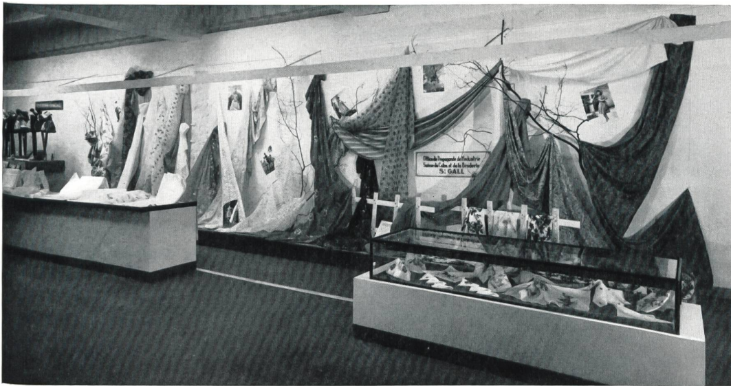
Industrie suisse du coton et de la broderie, Saint-Gall