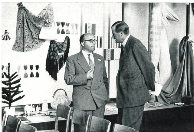
Vues prises au cours de la réception des journalistes à Emmenbrücke par la Société de la Viscose suisse.