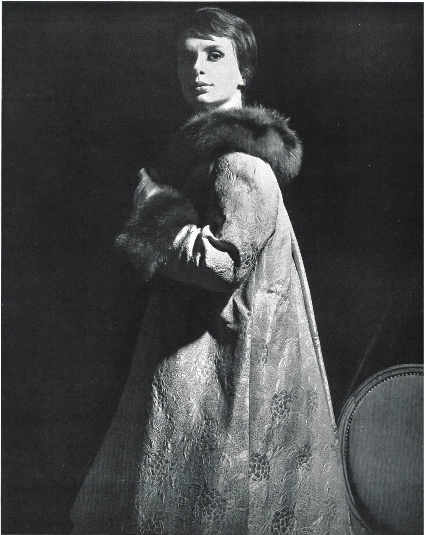
CARVEN Façonné tout soie des Soieries Stehli S. A., Zurich