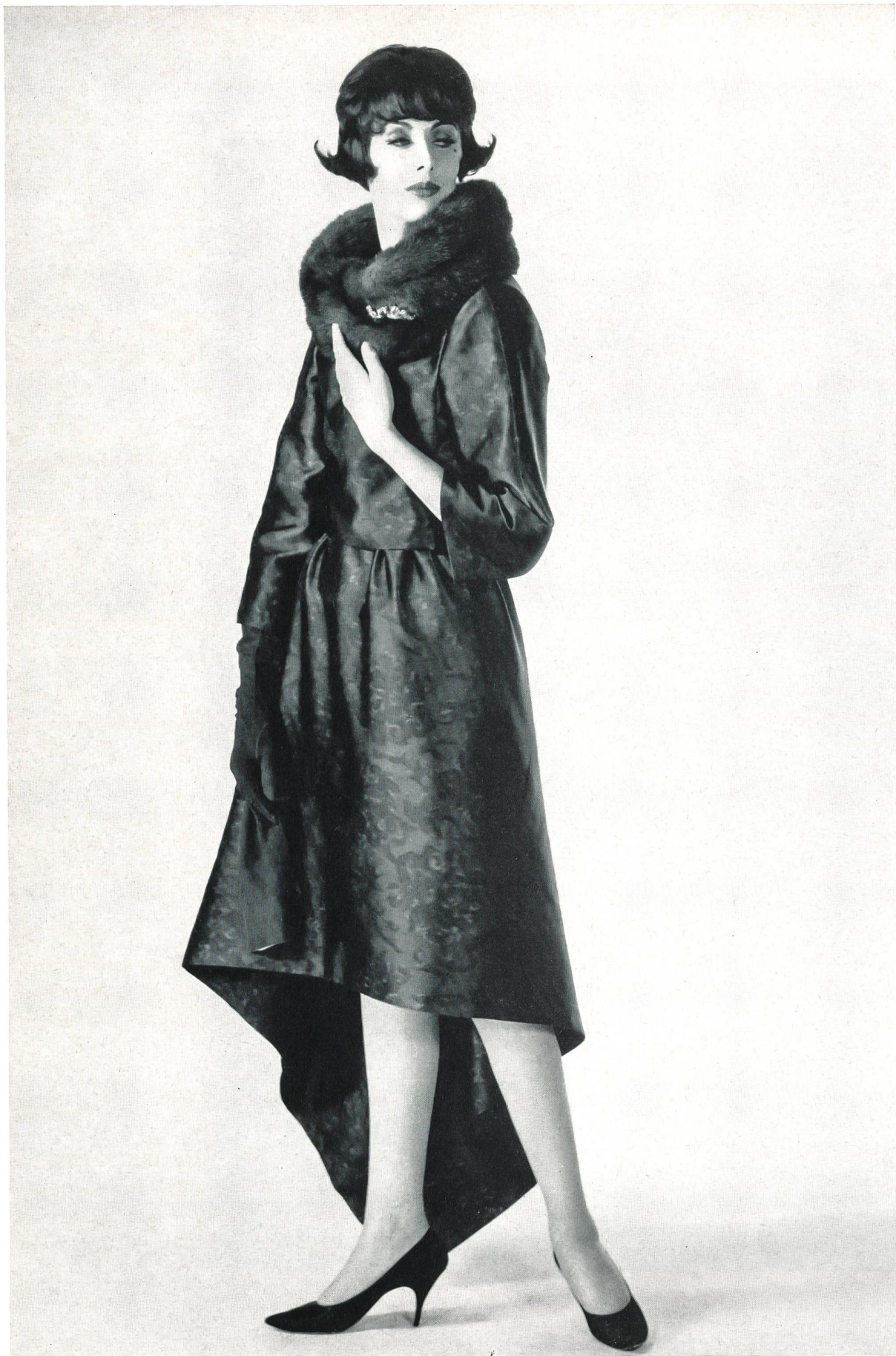
NINA RICCI Satin réversible imprimé sur chaîne de L. Abraham & Cie, Soieries S. A., Zurich