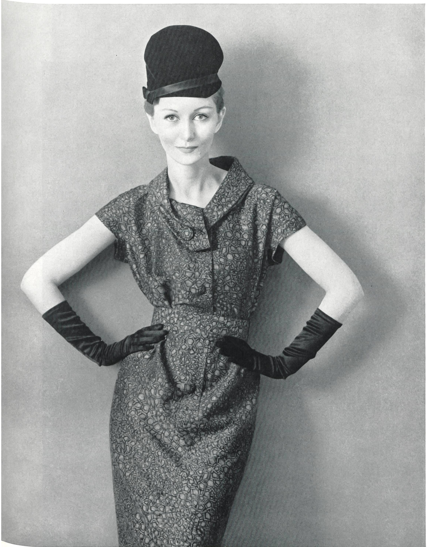
PIERRE CARDIN Soielaine « Miranda » de Reichenbach & Co., Saint-Gall Distribué par Montex, Paris