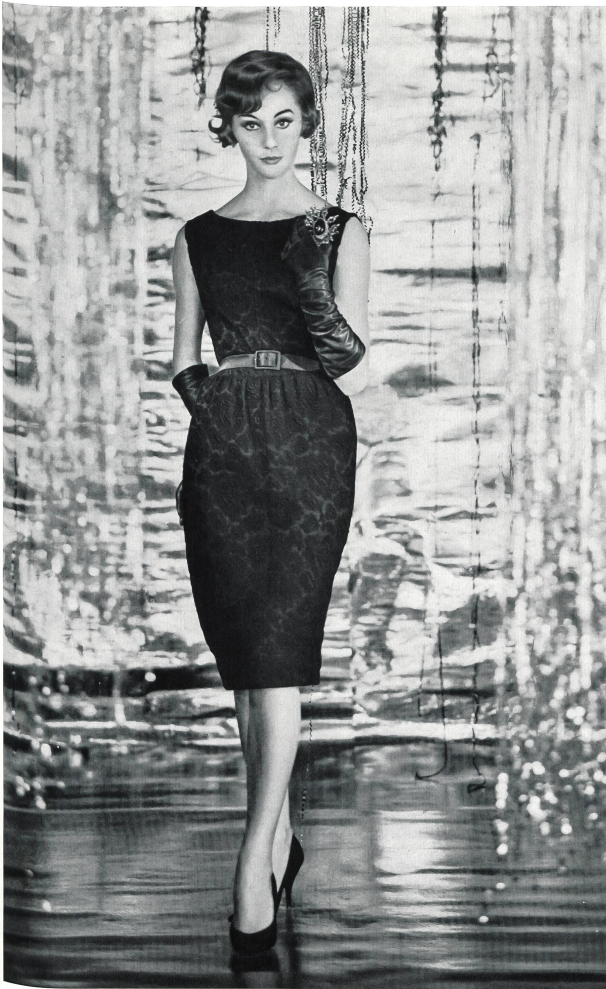
CHRISTIAN DIOR (Boutique) Organdi de soie brodé, genre Gobelins, de Forster Willi & Co., Saint-Gall