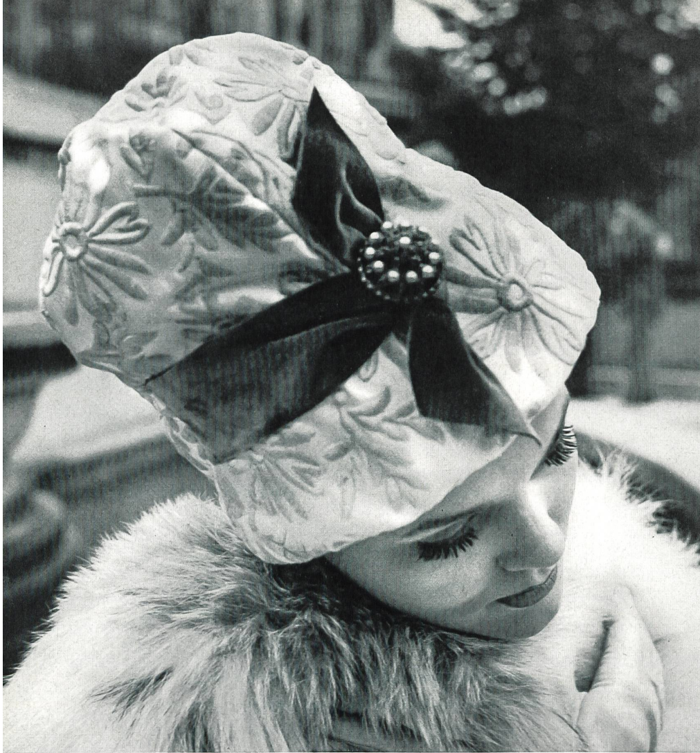
LANVIN CASTILLO Satin Duchesse brodé de Forster Willi & Co., Saint-Gall Grossiste à Paris : Robert Burg & Cie