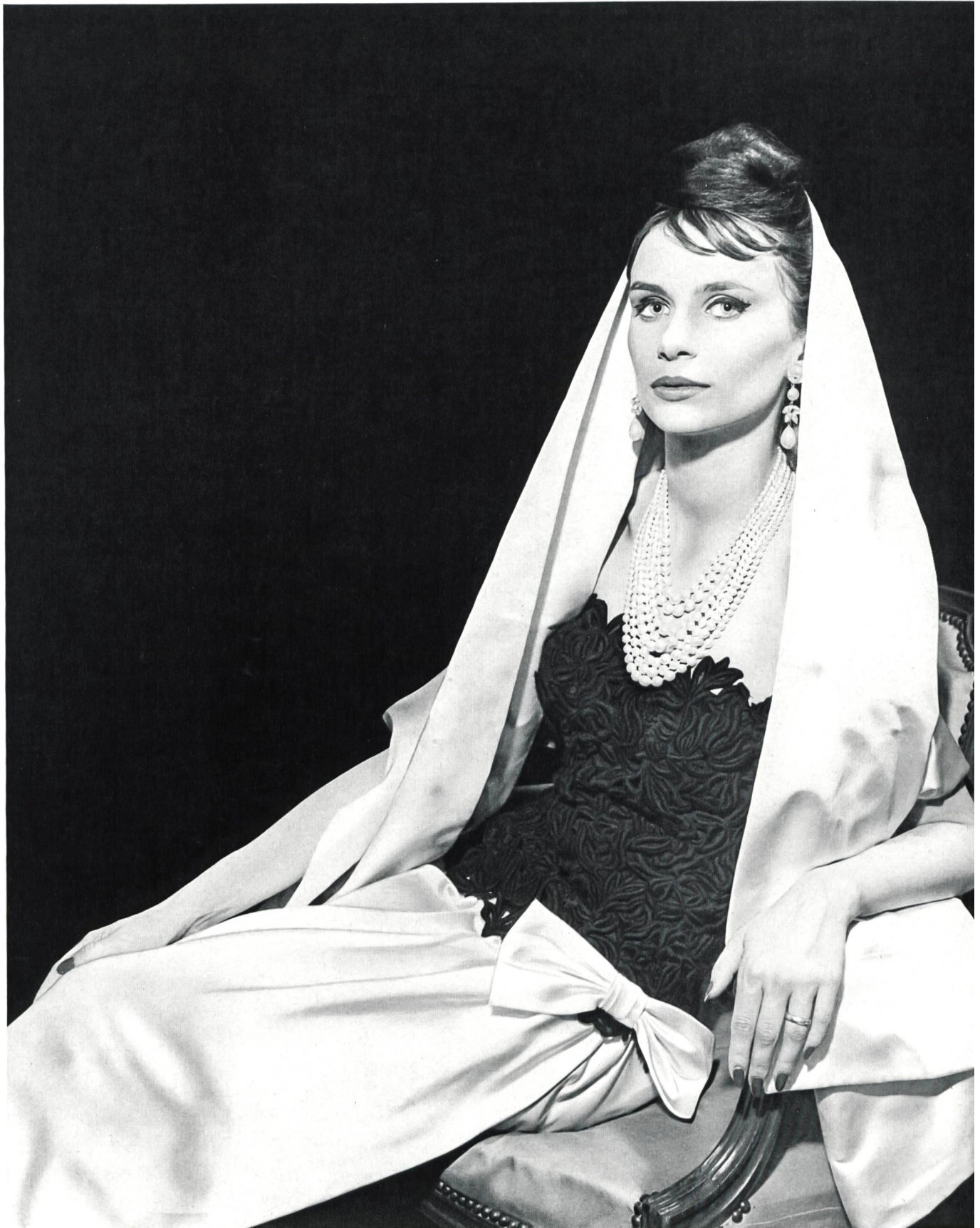
MAGGY ROUFF Broderie de laine sur organdi, genre guipure, de Forster Willi & Co., Saint-Gall Grossiste à Paris : Robert Burg & Cie