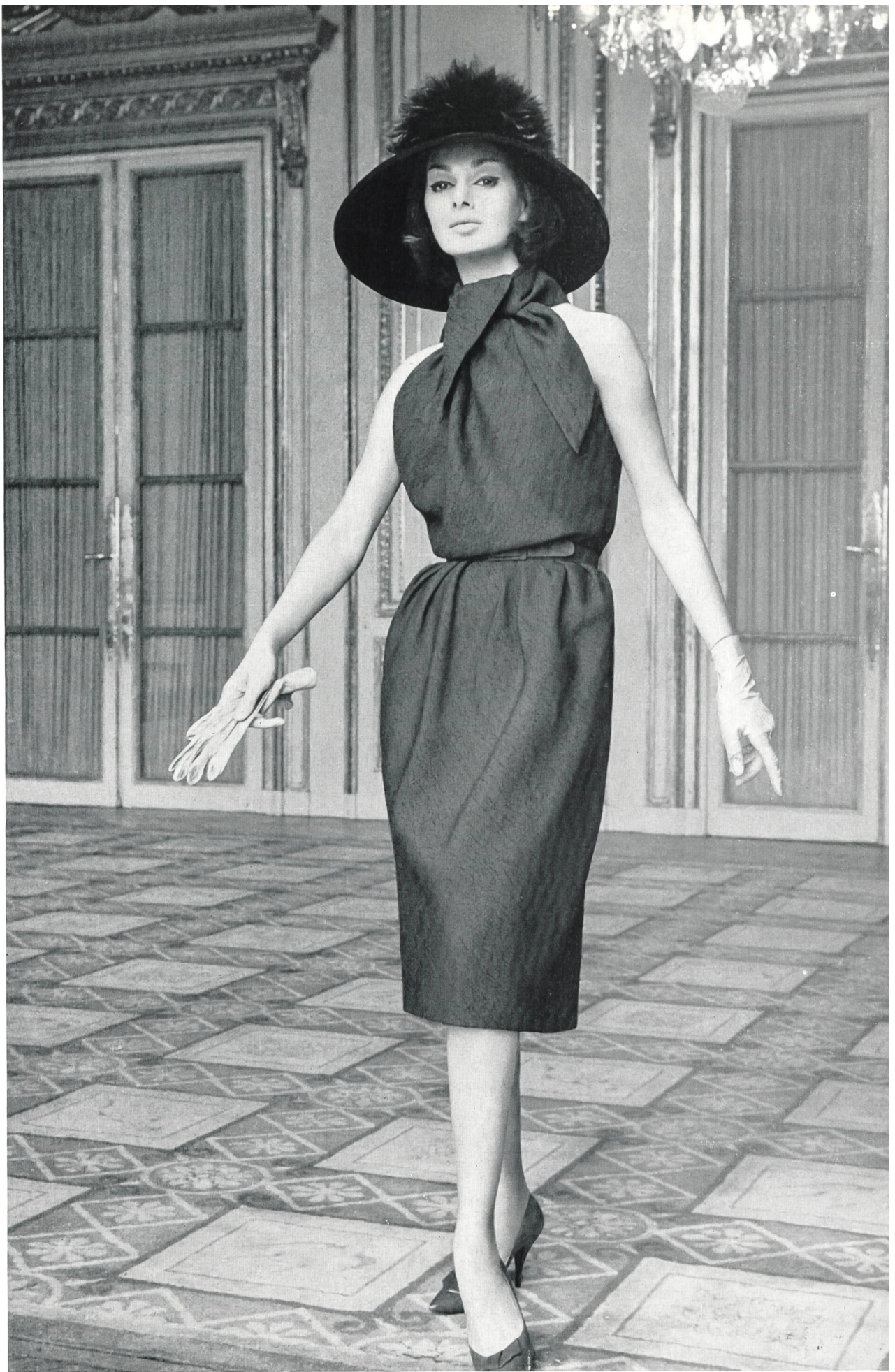
NINA RICCI Tissu « Kolibri », soie naturelle, de Heer & Cie S. A., Thalwil Grossiste à Paris : Robert Burg & Cie