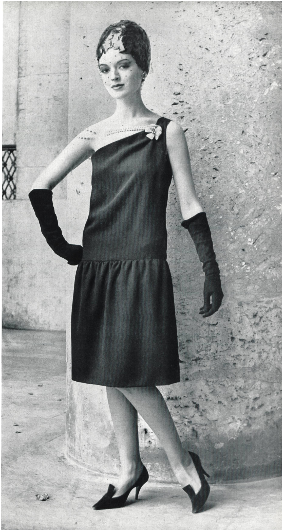
CHRISTIAN DIOR Crêpe noir de la S. A. Stünzi Fils, Horgen