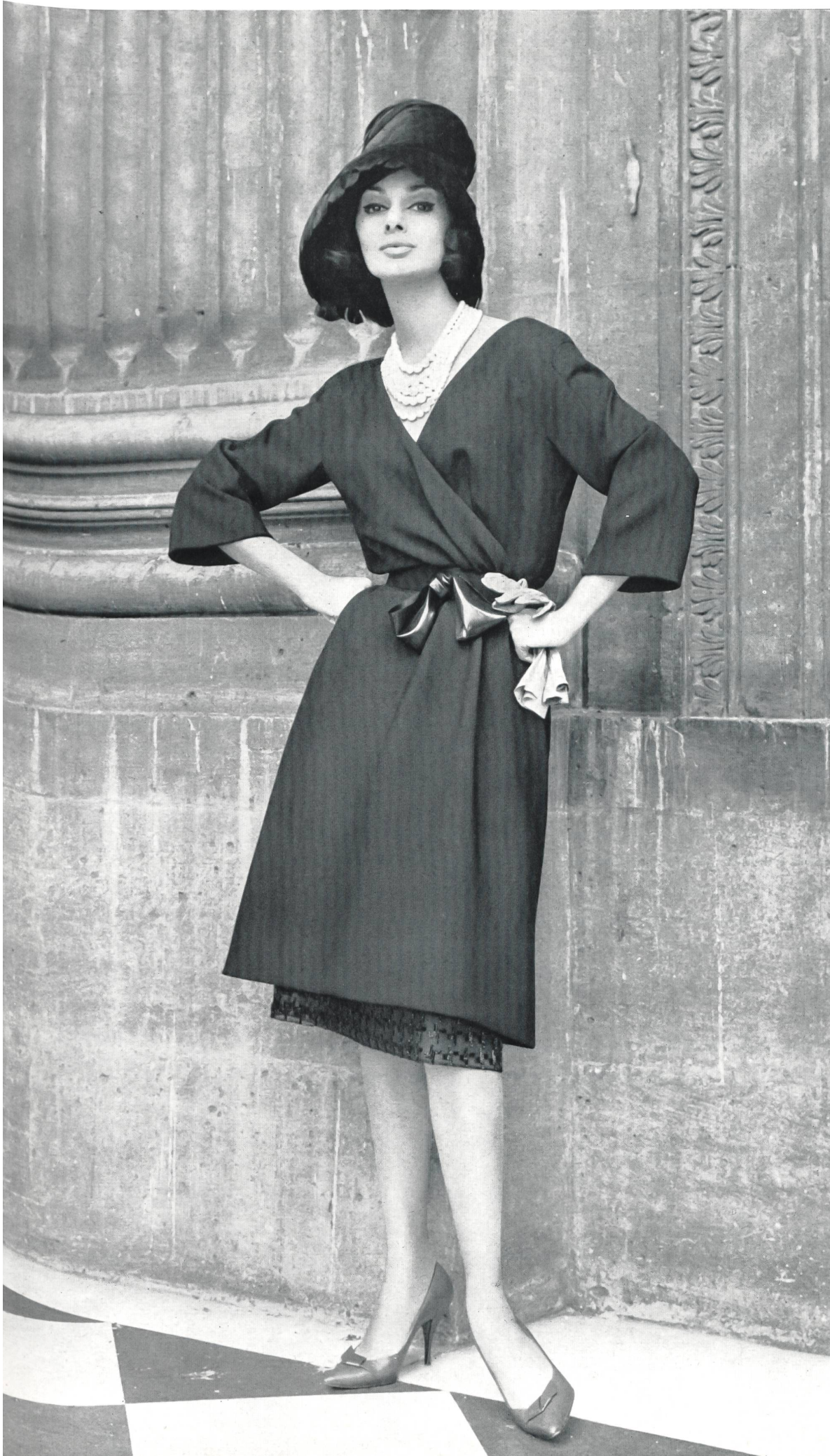
MADELEINE DE RAUCH Tissu « Stella Polaris », rayonne/laine, de Heer & Cie S.A., Thalwil Grossiste à Paris : Robert Burg & Cie