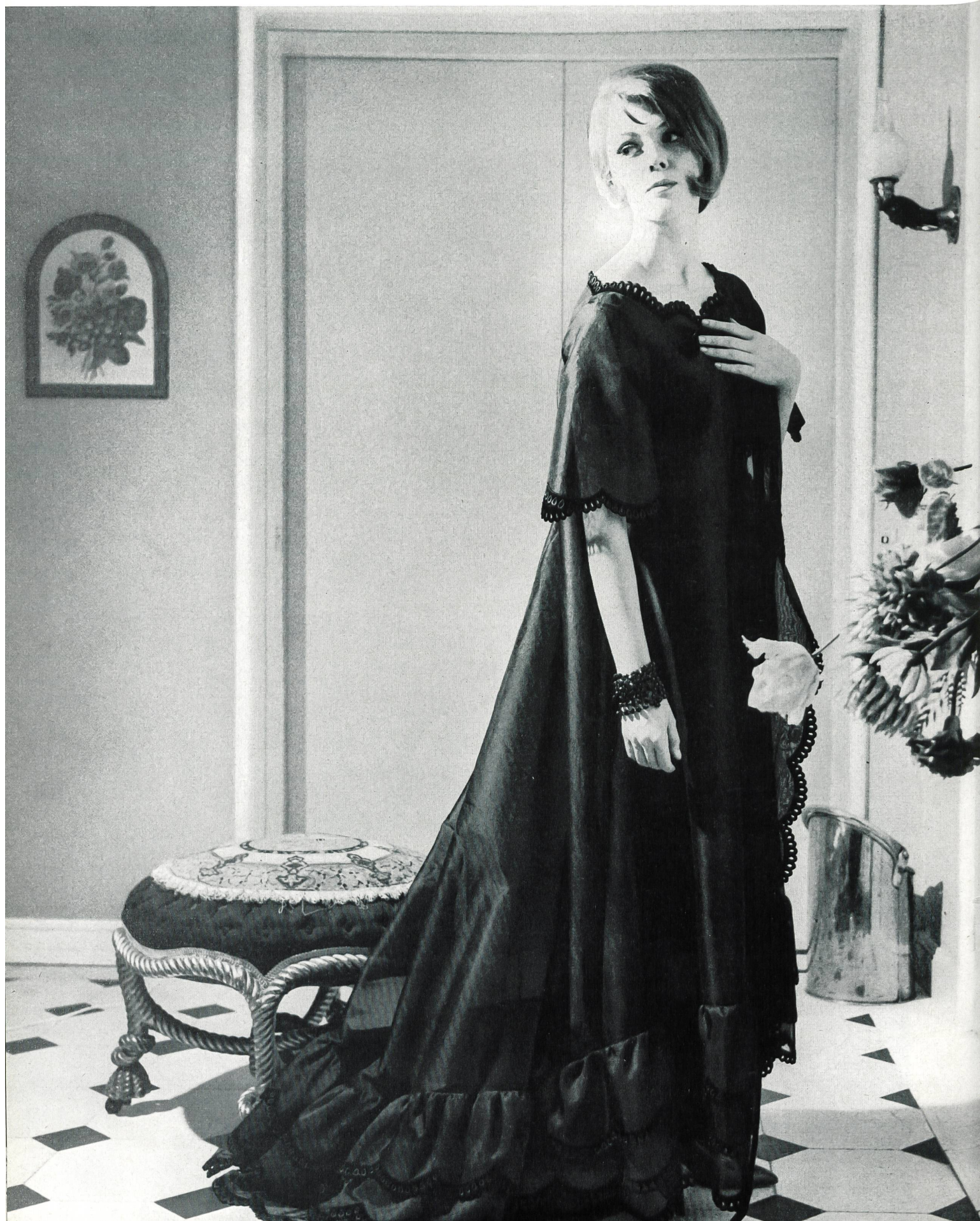
CHRISTIAN DIOR (Boutique) Bandes et galons de velours brodé de Forster Willi & Co., Saint-Gall