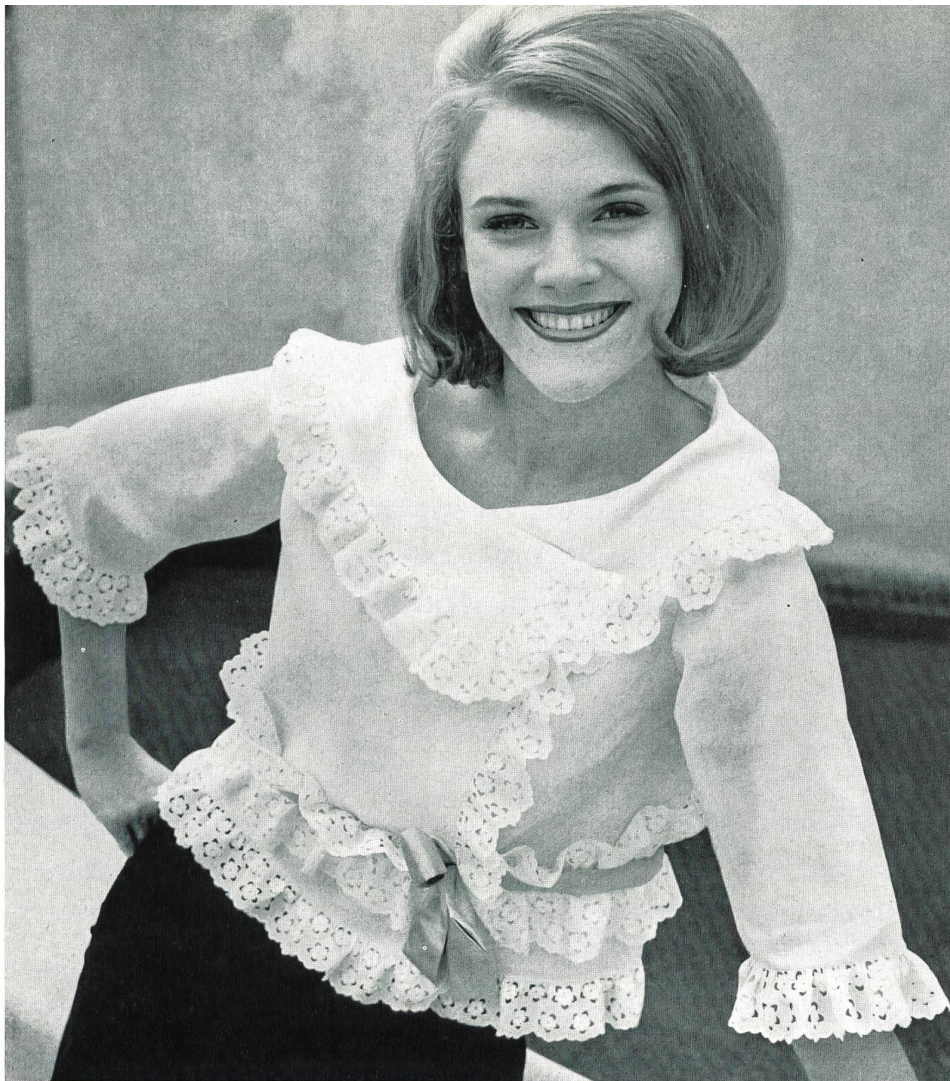
CHRISTIAN DIOR (Boutique) Bande brodée de coton de A. Naef & Cie S.A., Flawil