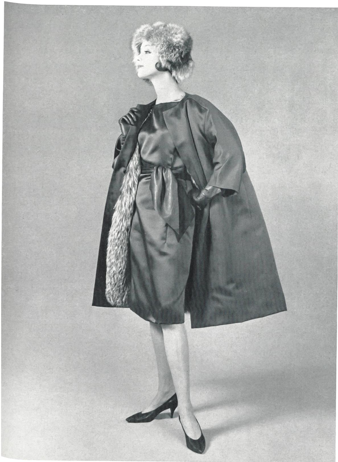
JACQUES HEIM Satin Duchesse de L. Abraham & Cie, Soieries S. A., Zurich