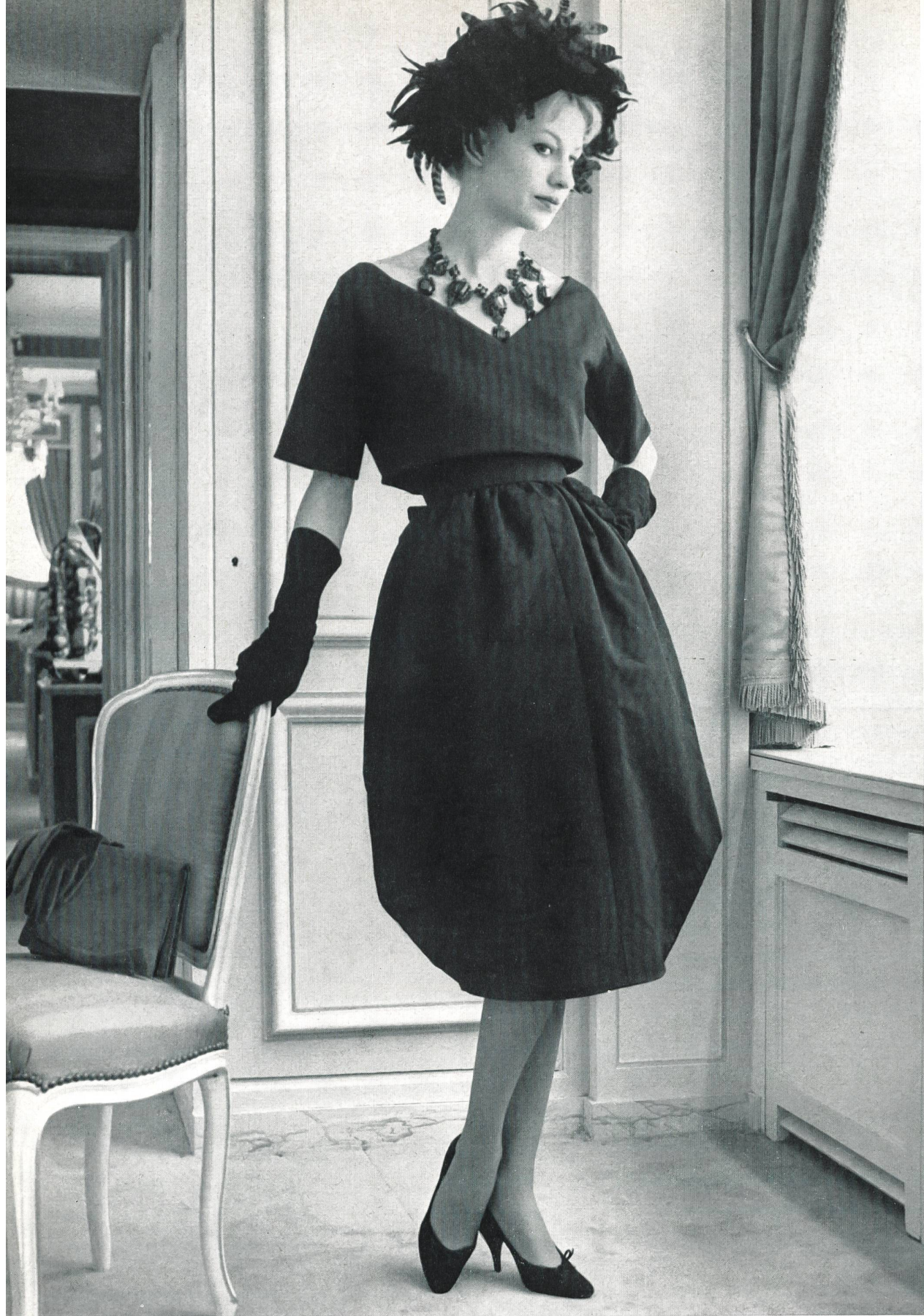
LANVIN CASTILLO Poult de soie noir de la S. A. Stünzi Fils, Horgen