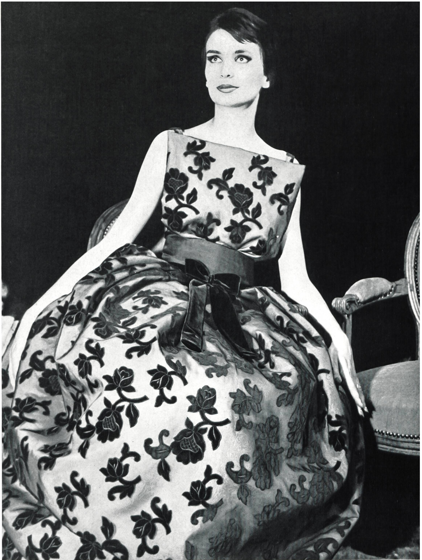
PIERRE CARDIN Broderie de velours découpée sur organdi de soie « Mimosa » de « NELO » J. G. Nef & Co. S. A., Hérisau