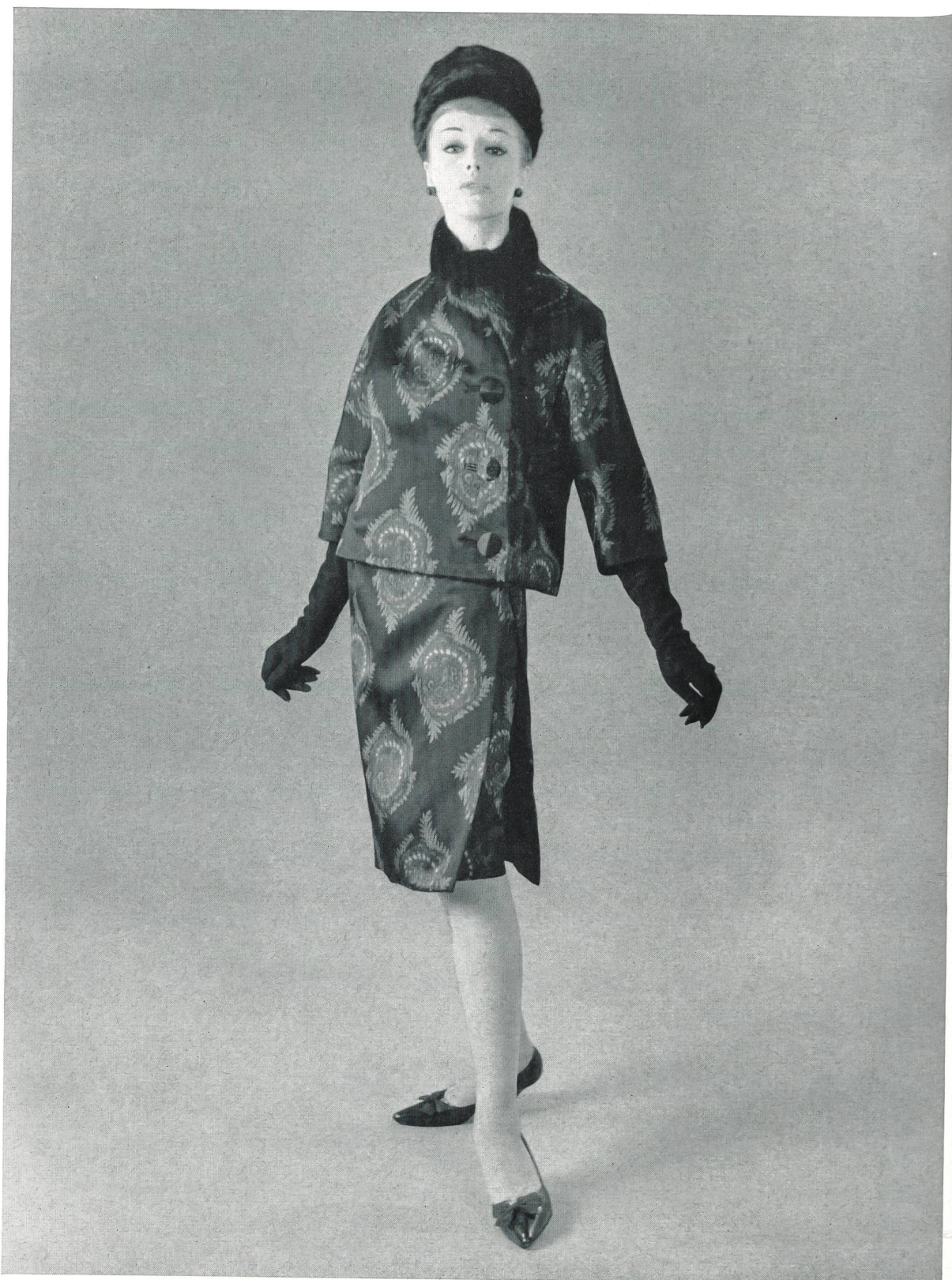
GUY LAROCHE Satin double-face imprimé sur chaîne de L. Abraham & Cie, Soeries S. A., Zurich