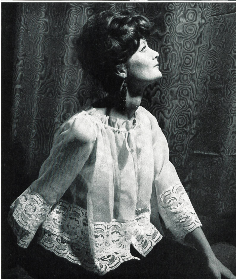
CHRISTIAN DIOR (Boutique) Fine dentelle brodée de Walter Stark, Saint-Gall