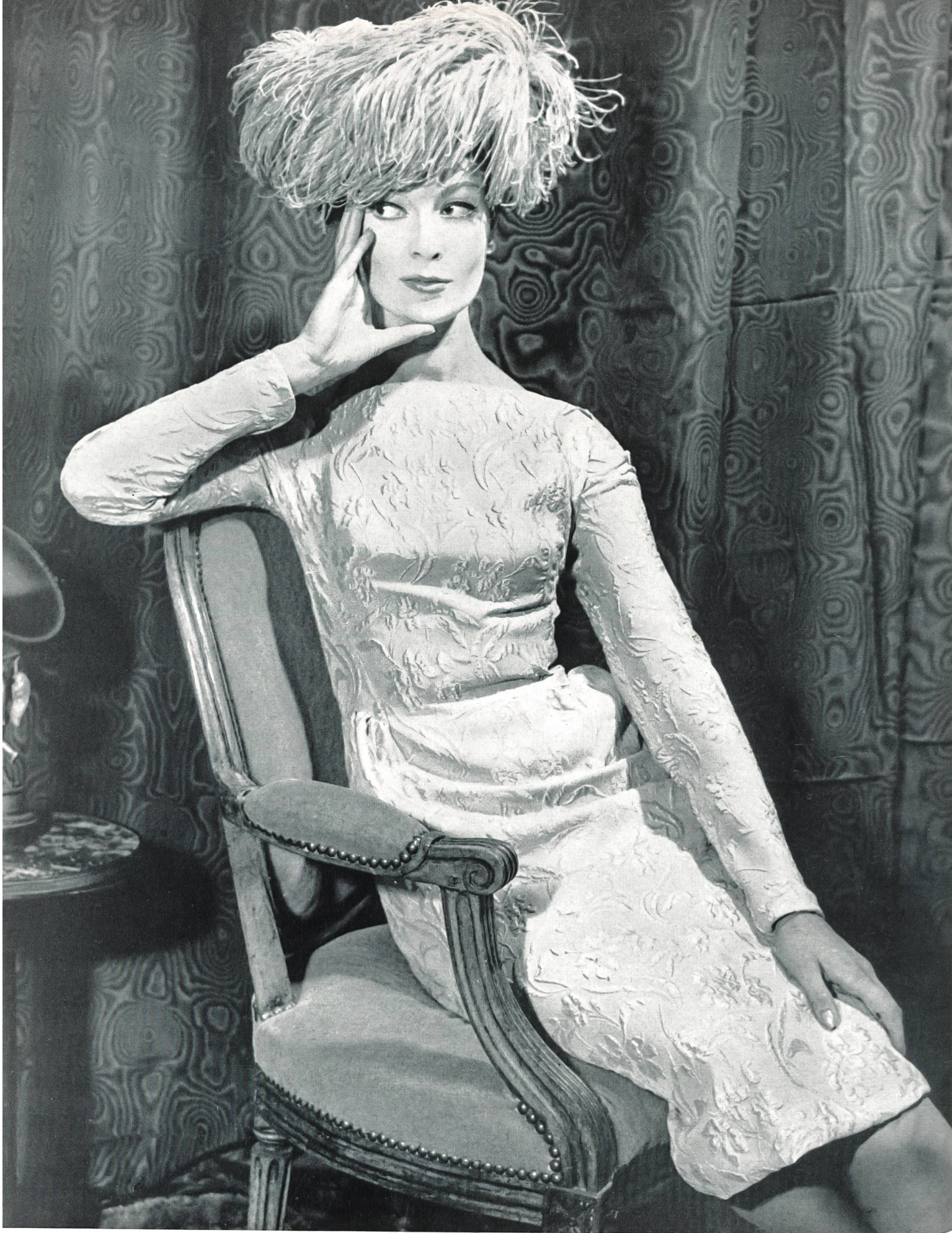
BERNARD SAGARDOY Façonné tout soie des Soieries Stehli S. A., Zurich