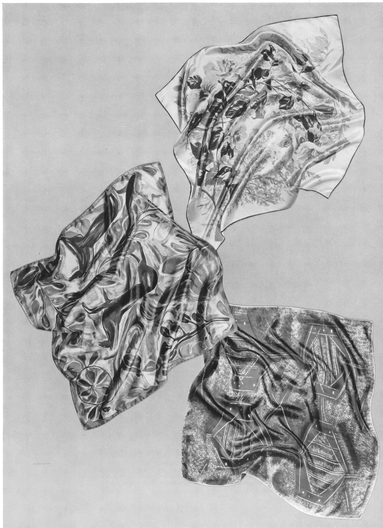
MAVIR, ZURICH Foulards imprimés sur pure soie et rayonne. Pure silk and rayon printed squares. Cuadrados estampa- dos sobre seda pura y rayón. Bedruckte Kopf- tücher in reiner Seide und Rayonne.