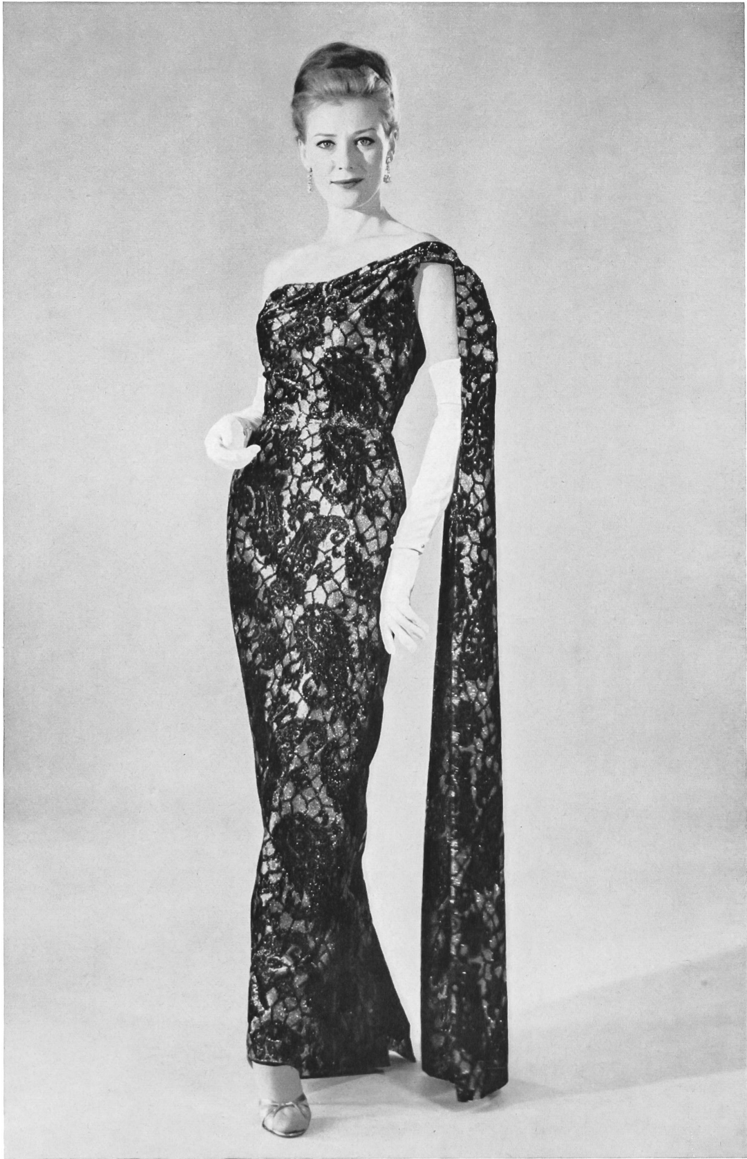
« MIRA », H. GROSSENBACHER S.A., ZURICH Robe du soir en velours lamé, noir et or. Evening gown in black and gold lamé velvet. Vestido de soaré de terciopelo escarchado negro y oro. Abendkleid aus schwarz/goldenem Lamé-Samt.