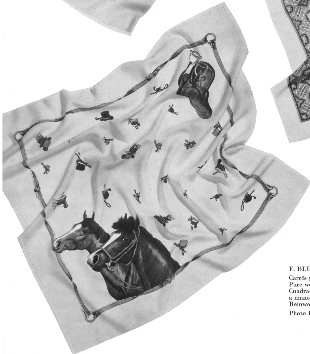
F. BLUMER & CIE, SCHWANDEN Carrés pure laine, imprimés à la main. Pure wool hand printed squares. Cuadrados de lana pura estampados a mano. Reinwollene, handbedruckte Kopftücher.