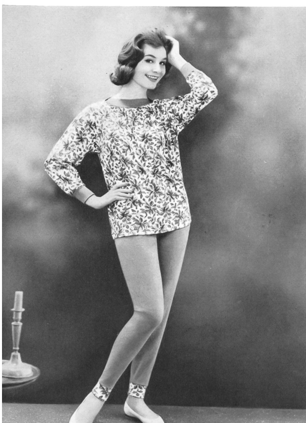
« SAWACO », S.A. W. ACHTNICH & CO., WINTERTHOUR

Les commerçants achetèrent surtout des produits mode et de haute qualité de l'industrie de la lingerie et du corset. Il y eut une forte demande pour les sous-vêtements mode, les « combi-slips », les vêtements de nuit, la lingerie en matières nouvelles et en coloris inédits. En corsets, les commandes allèrent principalement aux articles qui présentaient des caractéristiques nouvelles et dans la ligne de la mode en matière de coloris, de coupe et d'exécution. A part le blanc, couleur dominante, beaucoup de commandes vont aux corsets noirs ainsi qu'aux écossais peu appuyés. Au cours du défilé international de mode, qui eut lieu dix fois en tout au cours des trois jours que dura la foire, ce furent environ quatre-vingts modèles de lingerie et de corsets qui furent présentés.