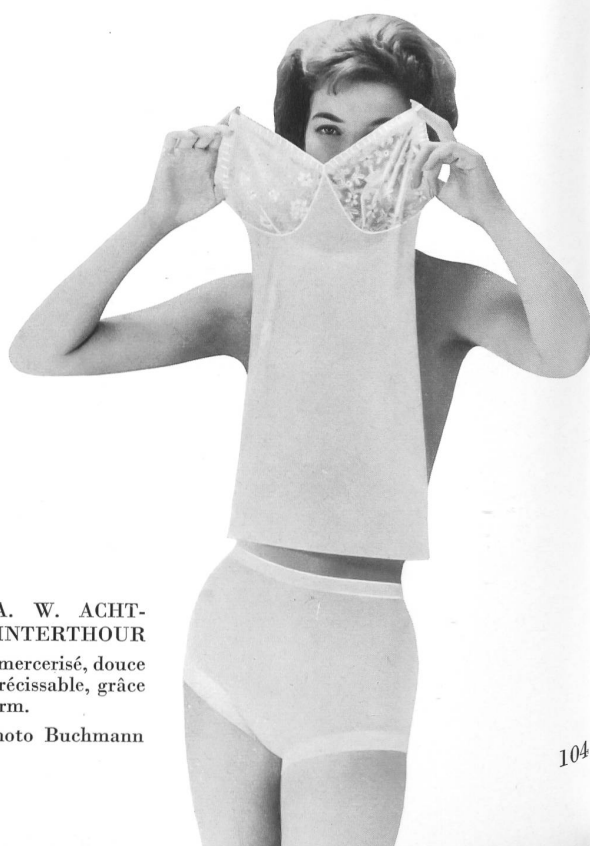
« SAWACO », S.A. W. ACHTNICH & CO., WINTERTHOUR Parure en fil retors mercerisé, douce au toucher et irrétrécissable, grâce au finissage Fixform.