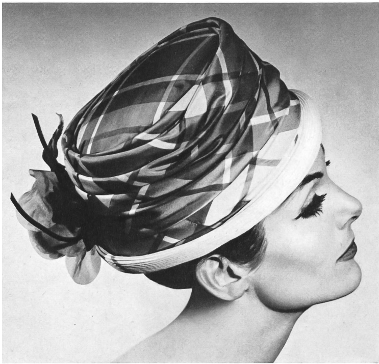
Soie imprimée suisse Printed Swiss silk Modèle Baroness Radvanszky, New York

se sont laissé inspirer par les tissus. De tous côtés, on entend le mot « simplicité » ; cela est bien naturel, car les imprimés abstraits très « sophistiqués » et les structures originales exigent des lignes simples.