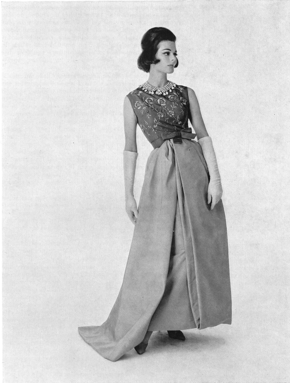
Faille pure soie suisse Pure silk Swiss faille Modèle Elizabeth Arden, New York

Pour les Américaines, ce sont de plus en plus les tissus qui comptent dans la mode, l'examen de la coupe n'intervenant qu'en second lieu. A toutes les réunions de société, après cinq heures de l'après-midi, les regards sont éblouis par la variété des textures, des brocarts à trois dimensions, des broderies et des ornements de perles, des beaux