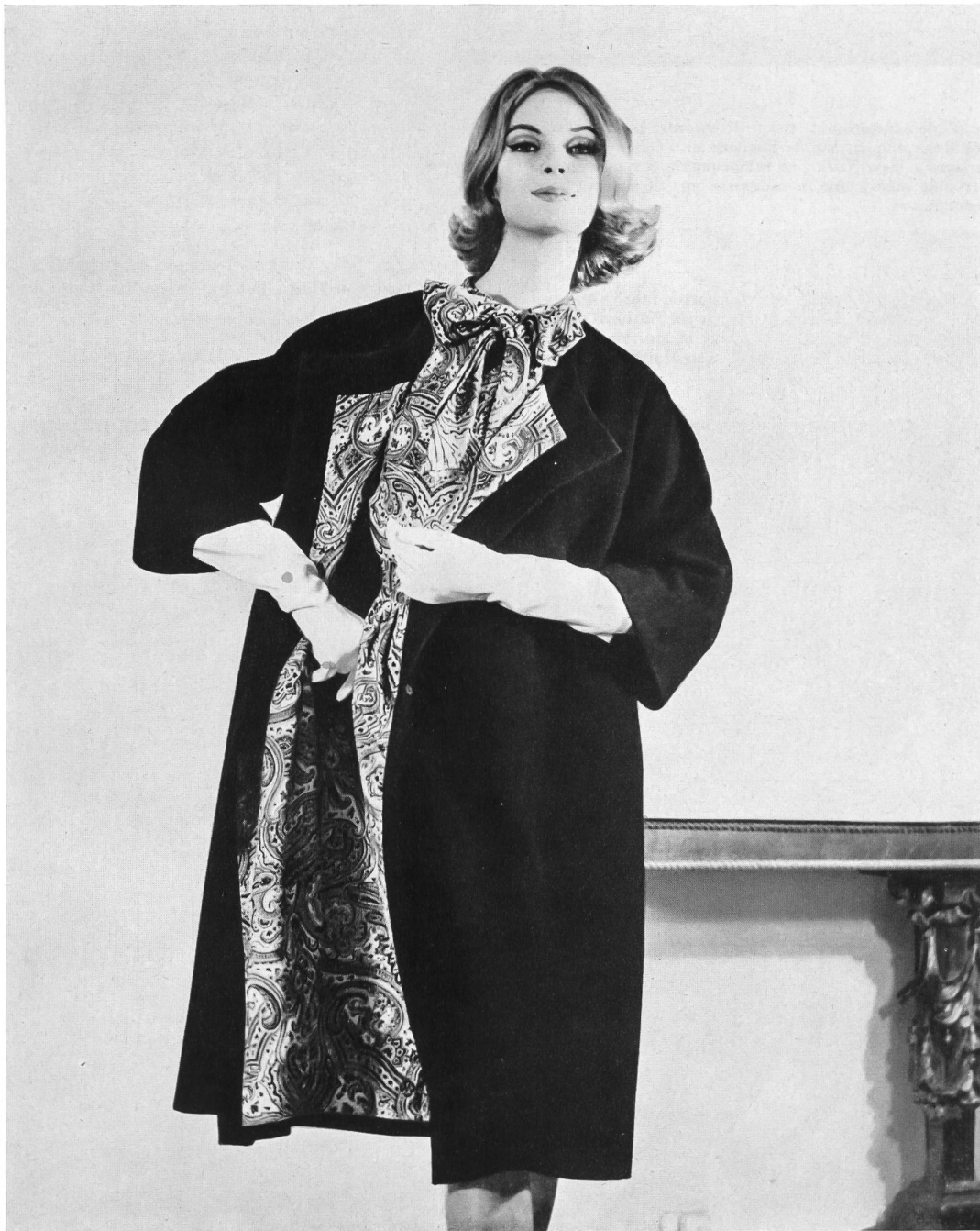
Mousseline de laine suisse avec impression cachemire Swiss paisley printed wool challis Modèle Vera Maxwell, New York