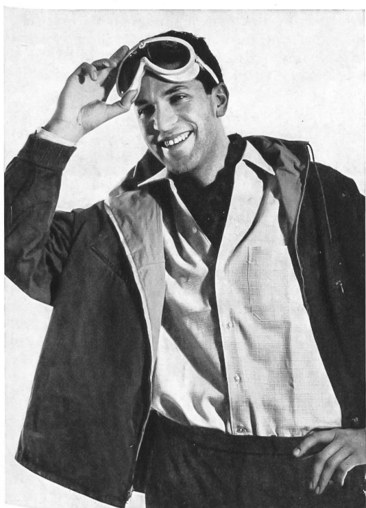
GUGELMANN & CIE S. A., LANGENTHAL Chemise sportive jeune, de coupe classique, en coloris nouveaux. Modèle Elmira, Suisse