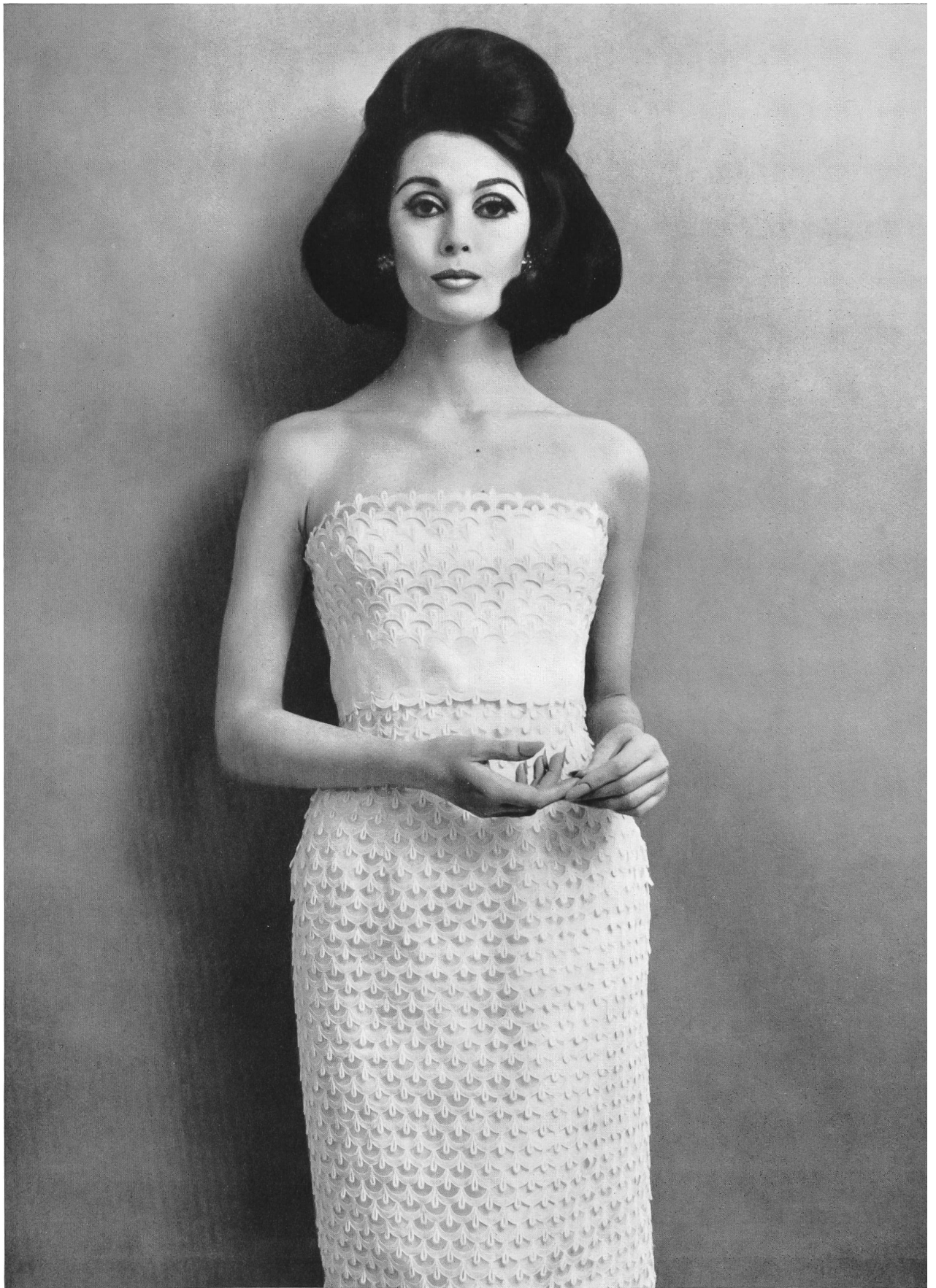
CARVEN Laize et bordure en broderie découpée sur organdi de Union S. A., Saint-Gall Grossiste à Paris: Pierre Brivet, S. à r. l.