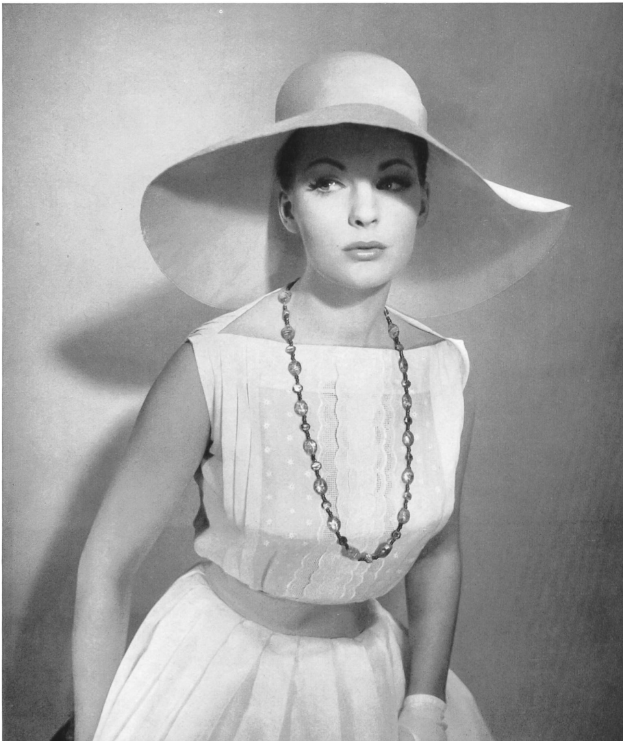
GUY LAROCHE « Nelo », broderie coton « Belrosa » Minicare de J. G. Nef & Co. S. A., Hérisau