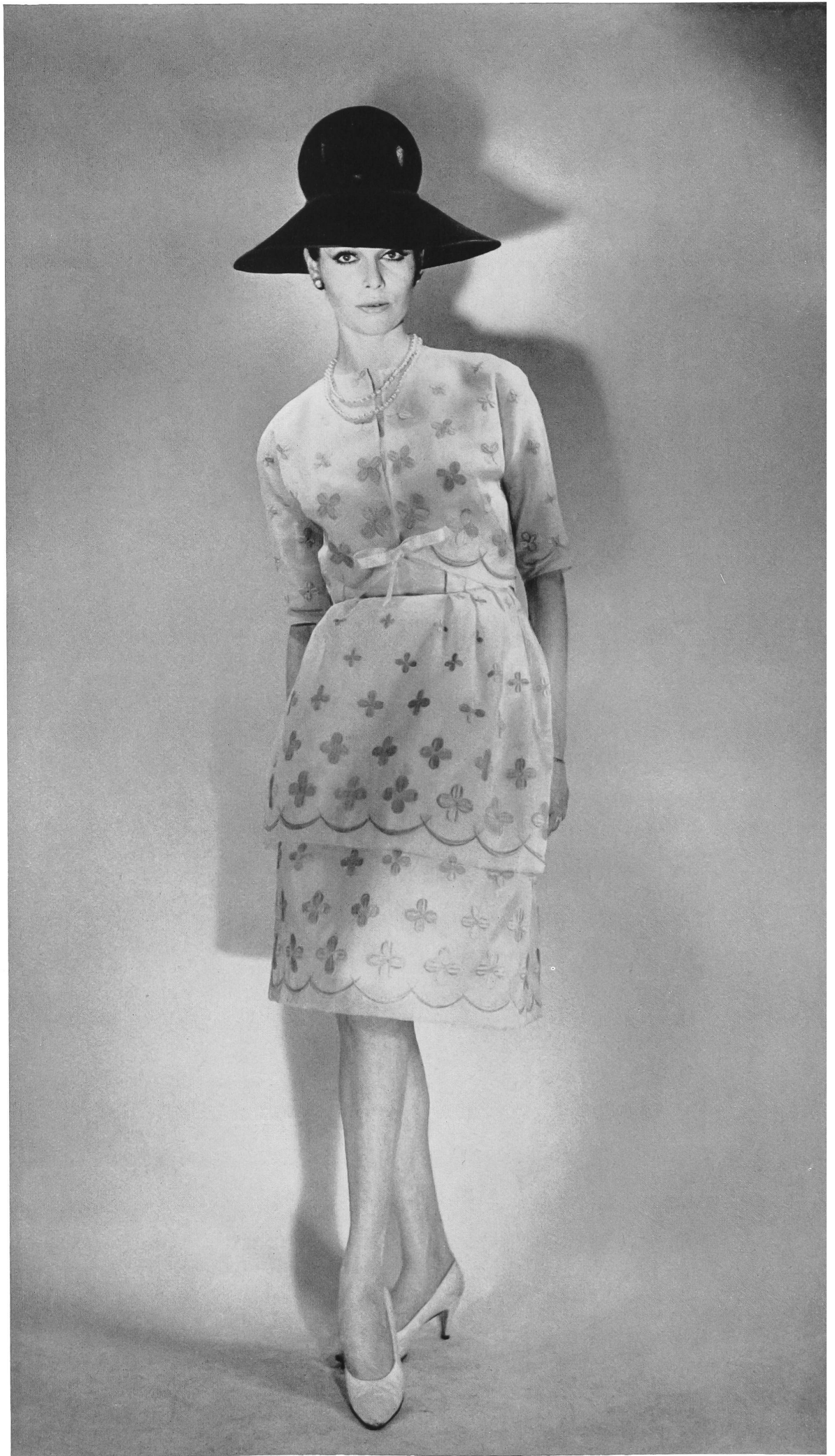
BERNARD SAGARDOY Laize d'organdi de soie brodé couleur de Union S. A., Saint-Gall