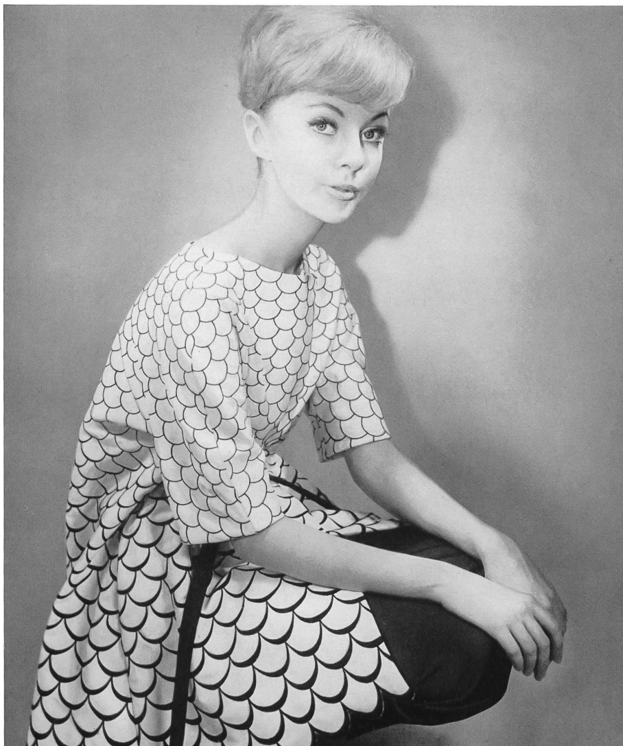
CHRISTIAN DIOR (Boutique) Bordure brodée sur piqué de Forster Willi & Co., Saint-Gall