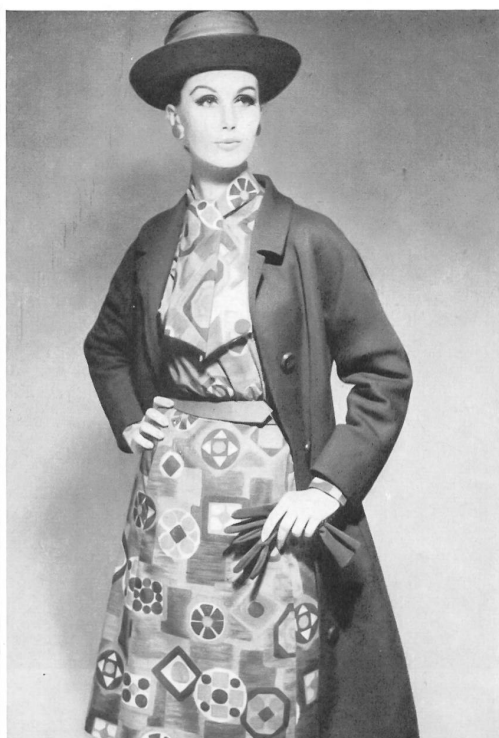
HAUSAMMANN TEXTILES S. A., WINTERTHUR

Popeline imprimée, 67 % Diolène, 33 % coton.