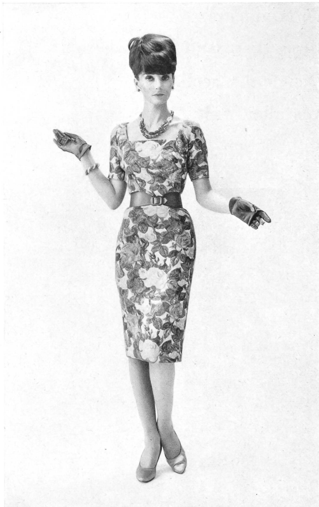
METTLER & CIE S.A., SAINT-GALL Brocart de coton Cotton brocade Modèle Wilson Folmar pour Edward Abbott Bijoux de / Jewellery by Cartier, New York