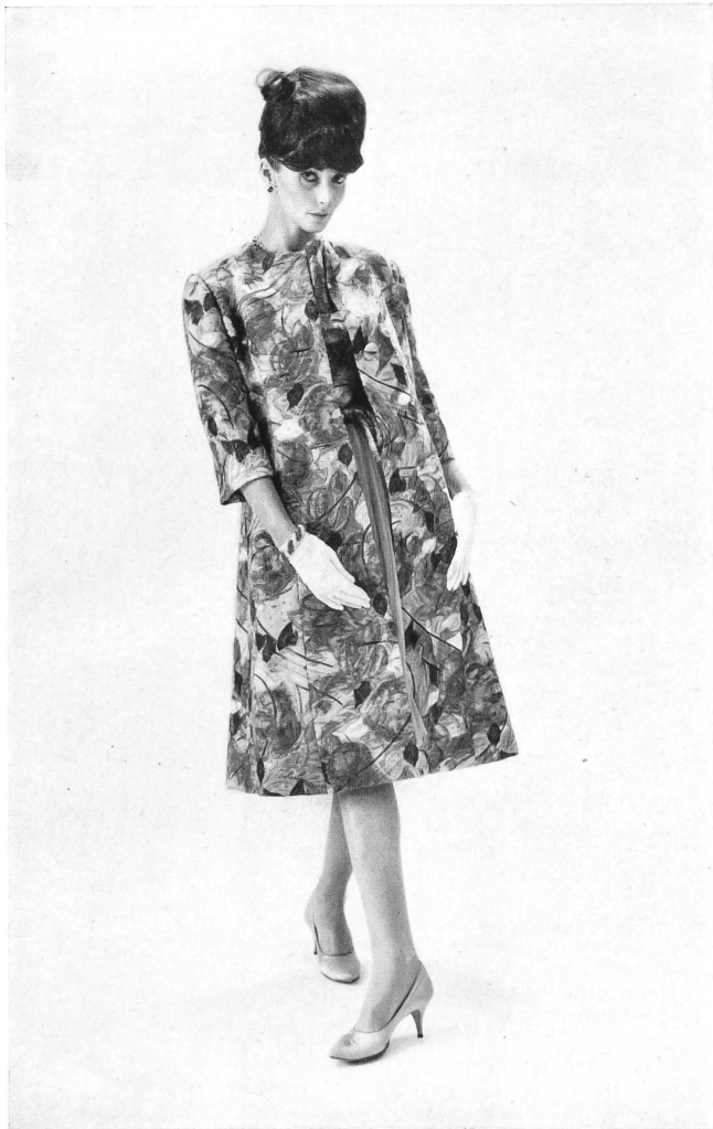
METTLER & CIE S.A., SAINT-GALL Brocart de coton Cotton brocade Modèle Philip Hulitar, New York Bijoux de / Jewellery by Cartier, New York