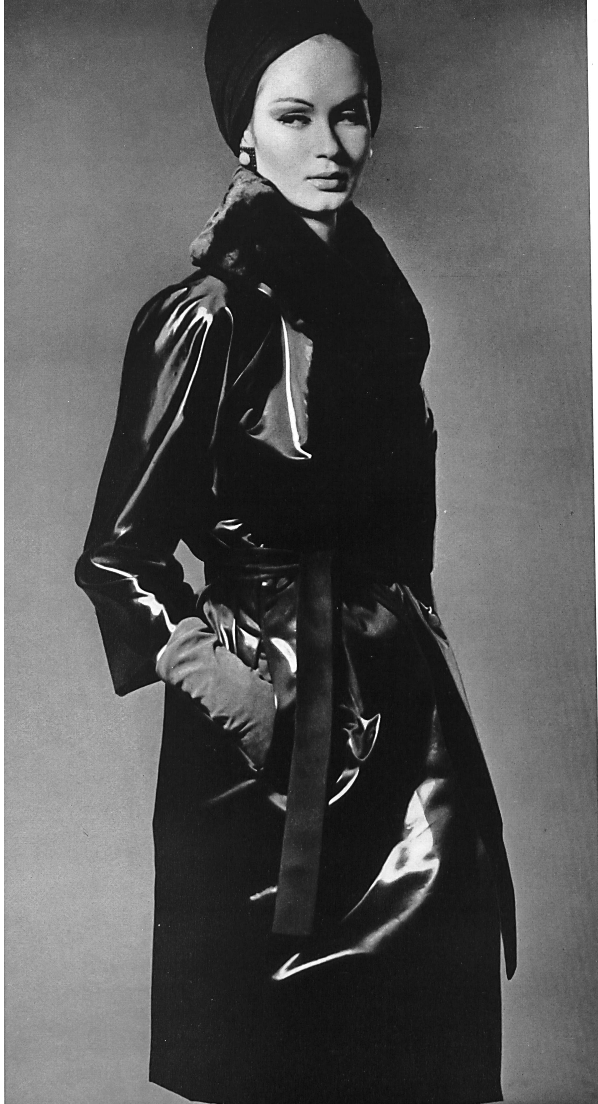
YVES SAINT-LAURENT Satin ciré noir de L. Abraham & Cie, Soieries S. A., Zurich