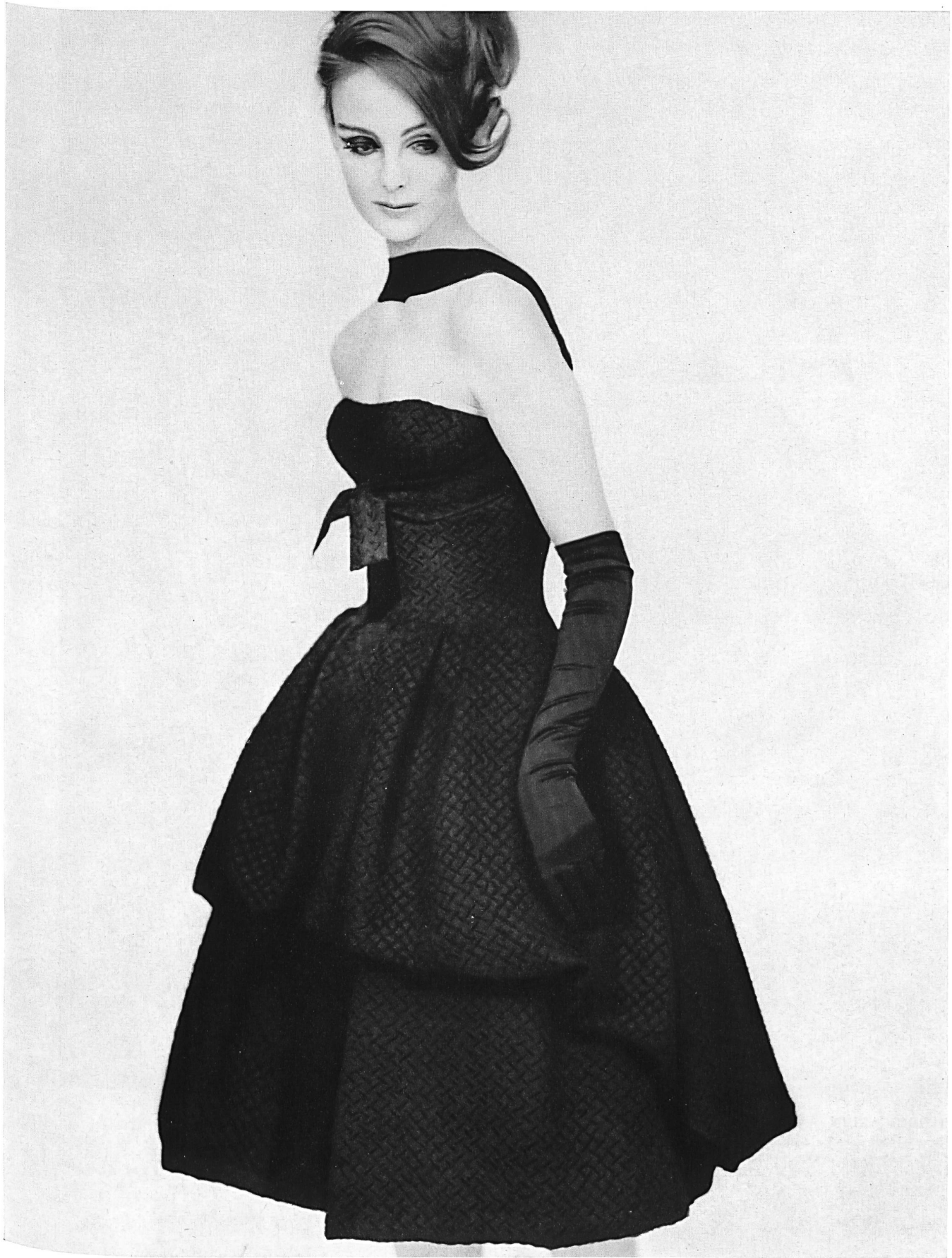
LANVIN CASTILLO Soie noire cloquée « Carioca » de L. Abraham & Cie, Soieries S. A., Zurich