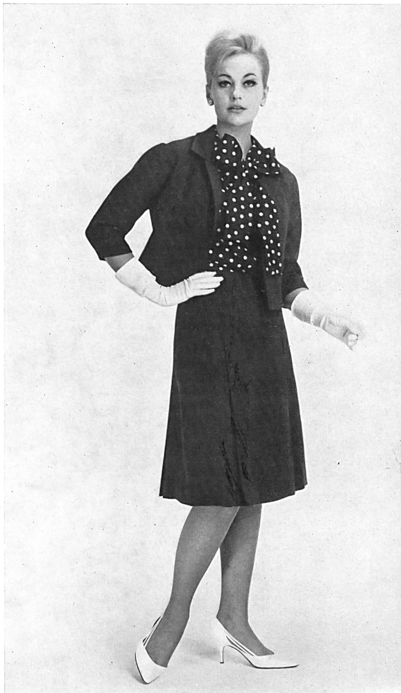
« ZURRER », WEISBROD-ZÜRRER SÖHNE, HAUSEN a. A. Tissu / Gewebe « Canton Lascara » Modèle Honico A/S, Kopenhague