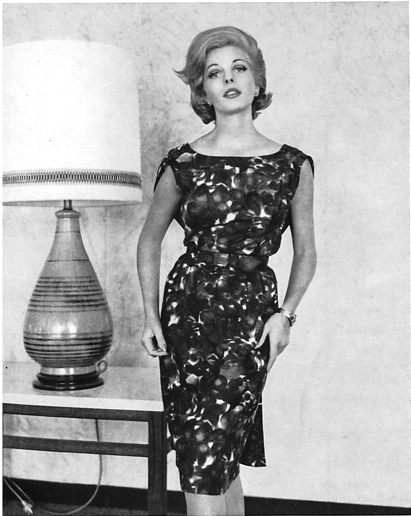
BÉGÉ S. A., ZURICH Tissu / Fabric « bégé-Atlantic » Modèle Sharene, Melbourne