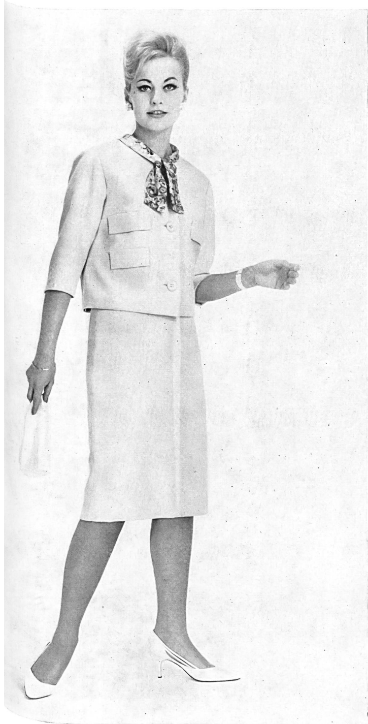
« ZURRER », WEISBROD-ZÜRRER SÖHNE, HAUSEN a. A. Tissu/Gewebe « Canton Lascara » Modèle Honico A/S, Kopenhague