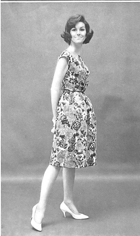
3 METTLER & CIE S. A., SAINT-GALL Impression multicolore sur coton à côtes Multicolored print on ribbed cotton fabric Modèle Adele Simpson, Inc., New York