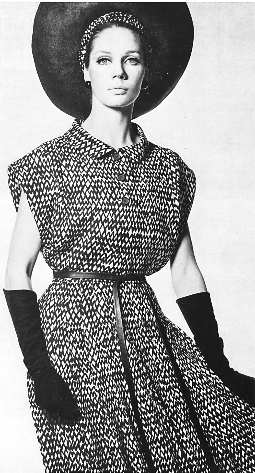
CHRISTIAN DIOR Crêpe « Caroline » imprimé de L. Abraham & Cie, Soieries S. A., Zurich