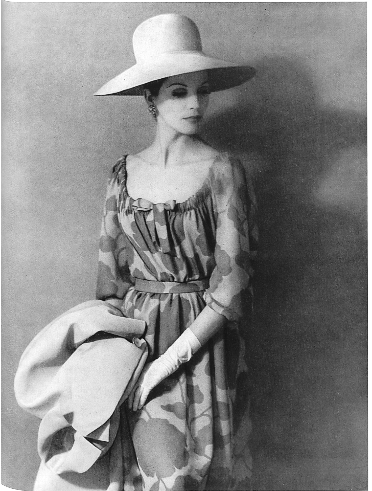
GUY LAROCHE Robe de cocktail en mousseline « Edéa » imprimée et manteau en « Gazar » de L. Abraham & Cie, Soieries S. A., Zurich