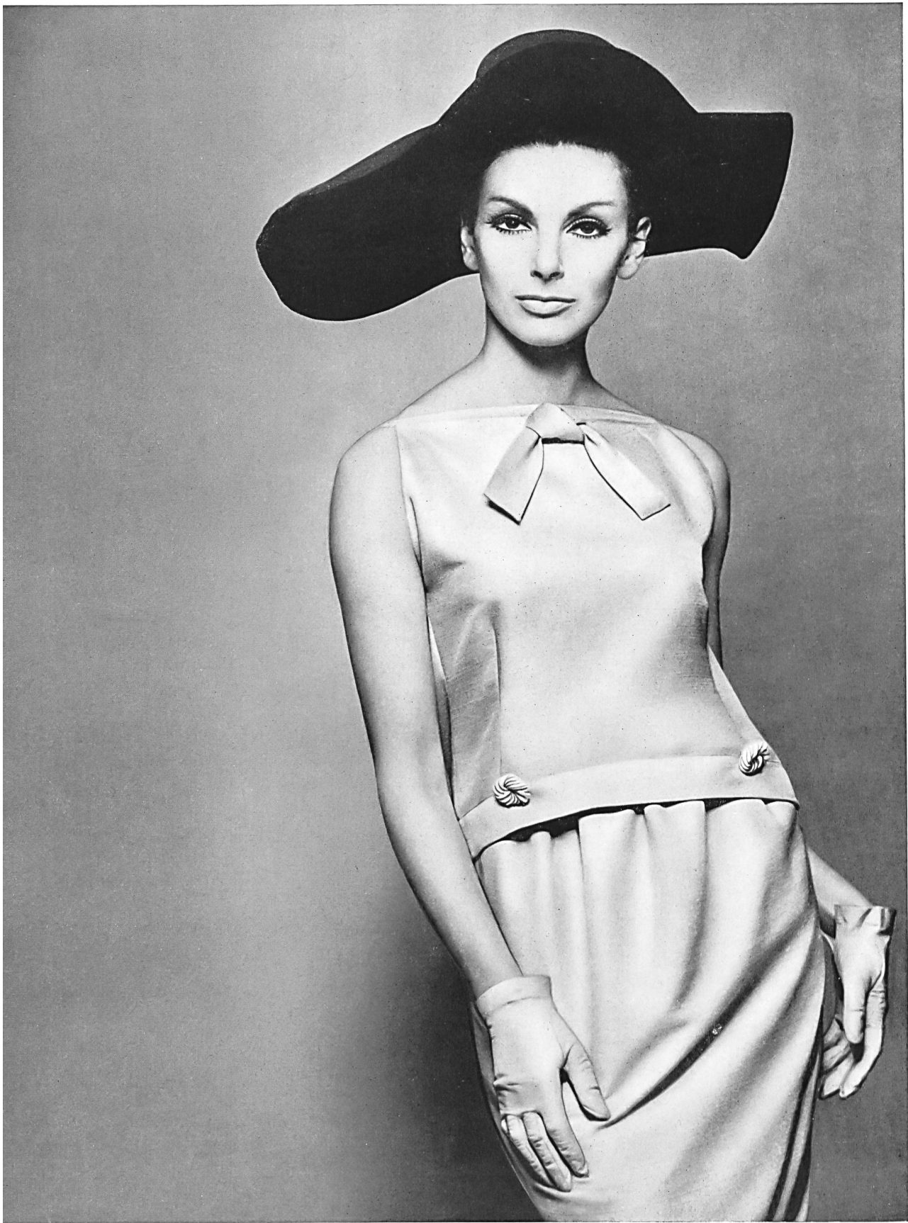
PIERRE CARDIN Shantung « Favorite » pure soie de Robt. Schwarzenbach & Co., Thalwil