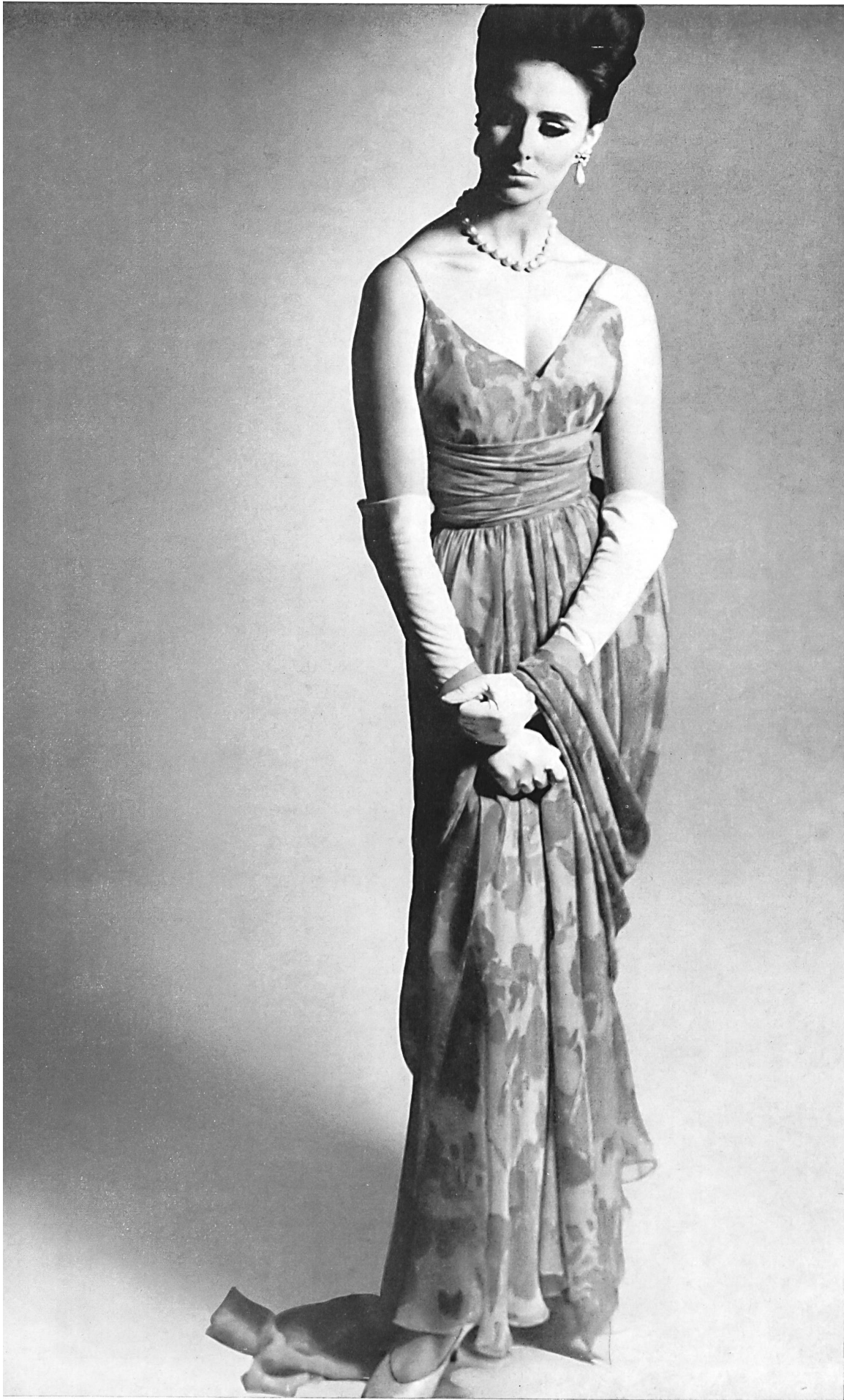
PIERRE BALMAIN Mousseline « Edéa » imprimée de L. Abraham & Cie, Soieries S. A., Zurich