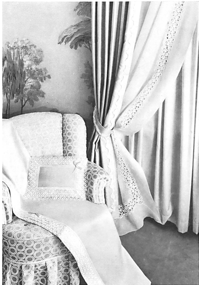
Drap de dessus, appuie-tête et rideaux avec galon brodé incrusté — Top sheet, antimacassar and curtains with embroidered braid insertions — Sábana de encima, almohada y cortinas, con galones bordados incrustados — Oberleintuch, Nackenkissen und Gardinen mit eingesetzten Stickereigalon