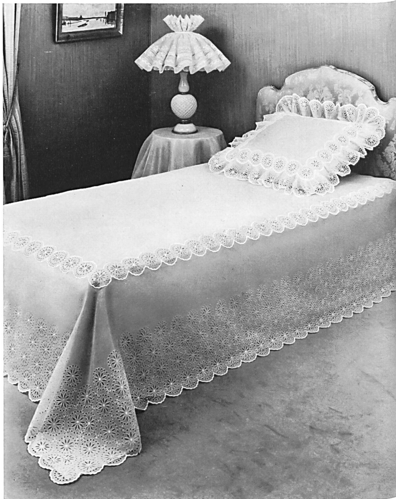
Dessus de lit et coussin d'apparat en broderie anglaise; abat-jour en organdi brodé — Bedspread and decorative cushion in eyelet embroidery; lampshade in embroidered organdie — Cubrecama y almohadón en punto inglés; pantalla de organdí bordada — Bettüberwurf und Zierkissen in Lochstickerei; Lampenschirm aus besticktem Organdi