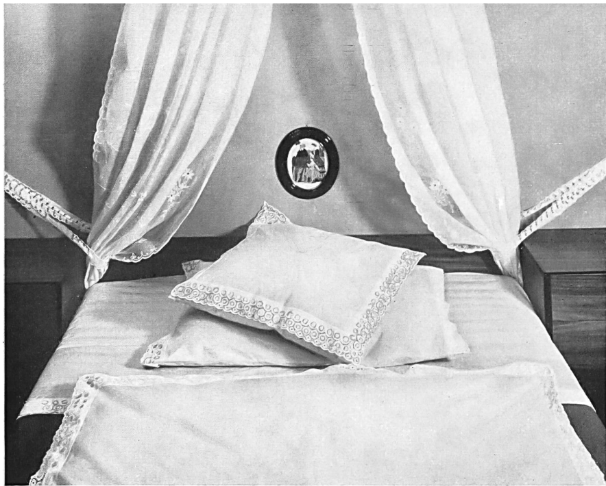
MAX SANDHERR A.G., BERNECK Rideaux en mousseline de coton brodée Curtains in embroidered cotton muslin Cortinas de muselina de algodón bordada Vorhang aus besticktem Baumwoll-Mousseline