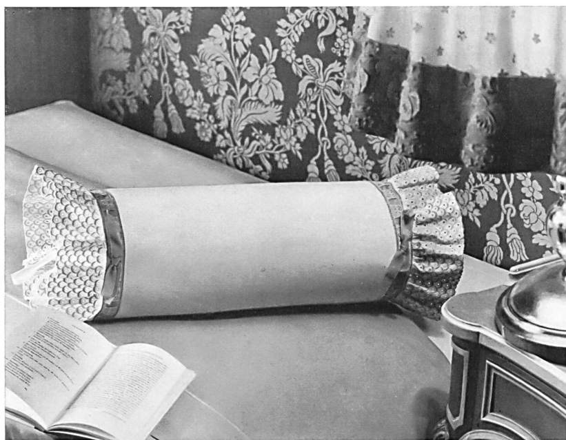
Appuie-tête avec broderie de couleur Antimacassar with coloured embroidery Almohadón con bordado en colores Nackenkissen mit farbiger Stickerei