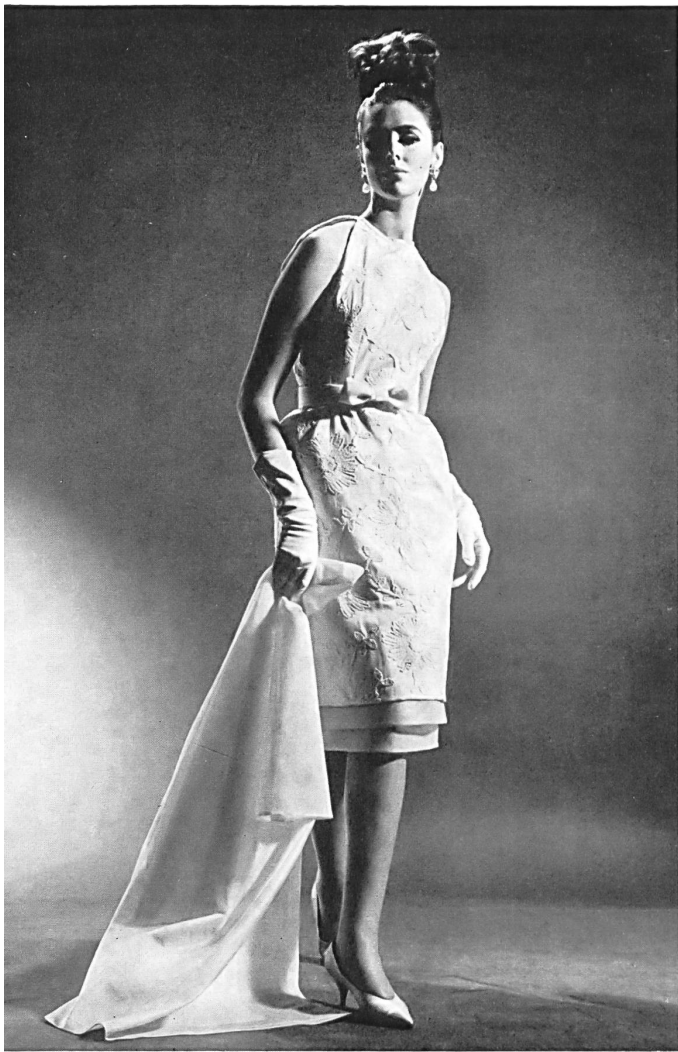
Shantung de coton brodé suisse Embroidered Swiss cotton Shantung Shantung de algodón bordado suizo Bestickter Schweizer Baumwoll-Shantung Modèle Jeanpalmério, Zurich