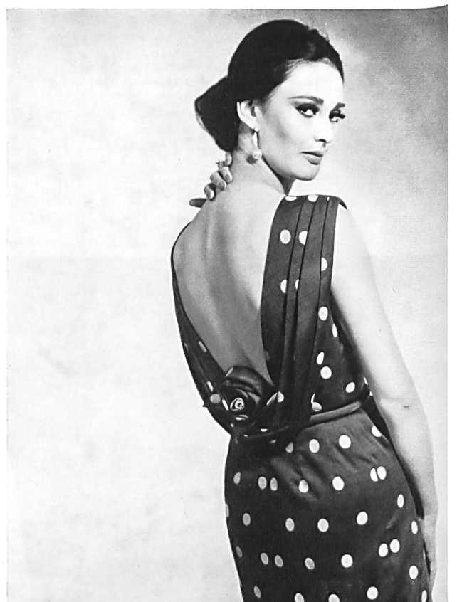
STOFFEL S. A., SAINT-GALL Shantung de coton à dessin plumetis Cotton shantung with dotted Swiss sample Shantung de algodón con dibujos de plumetis Baumwollshantung mit Plumetis-Dessin Modèle Couture Marianne, Saint-Gall

donc voir, d'un seul coup d'œil, les prises de vues de la TV dans un studio aménagé sur la scène et leur retransmission directe en couleurs sur l'écran placé au-dessus. Ajoutons que l'emploi de l'Eidophore avait ceci d'intéressant qu'il permettait de présenter à volonté en tout gros plan, à la salle entière, le détail des tissus et broderies utilisés.