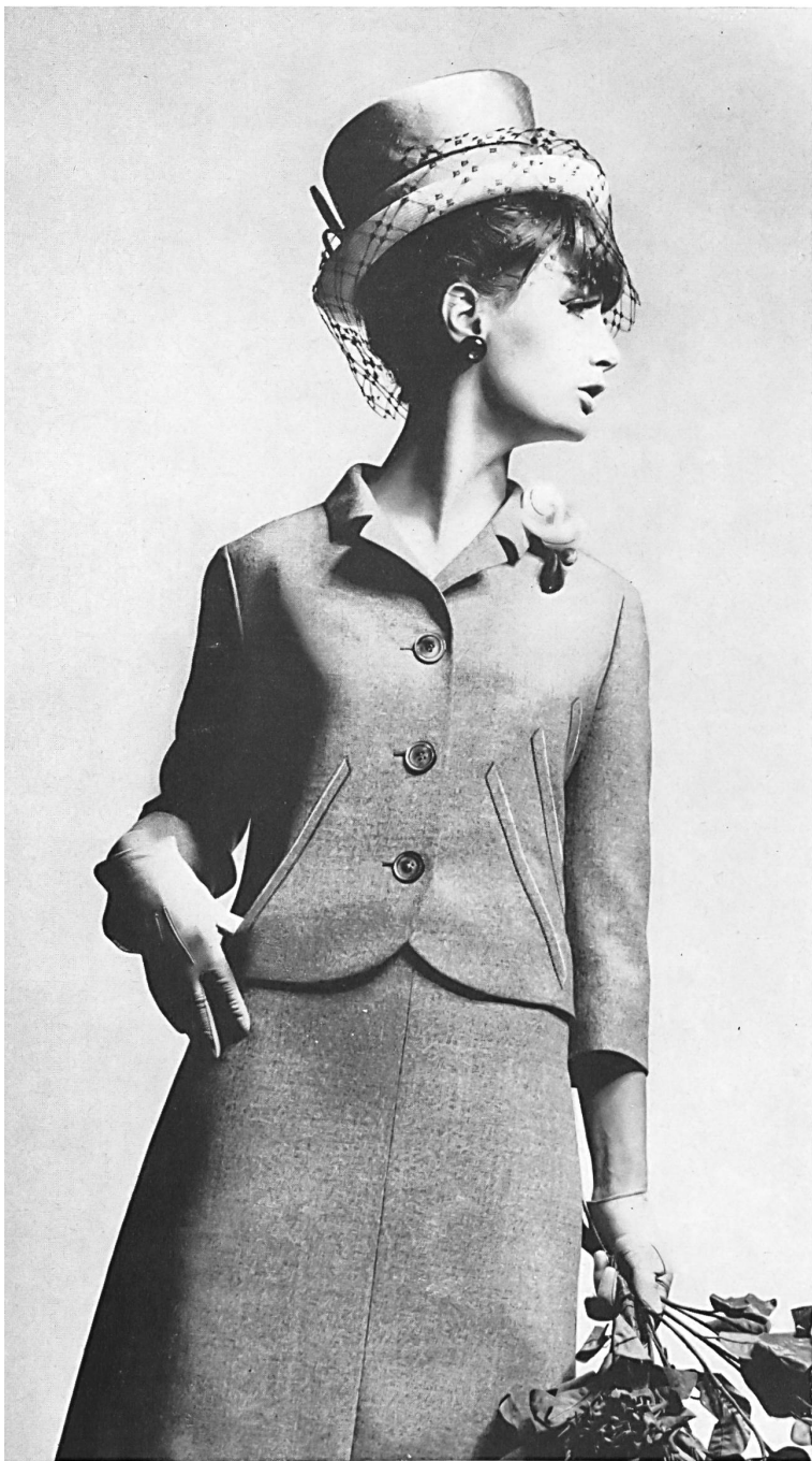
GLENN BOUTIQUE, HASLER & CO., ZURICH Tailleur nervuré en lainage gris Grey woollen ribbed suit Traje sastre de lana gris con respunteados decorativos Graues Kostüm aus Wollstoff mit Biesen