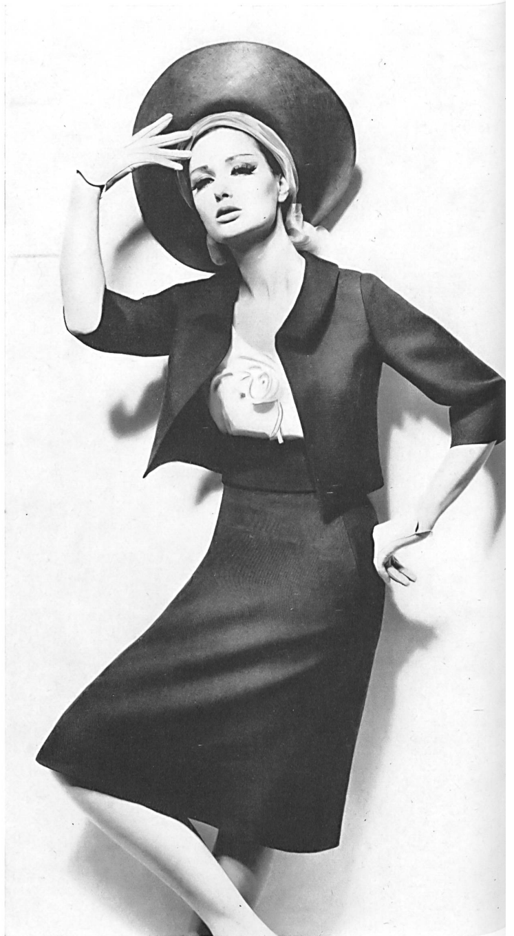
GLENN BOUTIQUE, HASLER & CO., ZURICH Ensemble en lainage marine et crêpe blanc Attractive outfit in navy blue wool and white crêpe Conjunto de lana azul marino y crespón blanco Ensemble aus marineblauem Wollstoff und weissem Crêpe