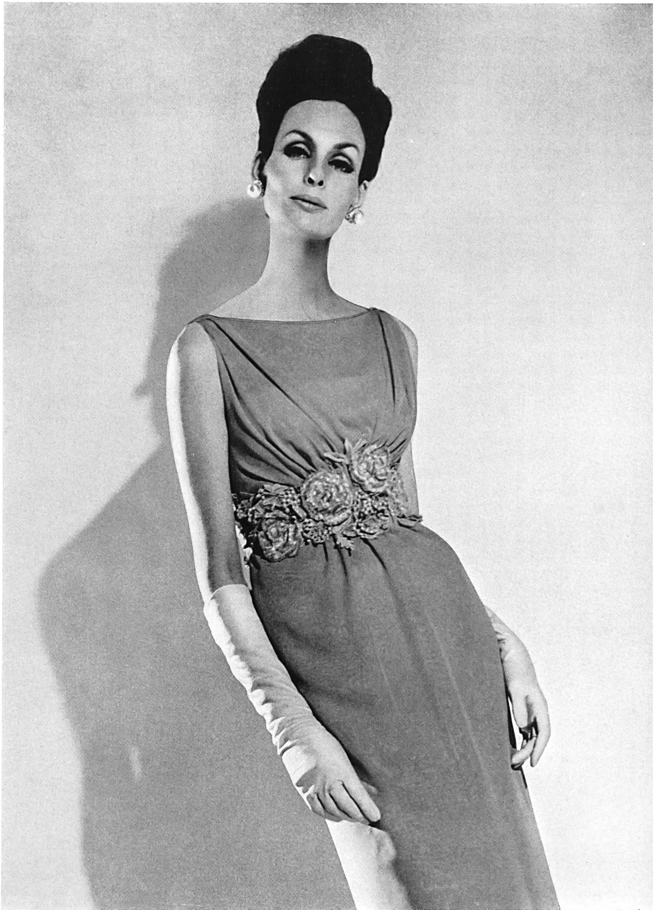
FERRERAS Galon en guipure et chenille de Forster Willi & Co., Saint-Gall Grossiste à Paris: Les Tisseurs B. de M.