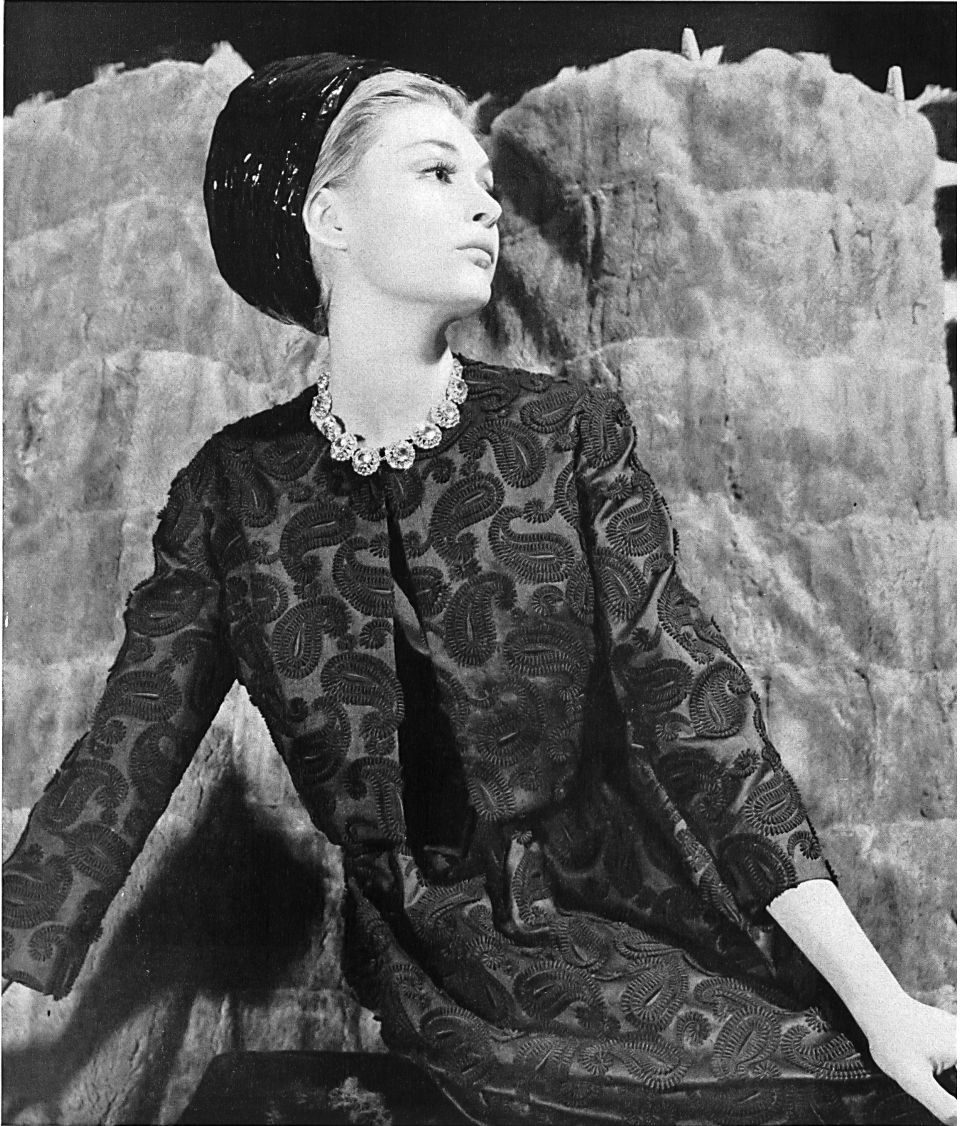
GUY LAROCHE Broderie superposée sur shantung pure soie de Walter Stark, Saint-Gall Grossiste à Paris: Robert Burg & Cie

MODÈLES EXCLUSIFS - REPRODUCTION INTERDITE