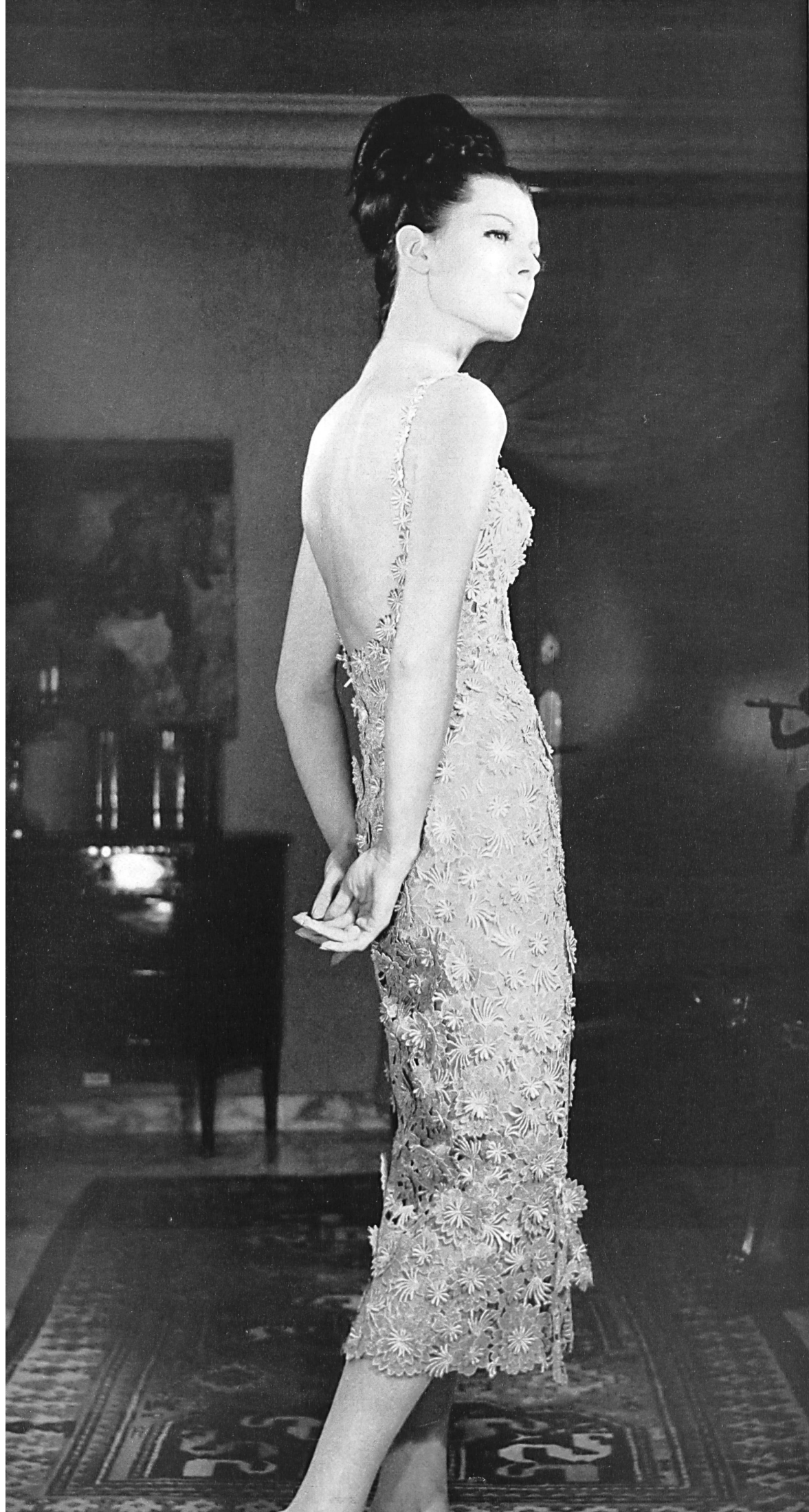
JACQUES HEIM Broderie riche en or de A. Naef & Cie S. A., Flawil/Saint-Gall Grossiste à Paris: Robert Burg & Cie