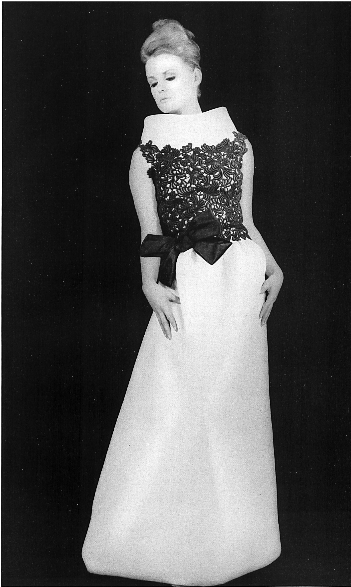
JEAN PATOU Guipure de couleur de Union S.A., Saint-Gall Grossiste à Paris: Robert Burg & Cie