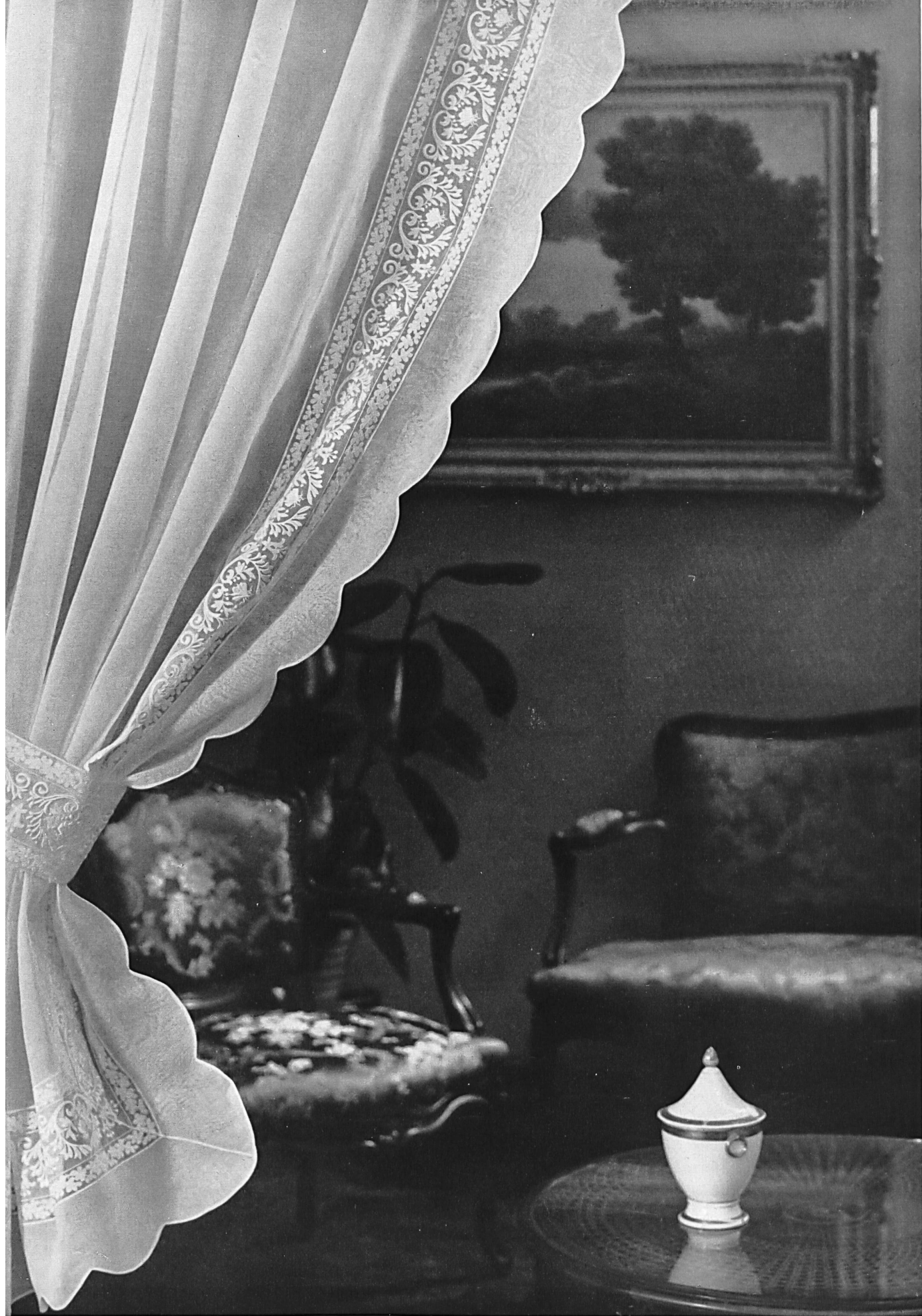
FORSTER WILLI & CO., SAINT-GALL Rideau d'organdi avec galon de broderie incrusté Organdie curtain with embroidered braid insertion Cortina de organdi con galón de bordado incrustado Organdivorhang mit eingesetztem Stickereigalon