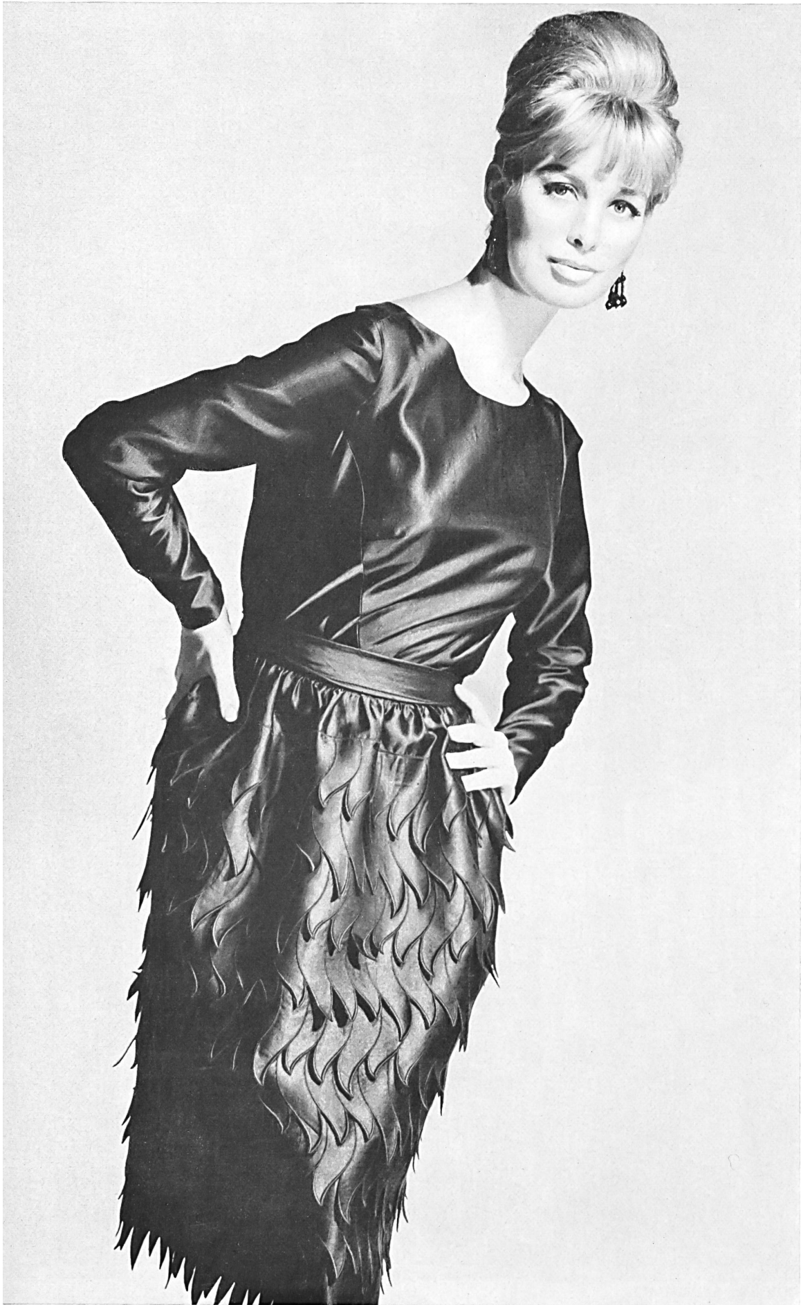
A NAEF & CIE S.A., FLAWIL Broderie / Stickerei Modèle Toni Schiesser, Francfort s. l. Main