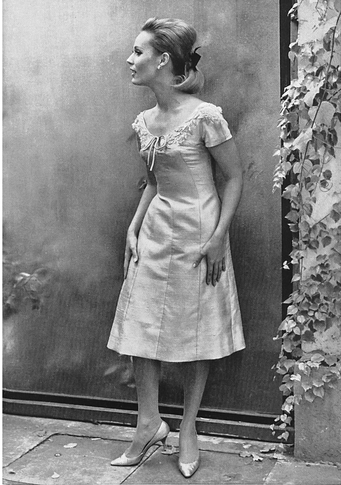
RUDOLF BRAUCHBAR & CIE S.A., ZURICH Zanzibar, pure soie / pure silk / seda pura / reine Seide Modèle Schwichtenberg & Co., Berlin

tiques. La quantité des fibres produites par la chimie et des combinaisons que l'on peut pratiquer entre elles ou avec des fibres naturelles, sous plus de cent noms différents, a fait de ce domaine un maquis dans lequel les spécialistes même ne se retrouvent plus.