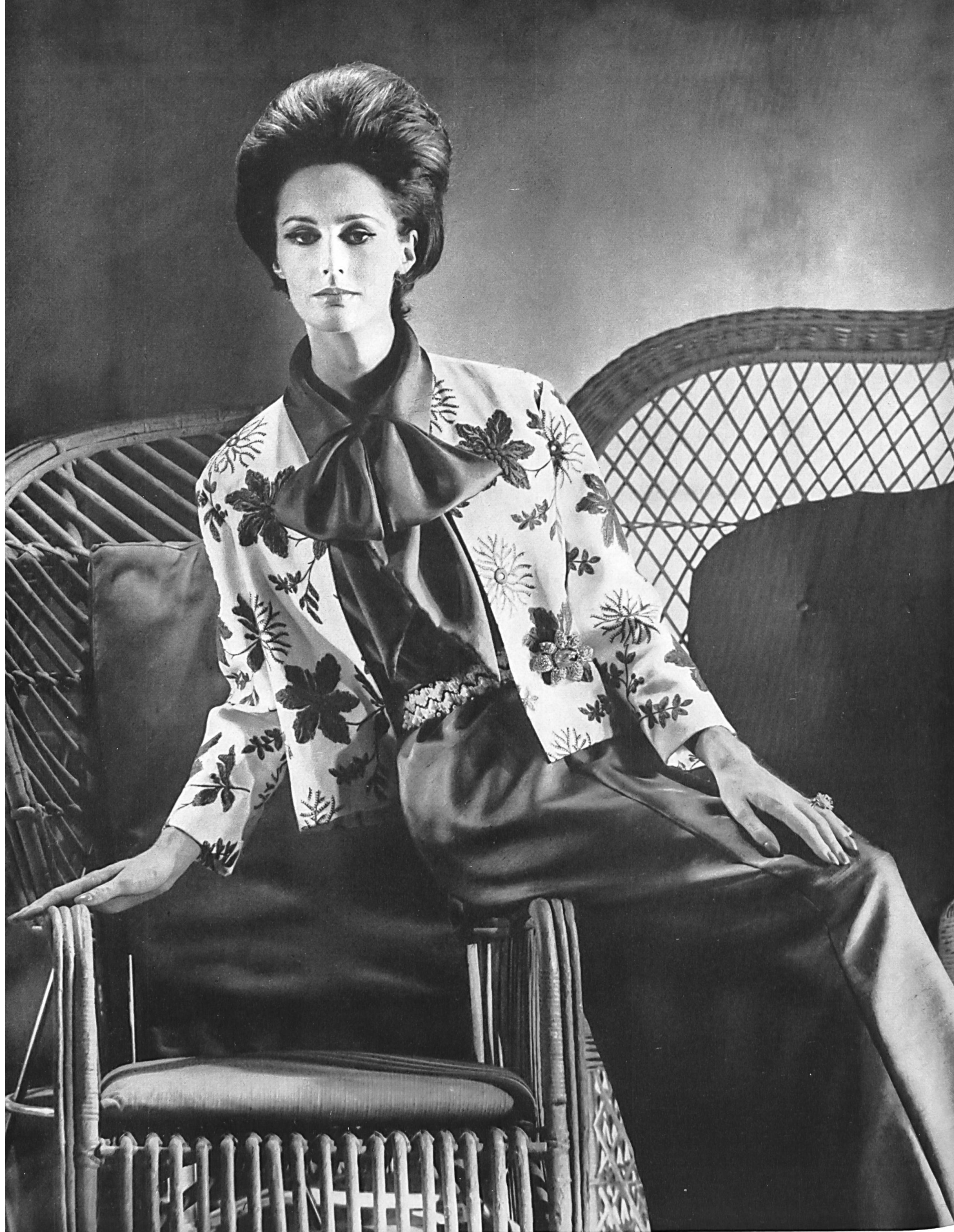
FORSTER WILLI & CO., SAINT-GALL Piqué de coton brodé (jaquette) Bestickter Baumwollpiquee (Jacke) Modèle Uli Richter, Berlin