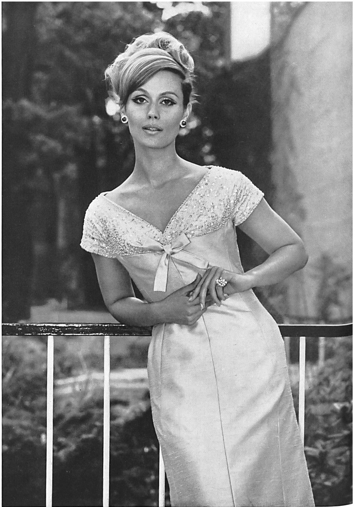
RUDOLF BRAUCHBAR & CIE S.A., ZURICH Zanzibar, pure soie / pure silk / seda pura / reine Seide Modèle Schwichtenberg & Co., Berlin

maintenant en Allemagne) ou qui éclairent joliment de petites robes noires.