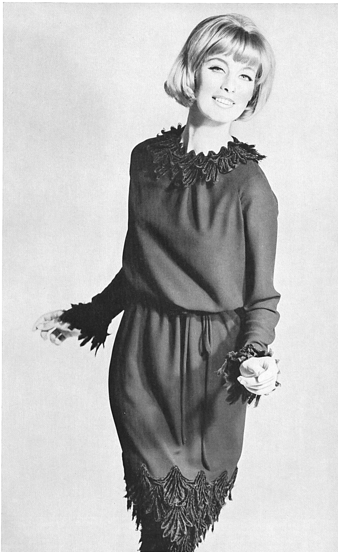
A. NAEF & CIE S.A., FLAWIL Broderie chenille noire Schwarze Chenillestickerei Modèle Toni Schiesser, Francfort s. I. Main