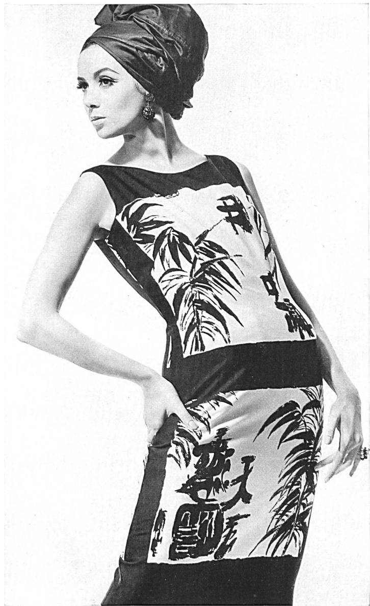
HEER & CIE S.A., THALWIL Panama de coton imprimé Baumwoll-Panama, bedruckt Modèle Lürman & Co., Rottach am Tegernsee