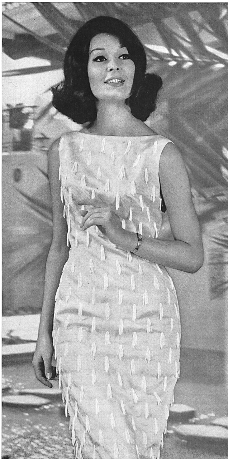
ROBT. SCHWARZENBACH & CO., THALWIL Sandu Tassel (tissu / fabric / tejido / Gewebe) Modèle Schröder-Wulf, Hambourg

De merveilleuses broderies très exclusives sur piqué, blanc sur blanc ou en couleurs avec des effets superposés, font de petites jaquettes très charmantes, qui complètent les robes de terrasse (genre qui devient aussi populaire