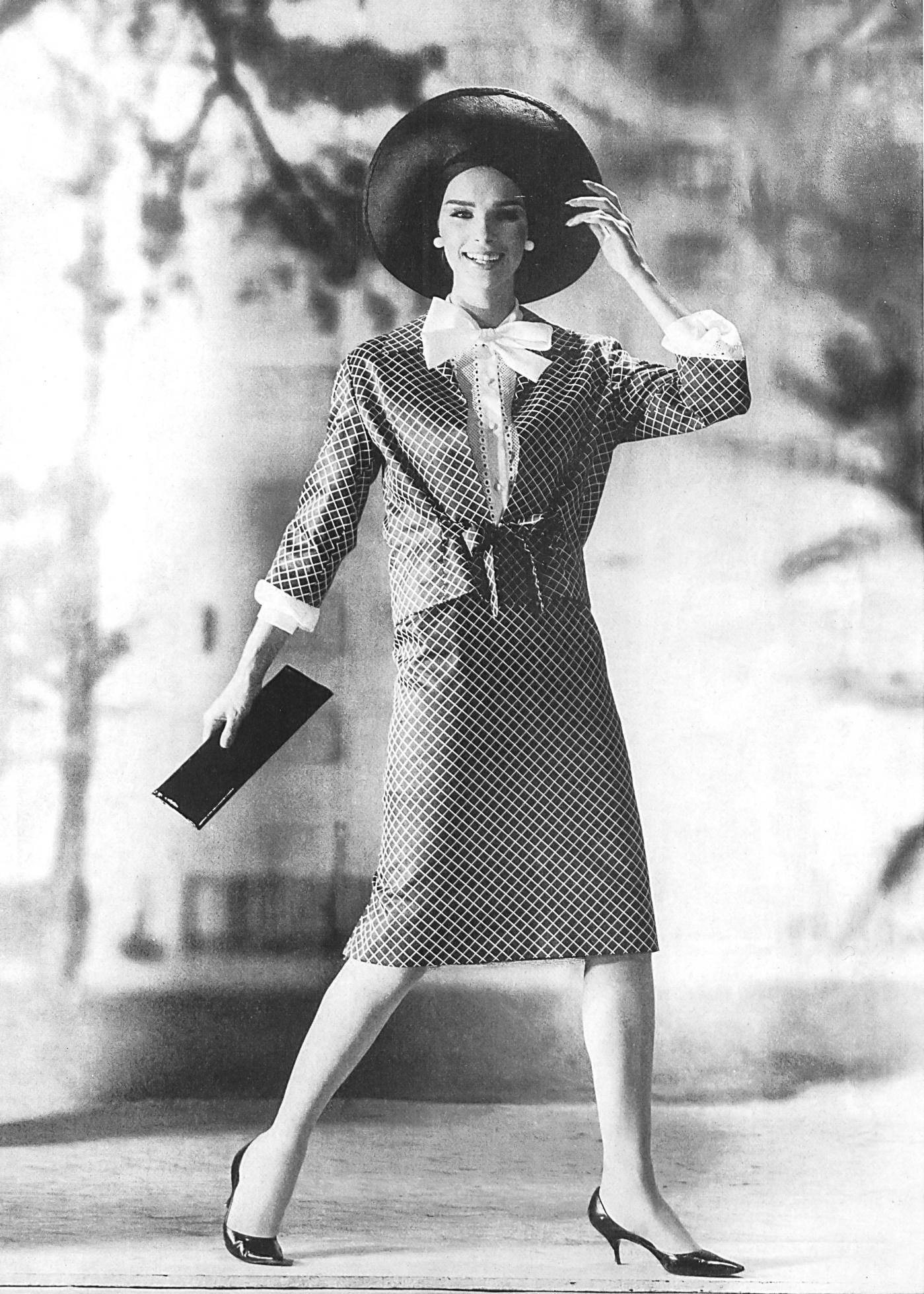
METTLER & CIE S.A., SAINT-GALL Satin de coton Baumwollsatin Modèle Lindenstaedt & Brettschneider, Berlin