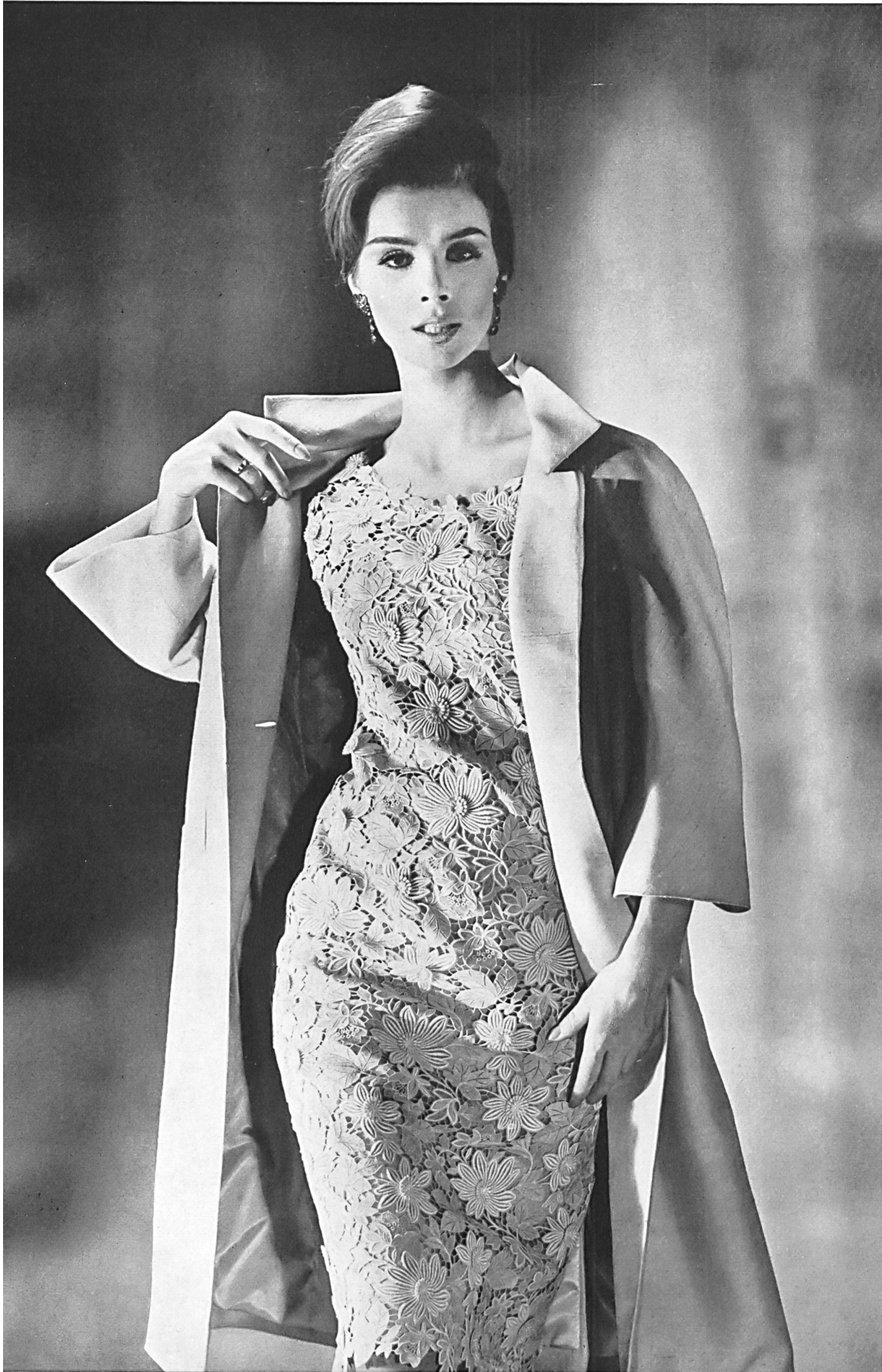
UNION S.A., SAINT-GALL Guipure lourde avec appli- cations Reiche Ätztickerei mit Applikationen Modèle Detlev Albers. Berlin