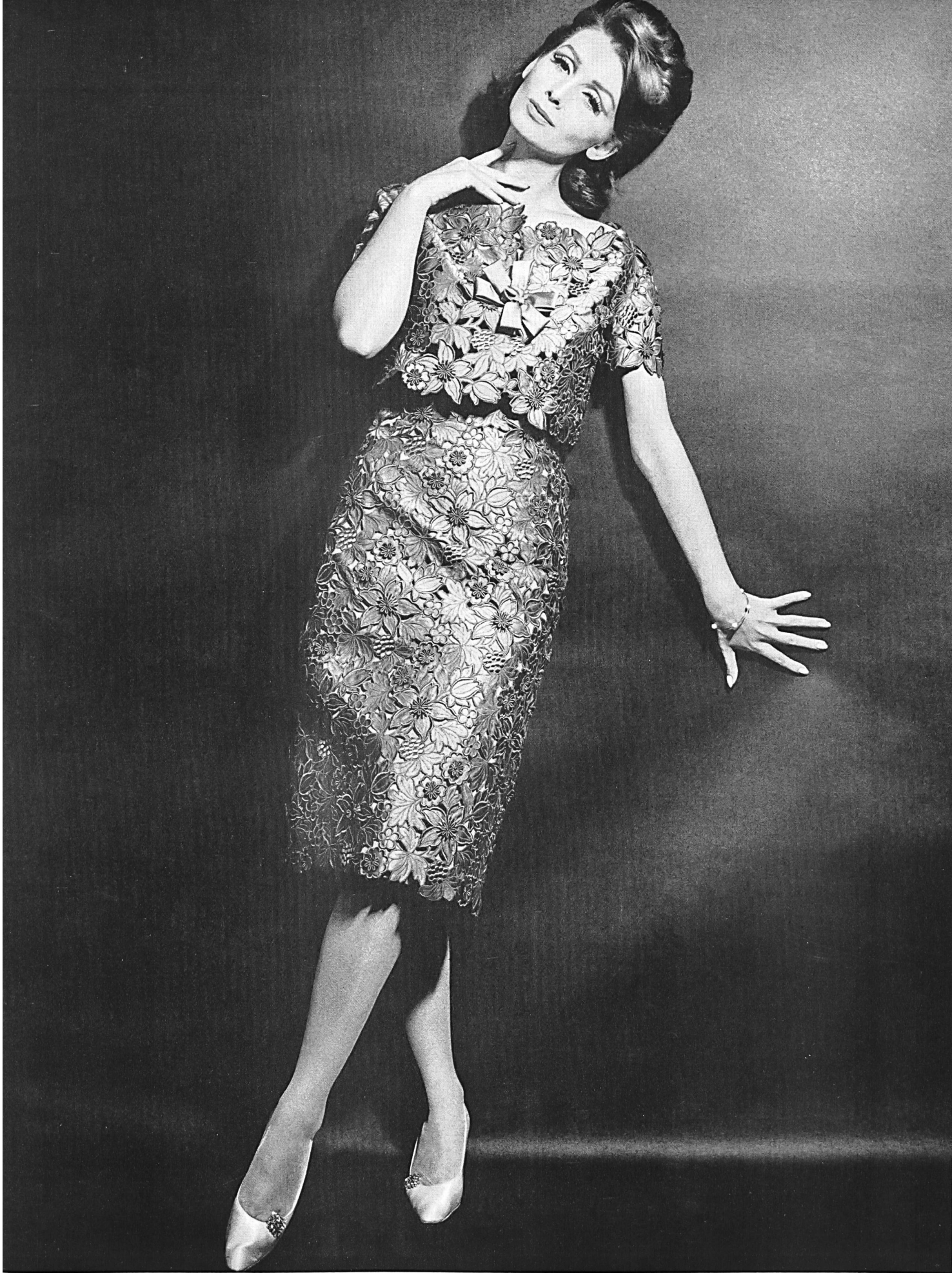
UNION S.A., SAINT-GALL Broderie découpée sur soie Seiden-Spachtelspitze Modèle Toni Schiesser, Francfort s. l. Main