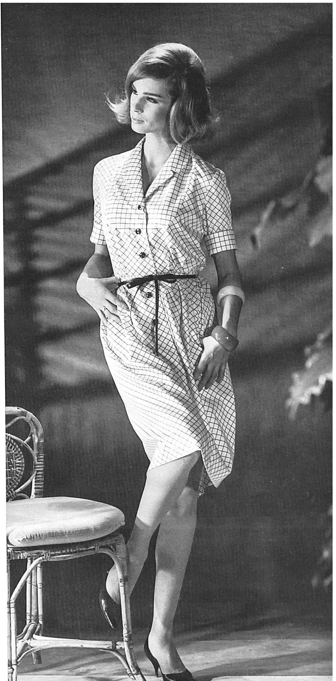
METTLER & CIE S.A., SAINT-GALL Satin de coton Baumwollsatin Modèle Lindenstaedt & Brettschneider, Berlin